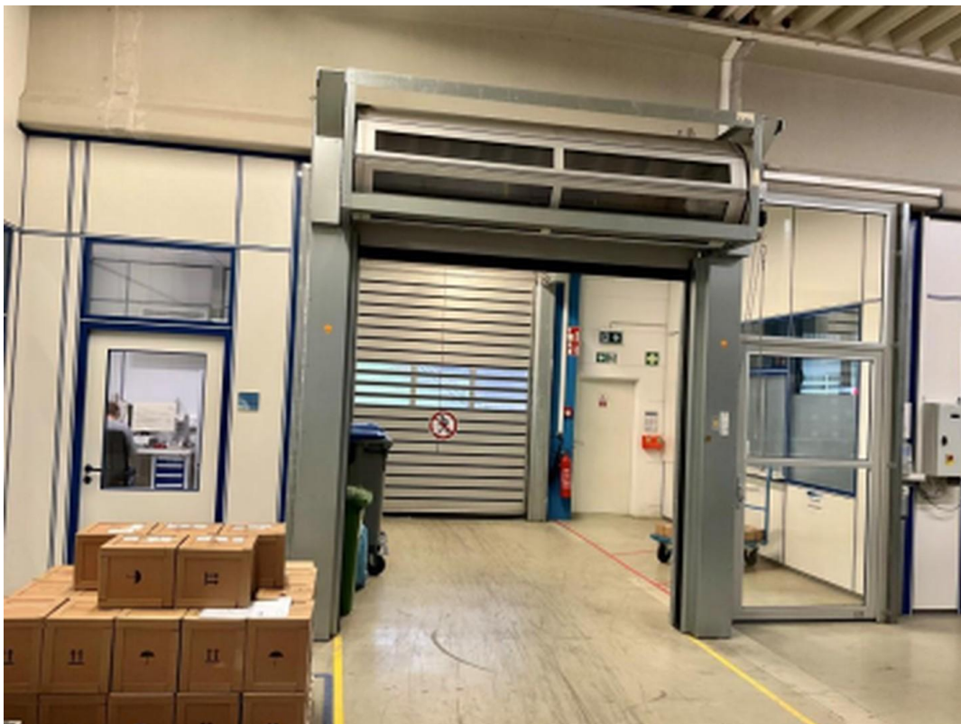
Rolltor Halle 3