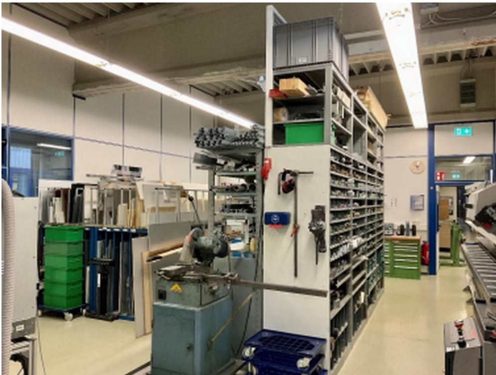
Halle 3 (Westseite)