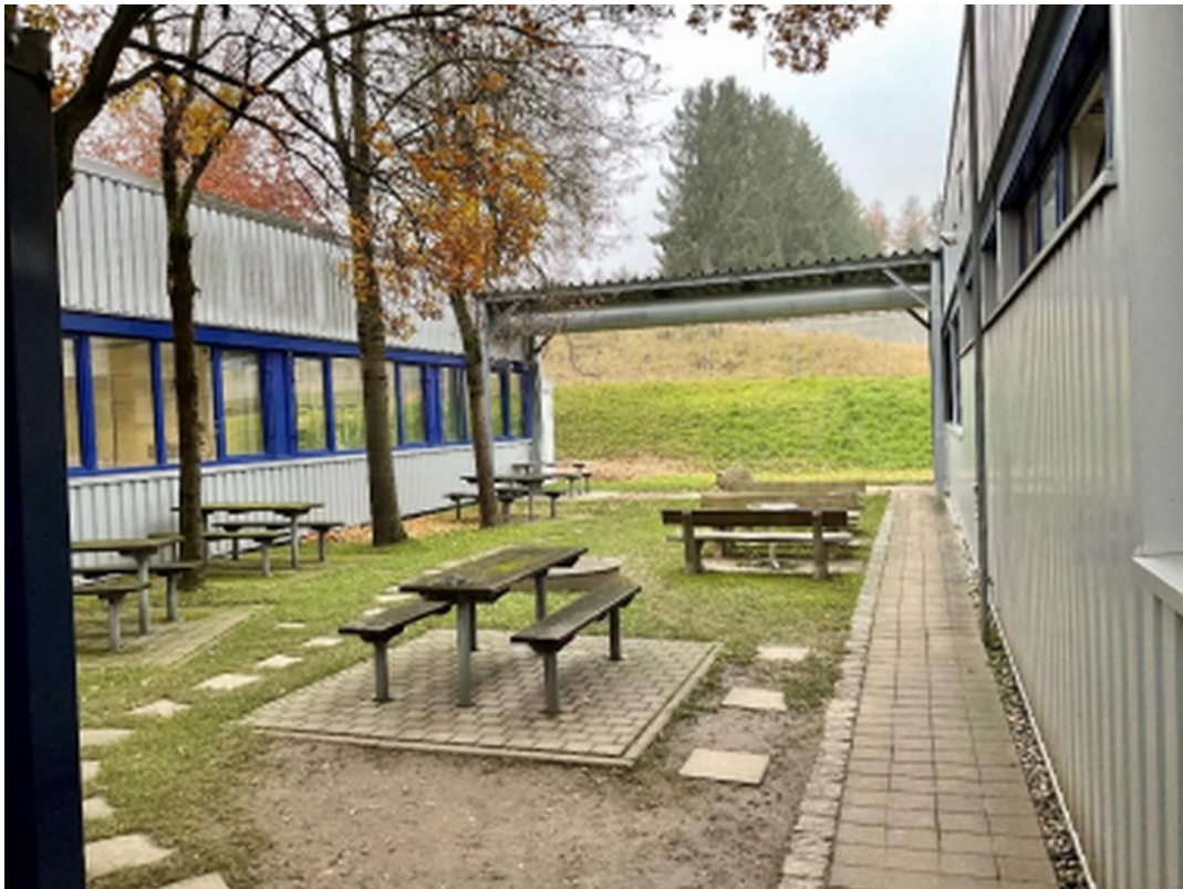
Begrünter Innenhof (Südwest)