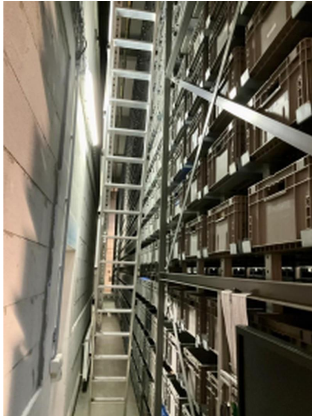
Kleinteilelager 7,77m hoch