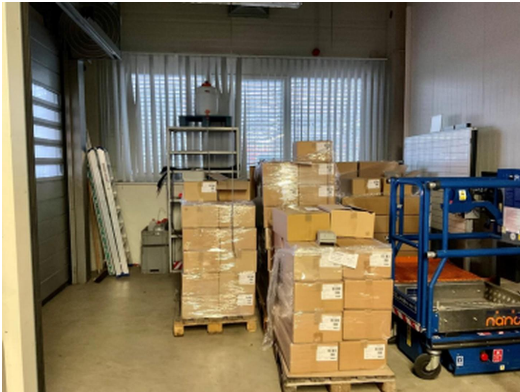
Rolltor Halle 4