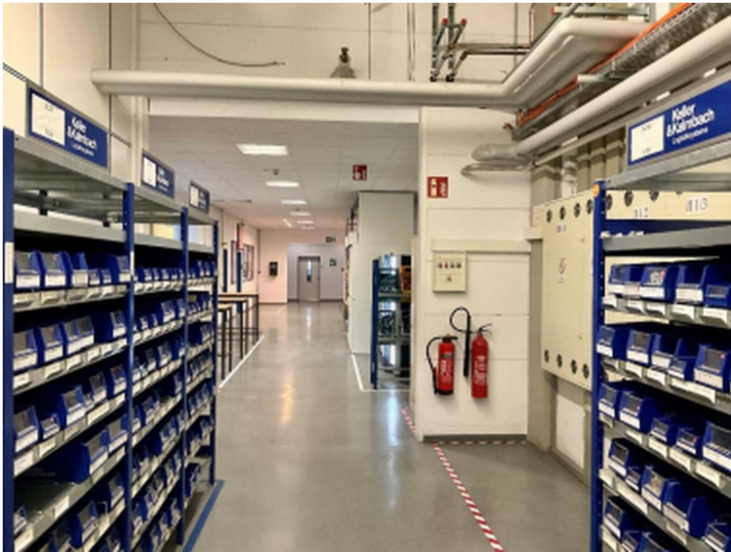
Flur zwischen Halle 1 und 2