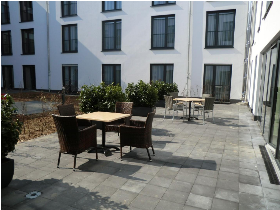
Blick auf Terrasse im Innenhof