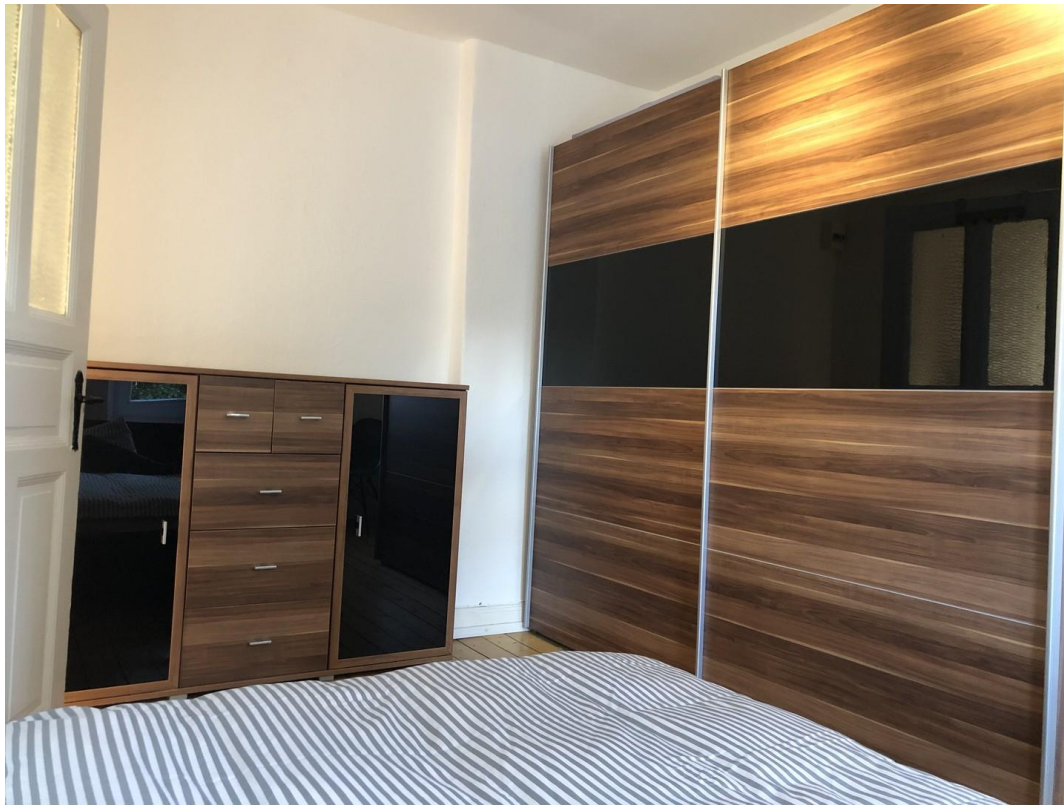
SZ Kleiderschrank + Sideboard