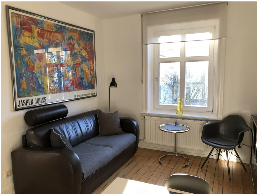
WZ Ledersofa / Sitzecke