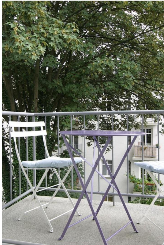
Südbalkon zum grünen Innenhof