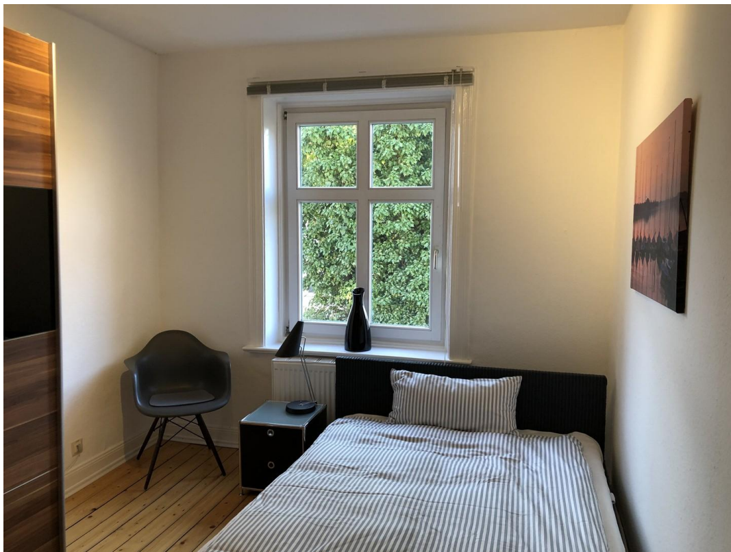
SZ Doppelbett (1,40m breit)