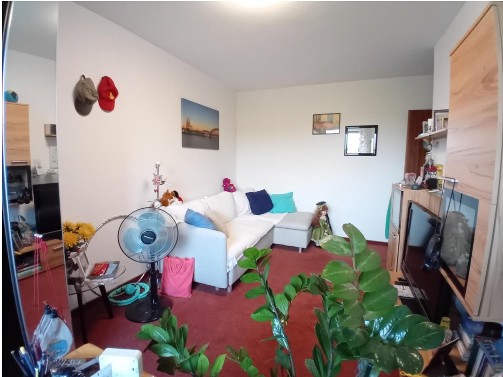
Kinderzimmer 1/Büro OG 1