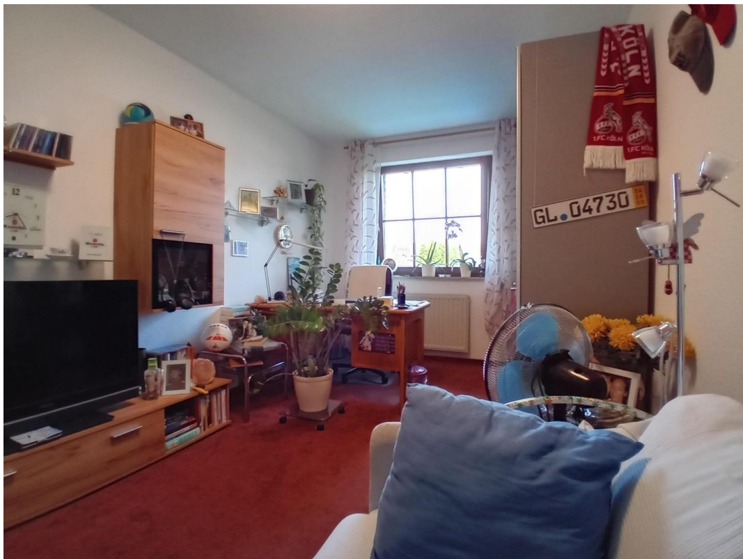
Kinderzimmer 1/Büro OG 1