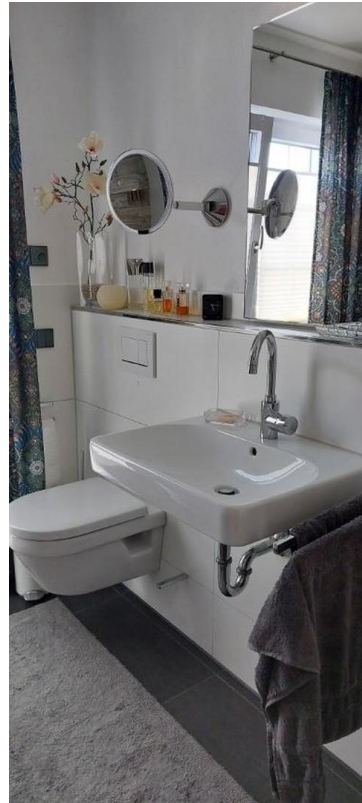
Bad Waschb. u. WC