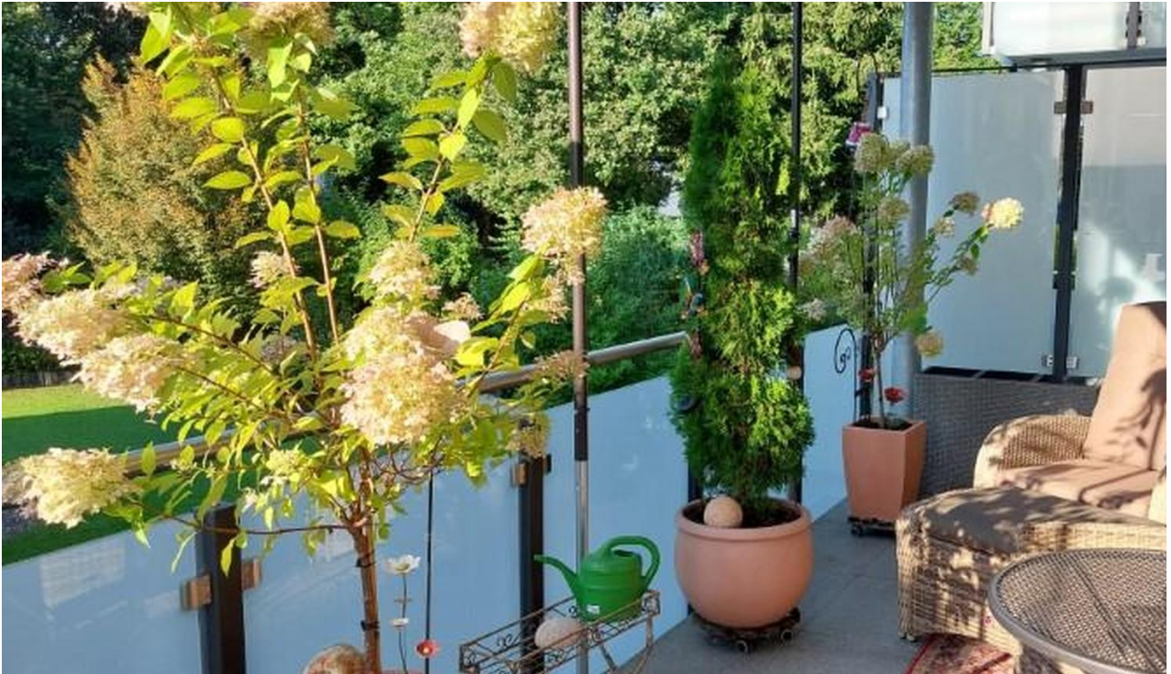
ein Platz an der Sonne