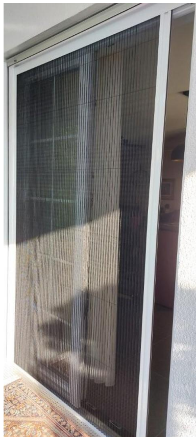
Plissee - Insektenschutz