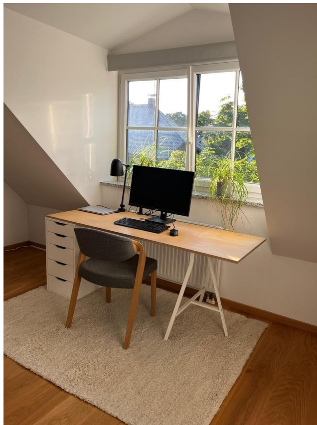
Büro (opt. Kinderzimmer)