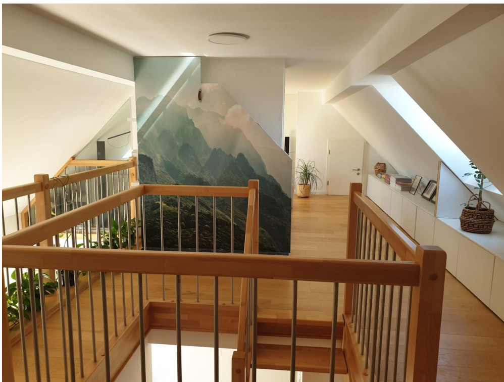
Galerie Längssicht von O