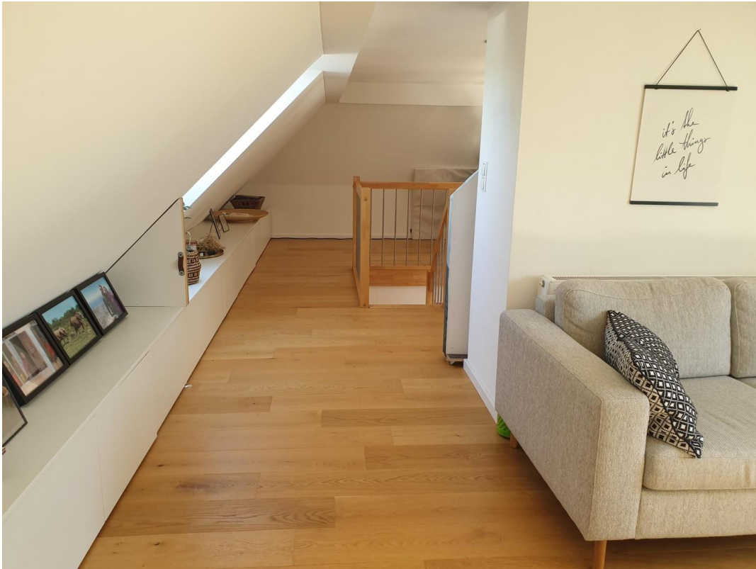
Galerie Längssicht von W