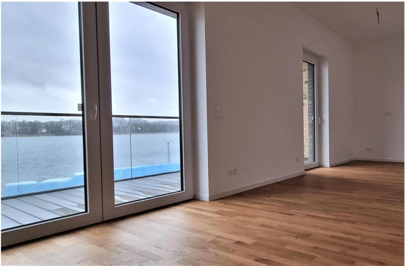
Wohnzimmer mit Wohnküche