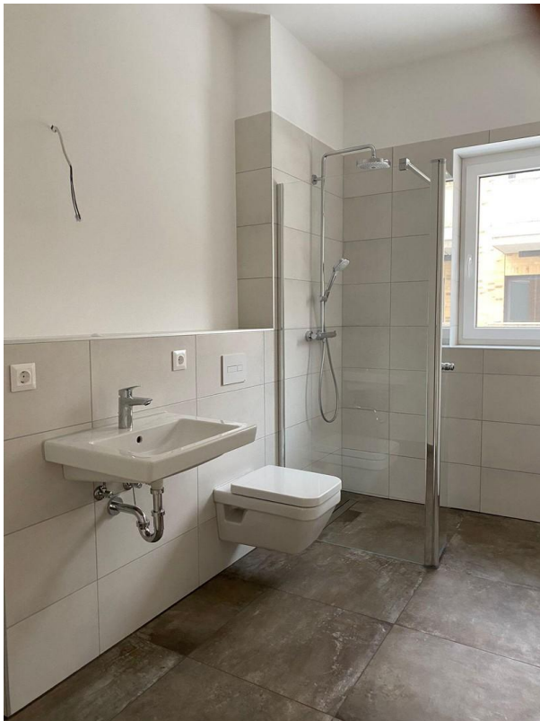
Badezimmer mit Walk-in Dusche