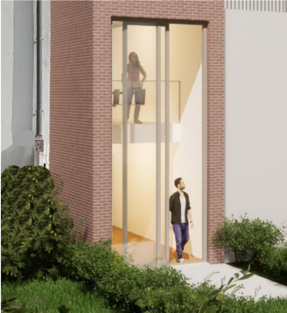
Galerie, Glasschiebetür, Garten