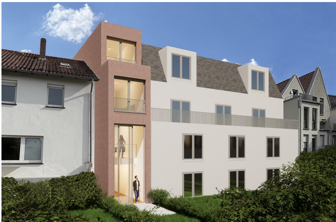
Gartenans. Umgeb. Visualisier.