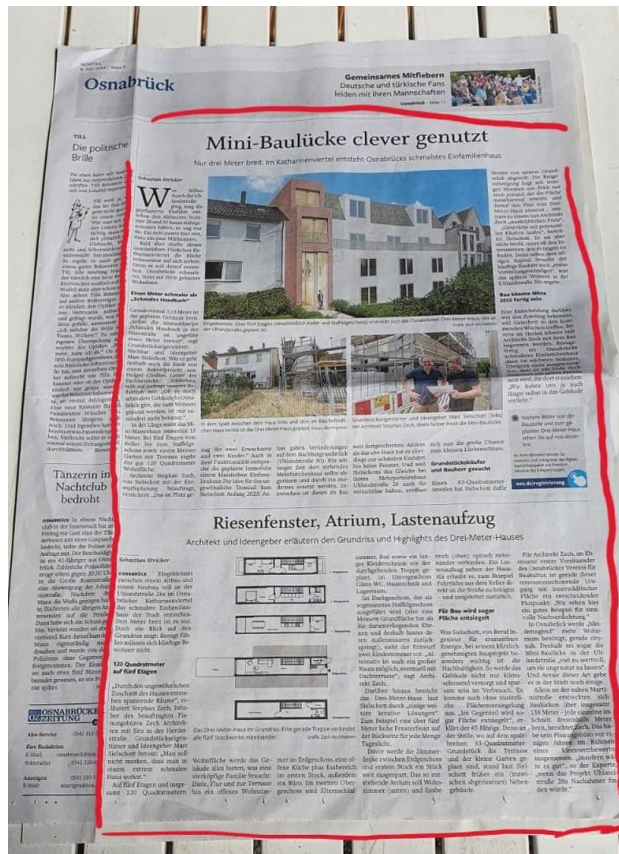
NOZ Artikel zum Einfamilienh.