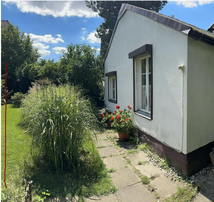
Gartenlaube mit mögl. Grenze