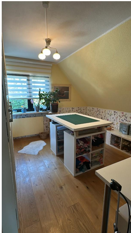
Mögl. Kinderzimmer 1