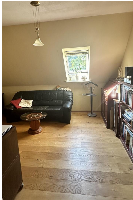
Mögl. Kinderzimmer 2