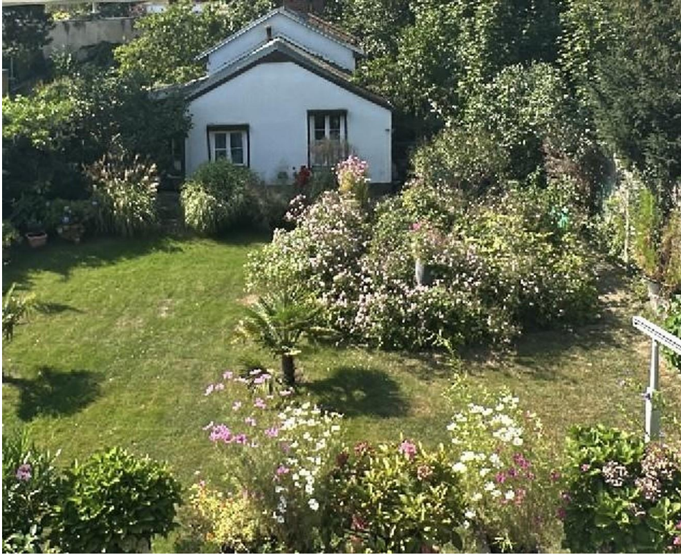
Aus dem Schlafzimmerfenster