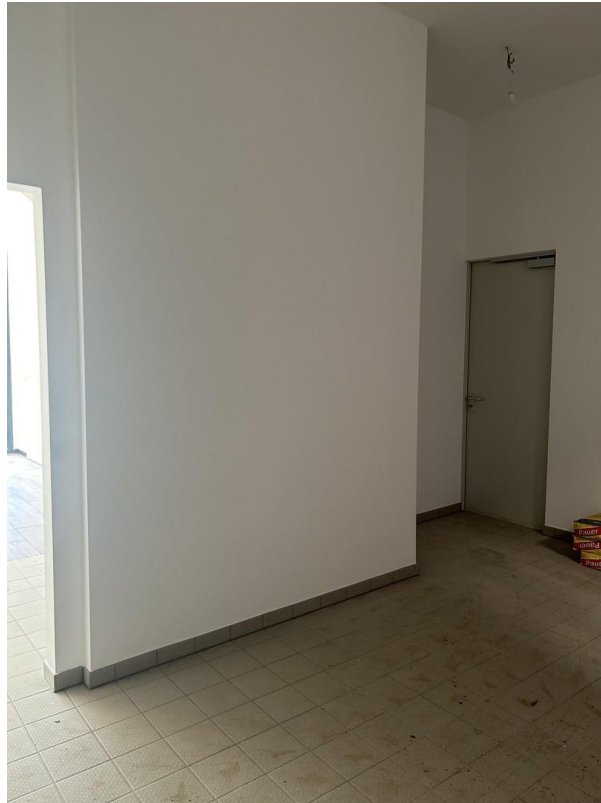
Raum 2 zum Innenhof gelegen