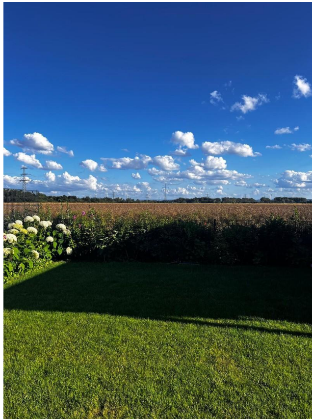
Gartensicht ins freie Feld