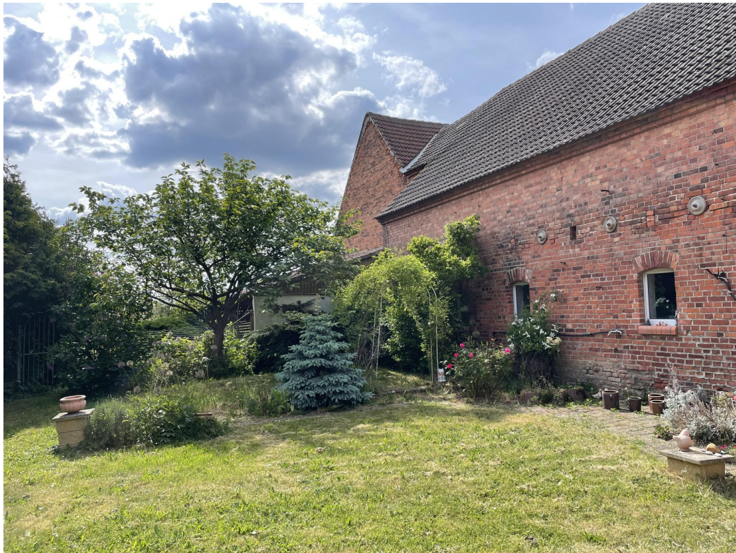
Ansicht auf kleinen Garten