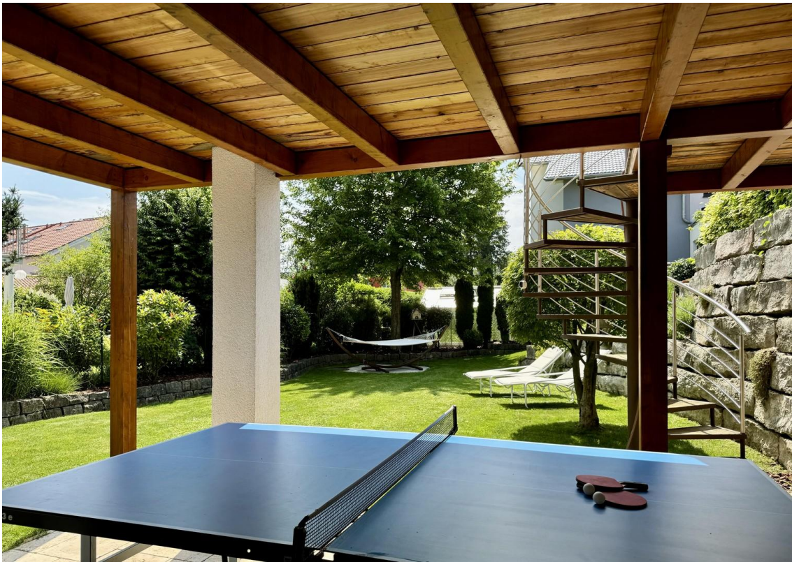
Terrasse im UG