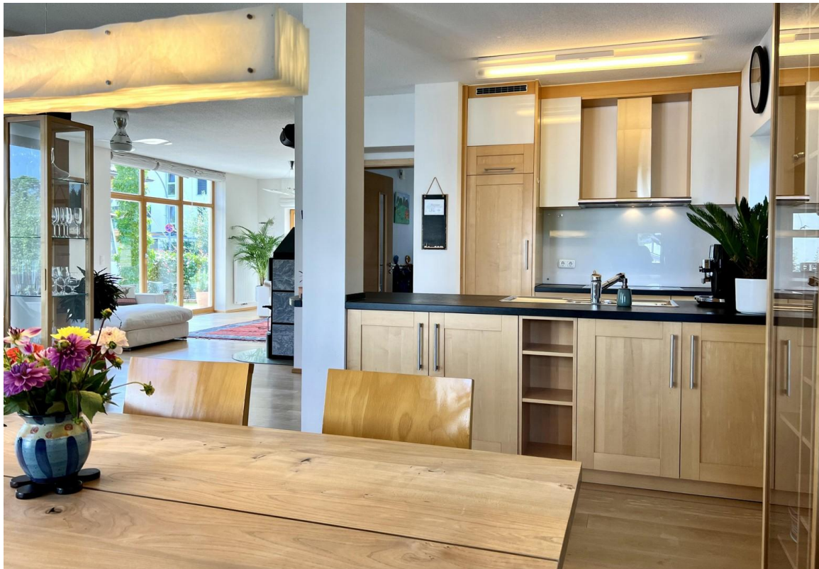
Küche mit offenem Esszimmer