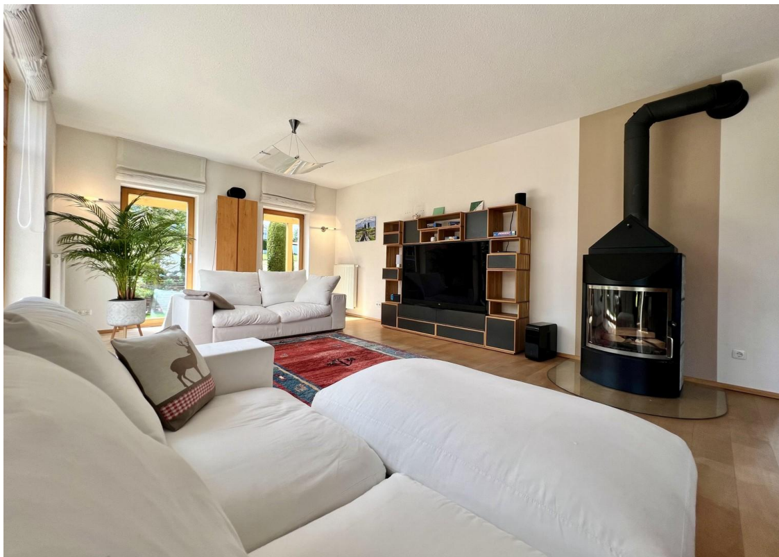
Wohnzimmer mit Kaminofen