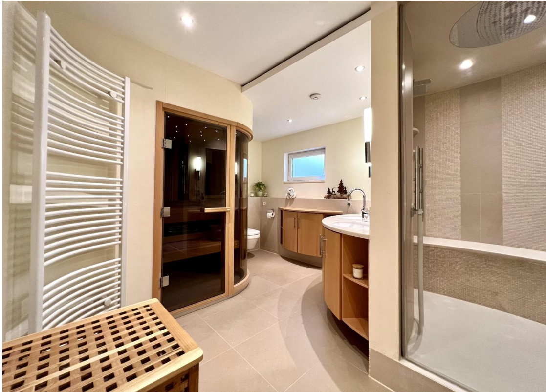
Regenfalldusche mit Dampfbad