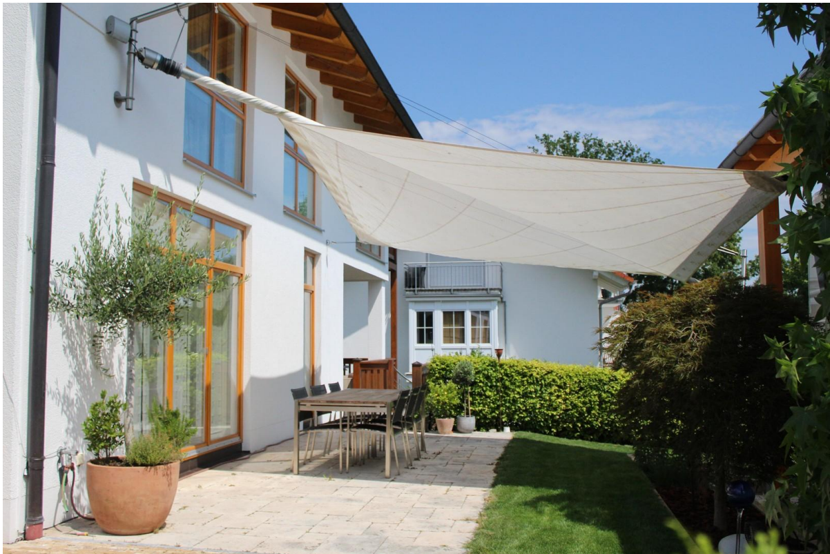
Südterrasse mit Sonnensegel