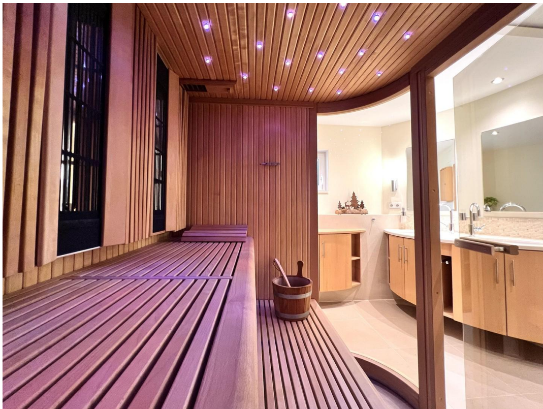
Sauna mit Infrarotstrahlern