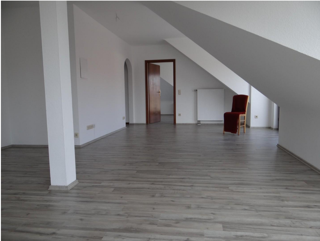
Wohn- & Essbereich