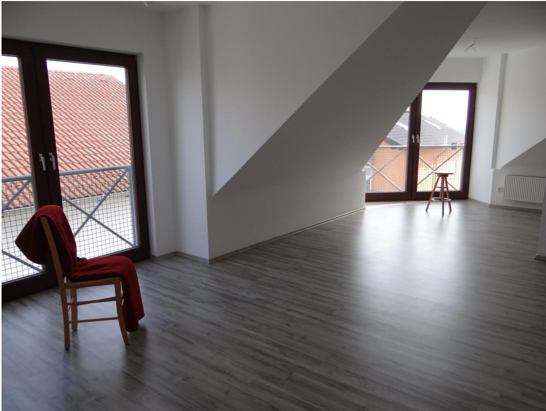
Wohn- & Essbereich