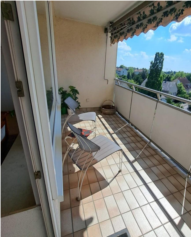
Balkon m. schönem Ausblick