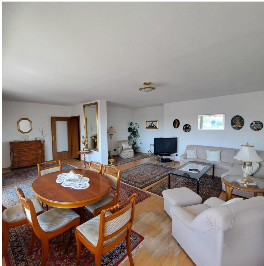
Wohnzimmer Bild 2