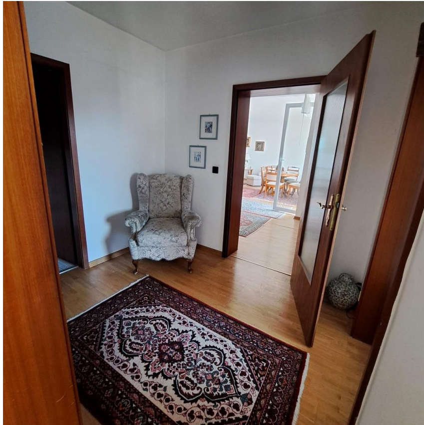
Diele zu den Schlafräumen