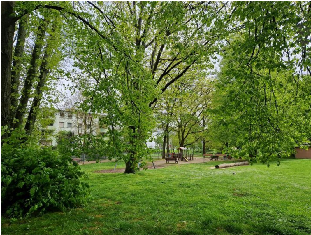
Park Bild 2