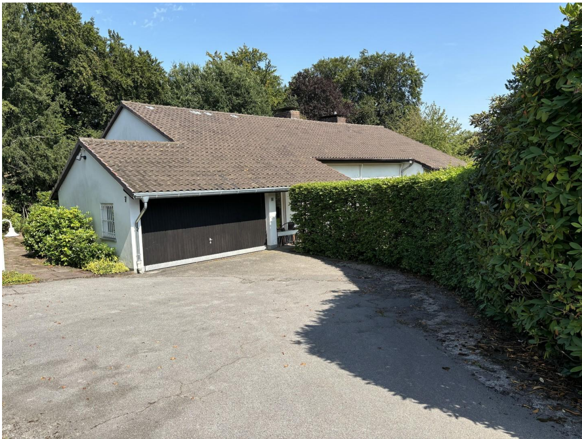
Haus vorne Garage