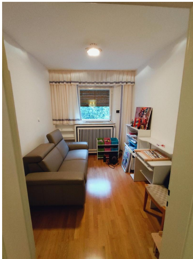
kleines Zimmer (Büro)