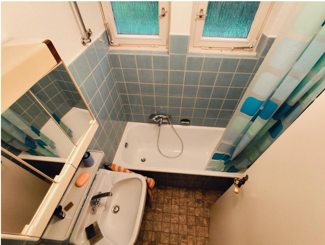
Badezimmer ohne Toilette