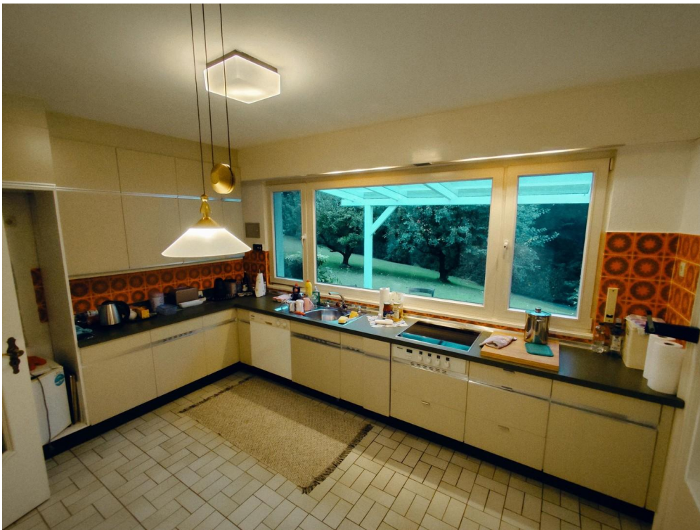
grosse Wohn Küche