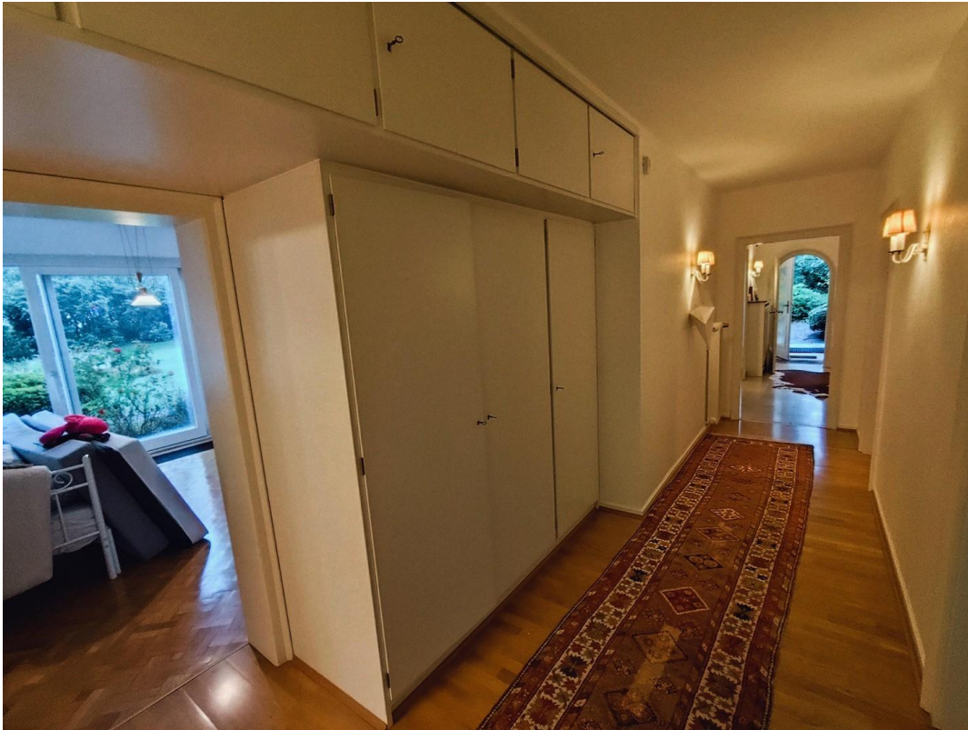
Flur Sicht zum Eingang