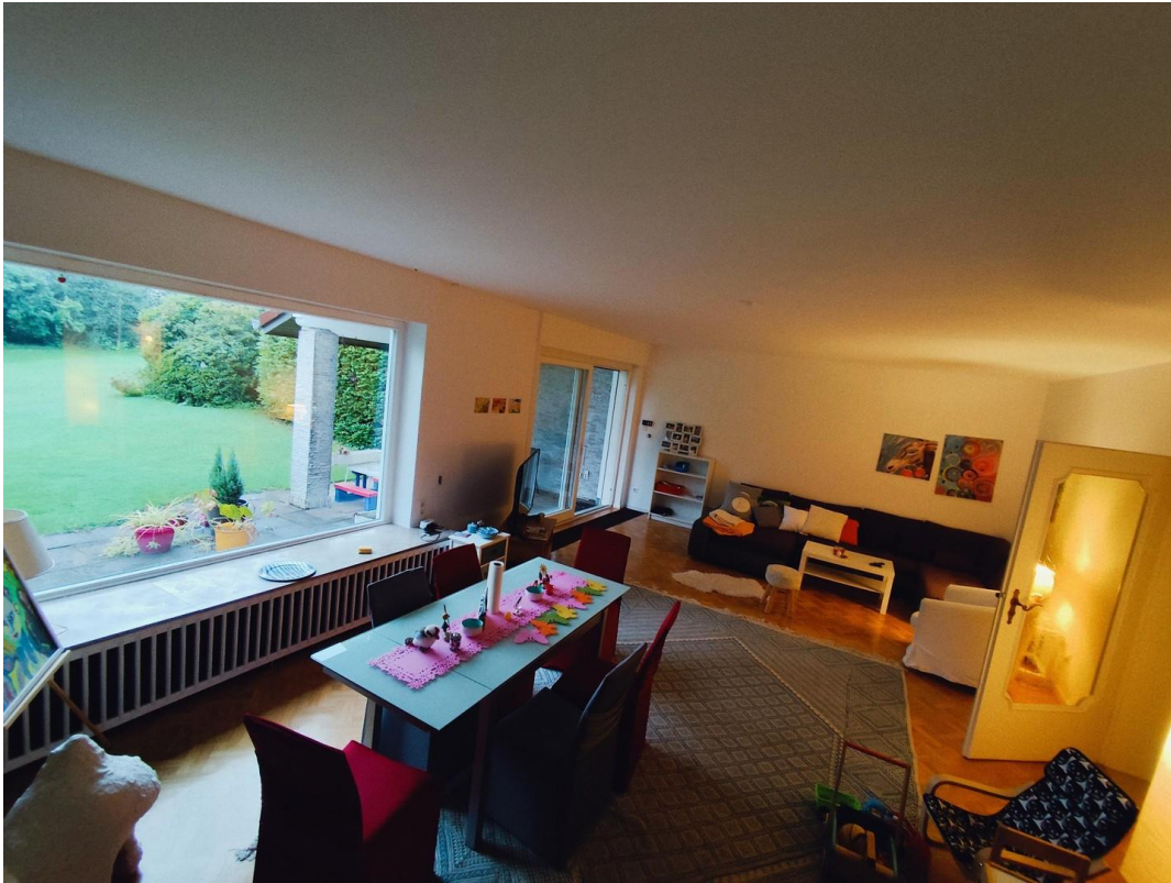
Wohnzimmer mit Kamin