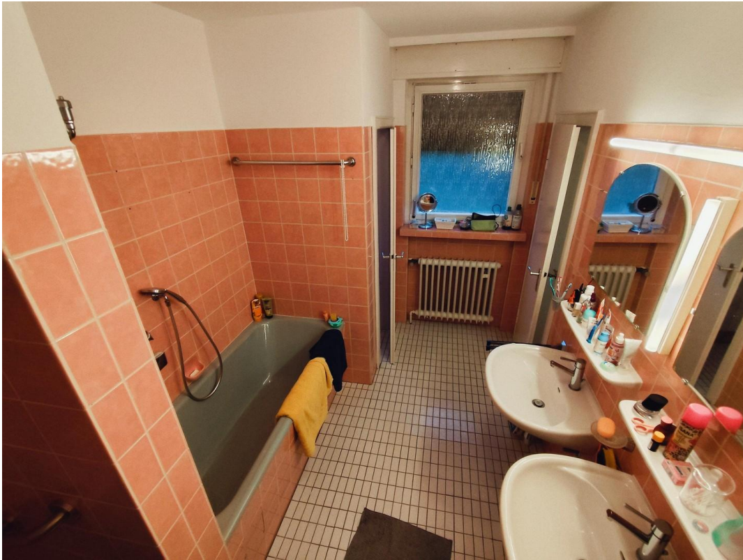
Badezimmer Dusche+Wanne (Elter