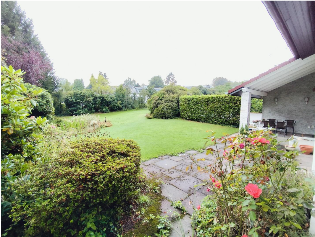
Garten vorne mit Terasse