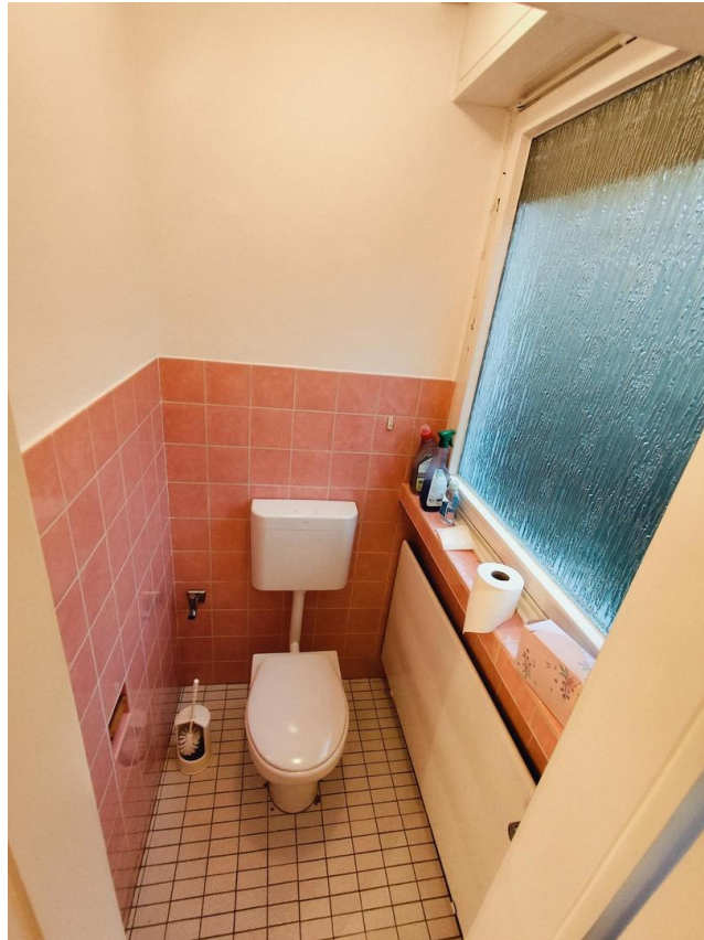
Toilette Badezimmer (Eltern)