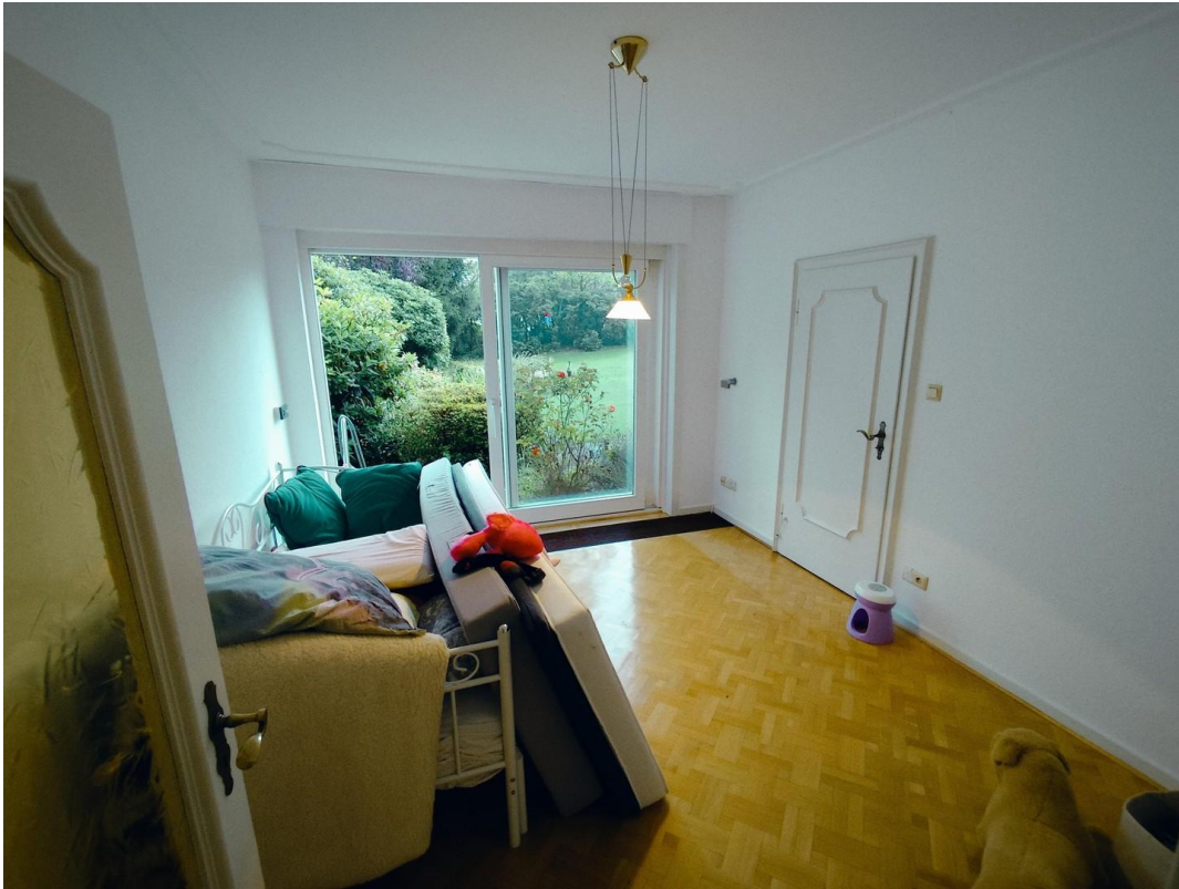
Ess-, Lese-, Bürozimmer