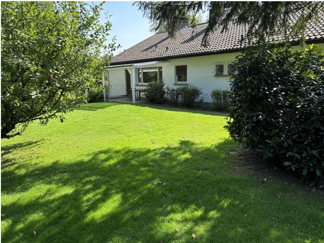
Haus hinten mit Garten + Wald