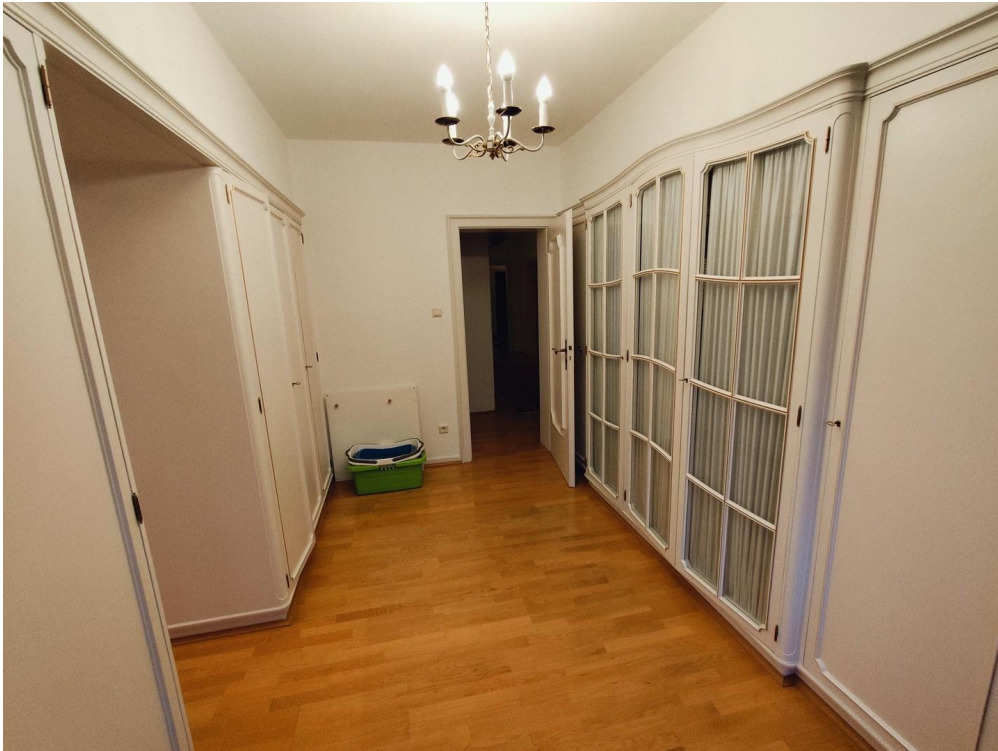
Ankleideraum Richtung Flur