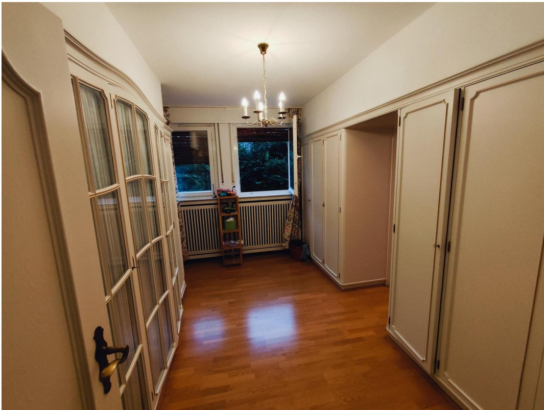
Ankleidraum Richtung Bad