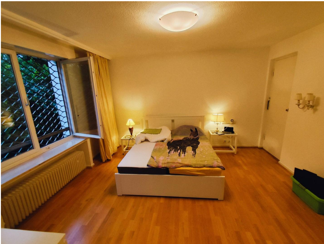
( Eltern )Schlafzimmer