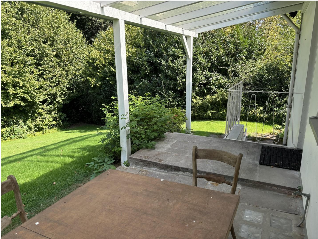
Terrasse hinten zum Wald