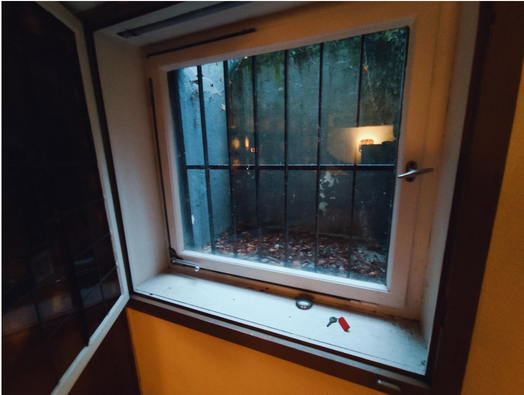
ein Fenster im Keller