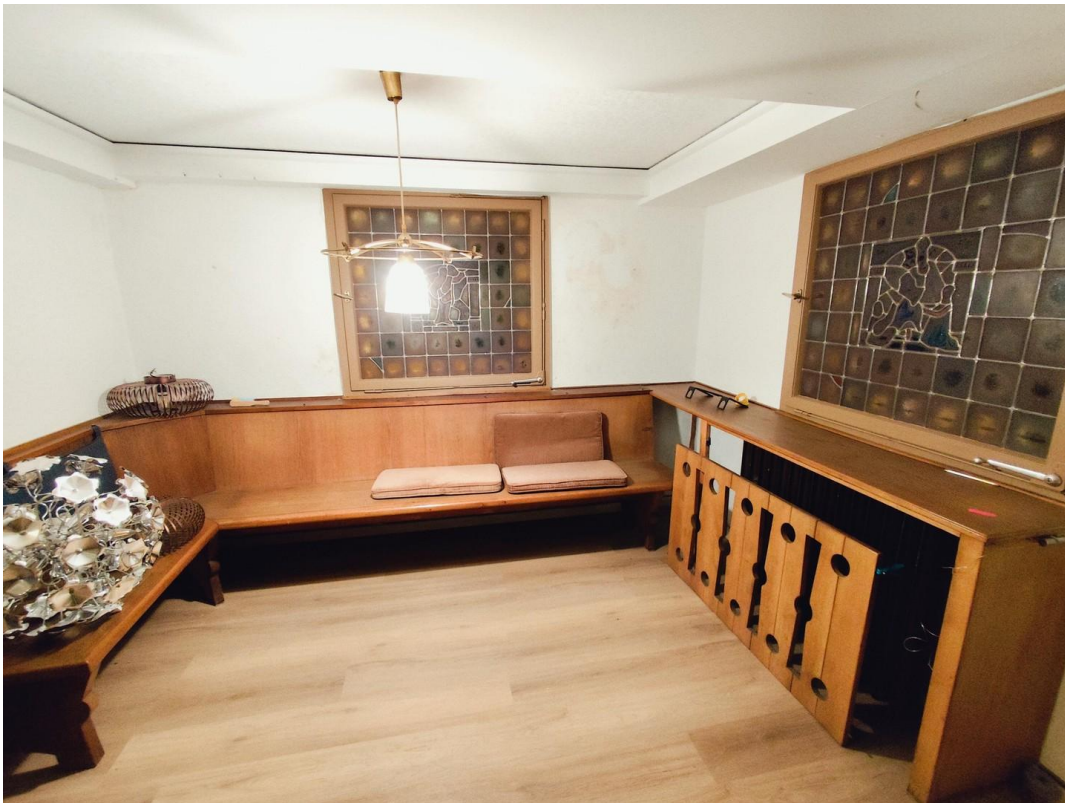
Keller (Partyraum etc)