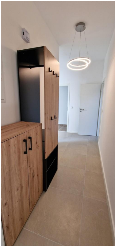
Garderobe und Eingang