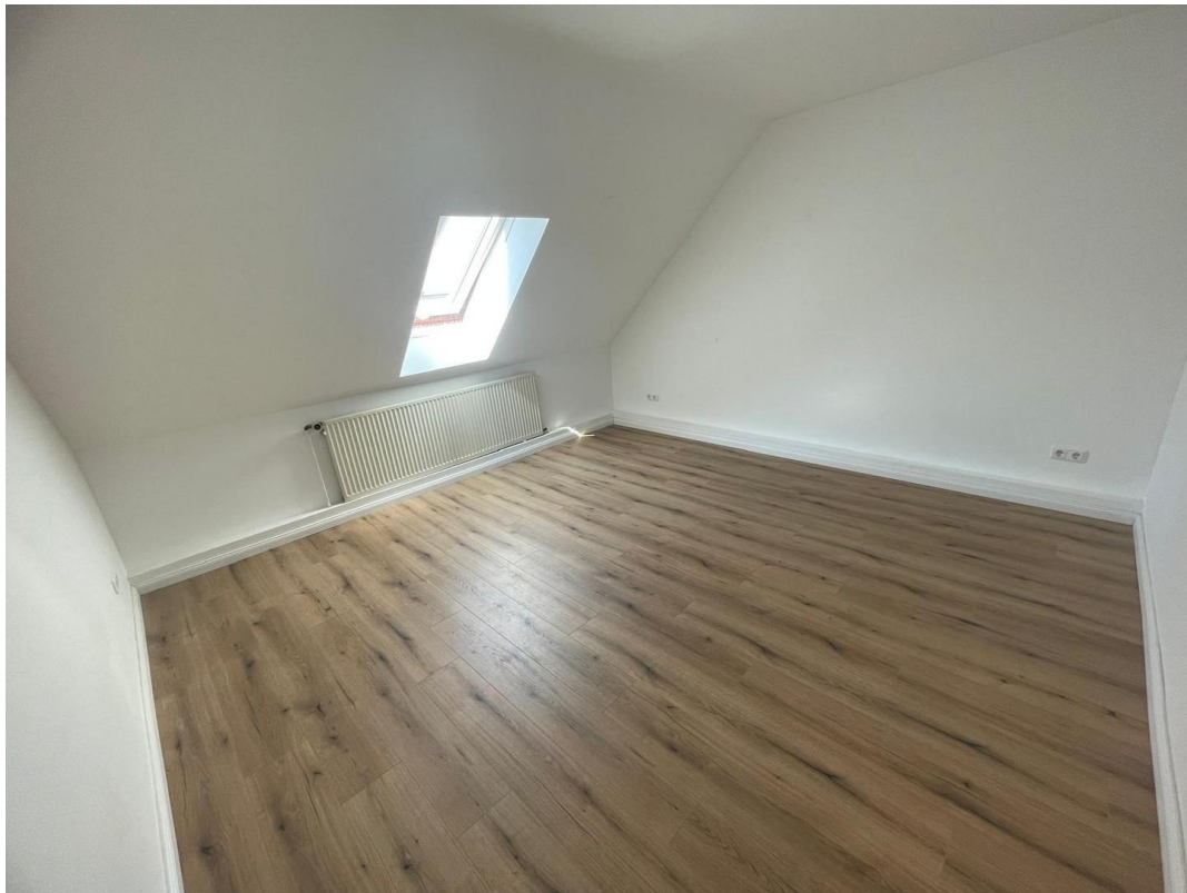
OG Schlafzimmer 1