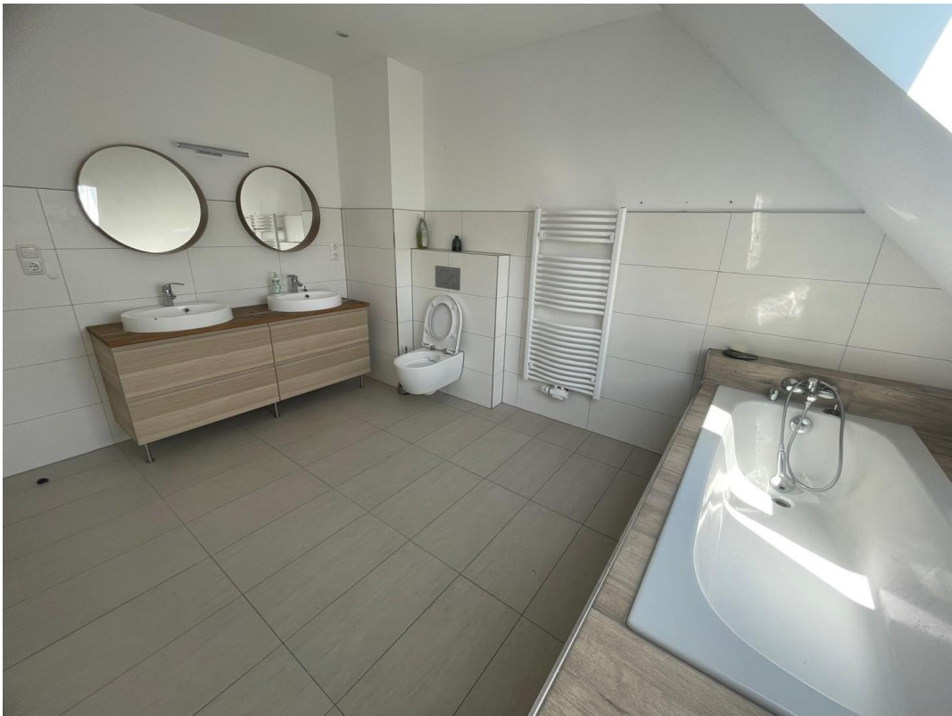
OG Badezimmer 2