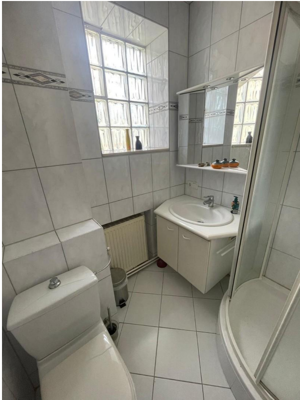
EG Badezimmer/Guest WC