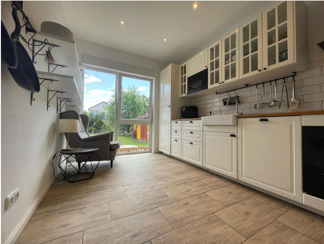
Offener Küche 1