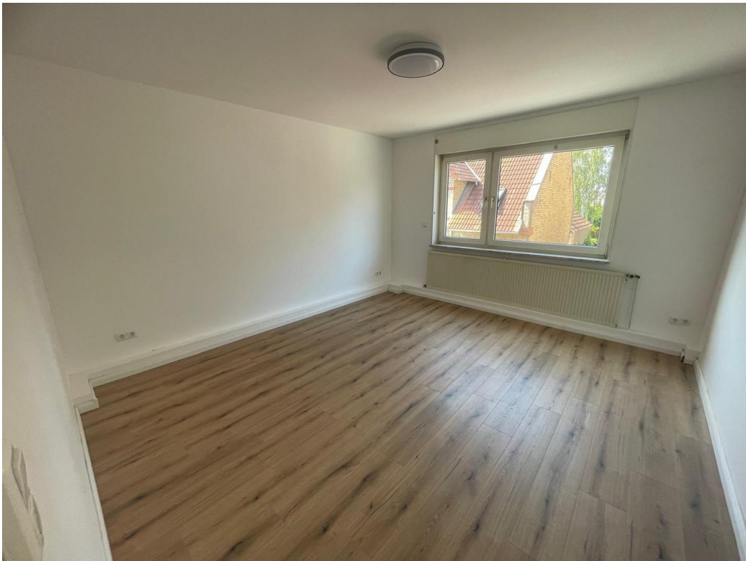
OG Schlafzimmer 3