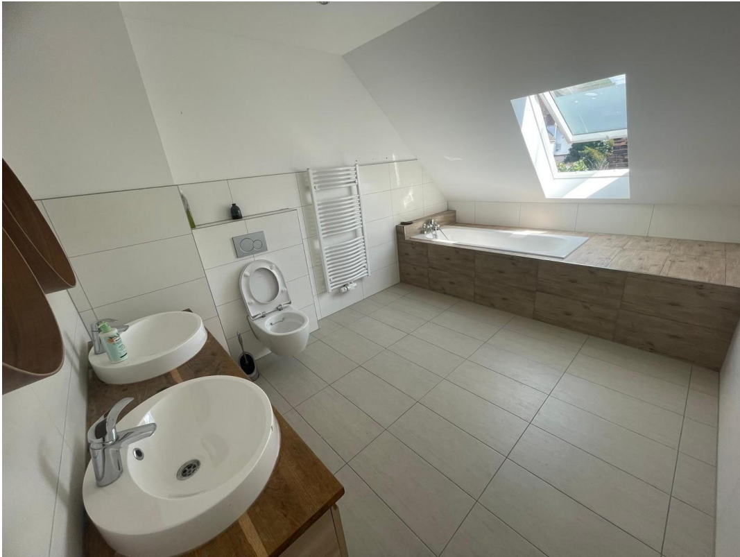
OG Badezimmer 1