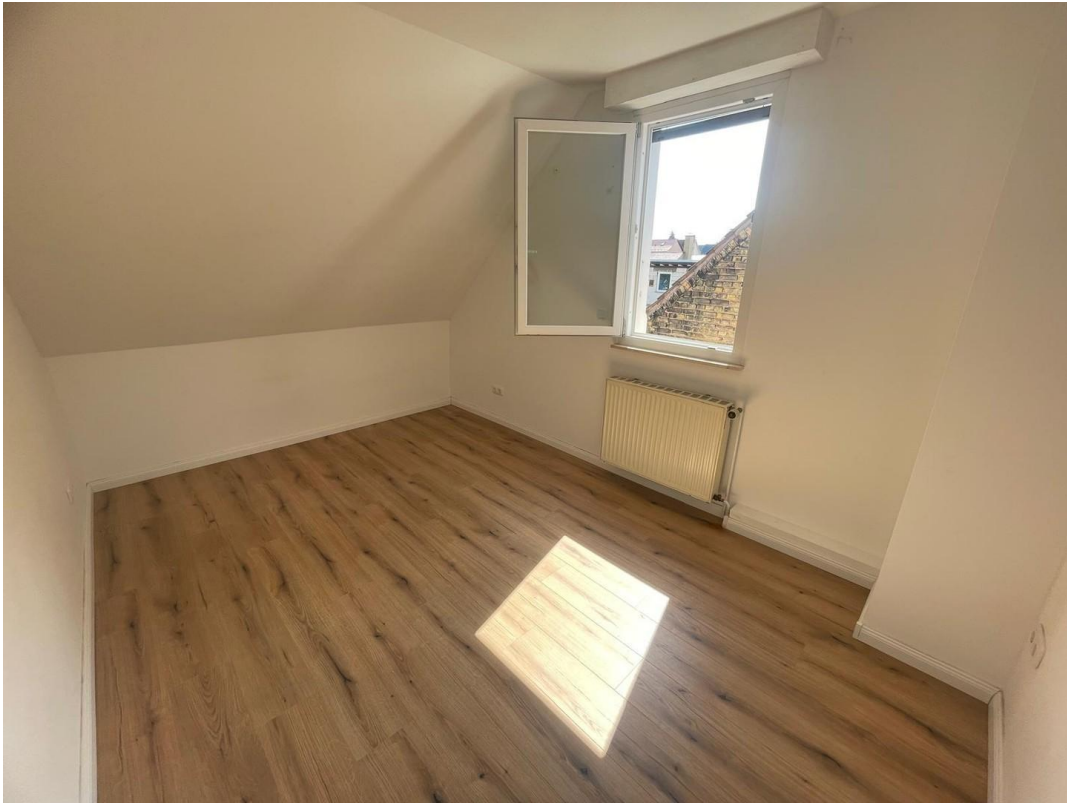
OG Schlafzimmer 2