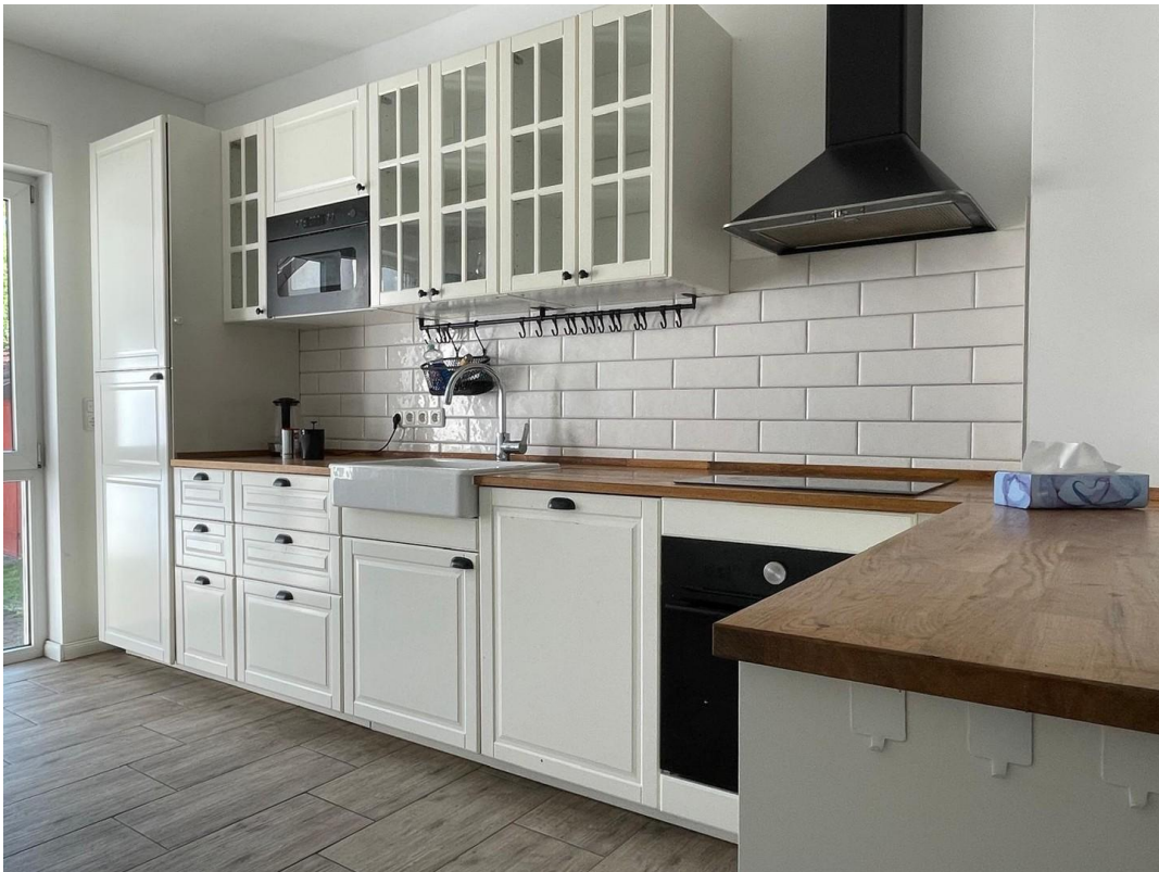
Offener Küche 2