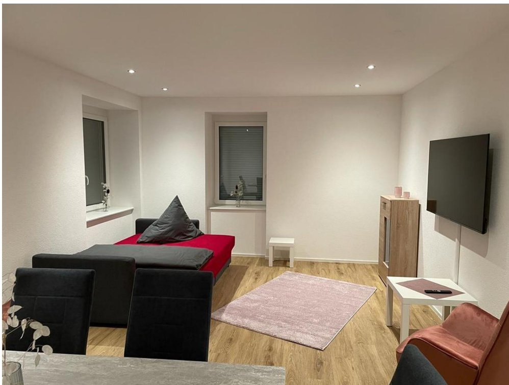
Schlafmöglichkeiten in WZ.