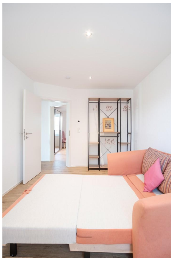
Schlafmöglichkeit in KZ.