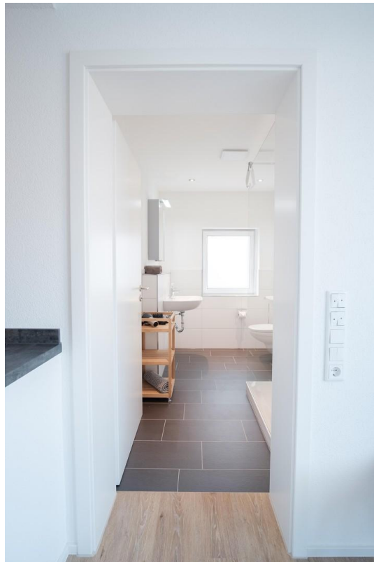
Eingang in Sanitärbereich