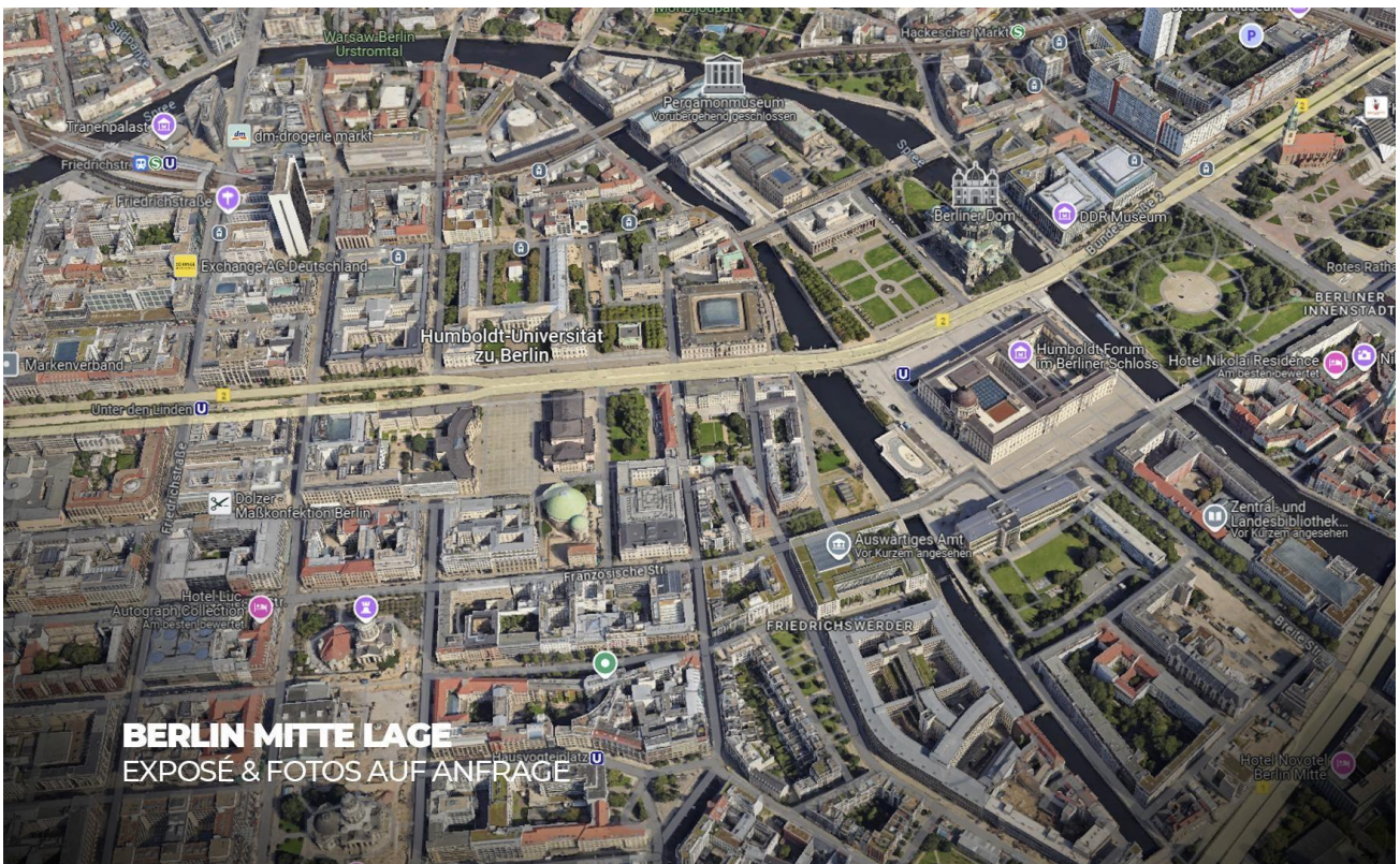
Lage Berlin Mitte