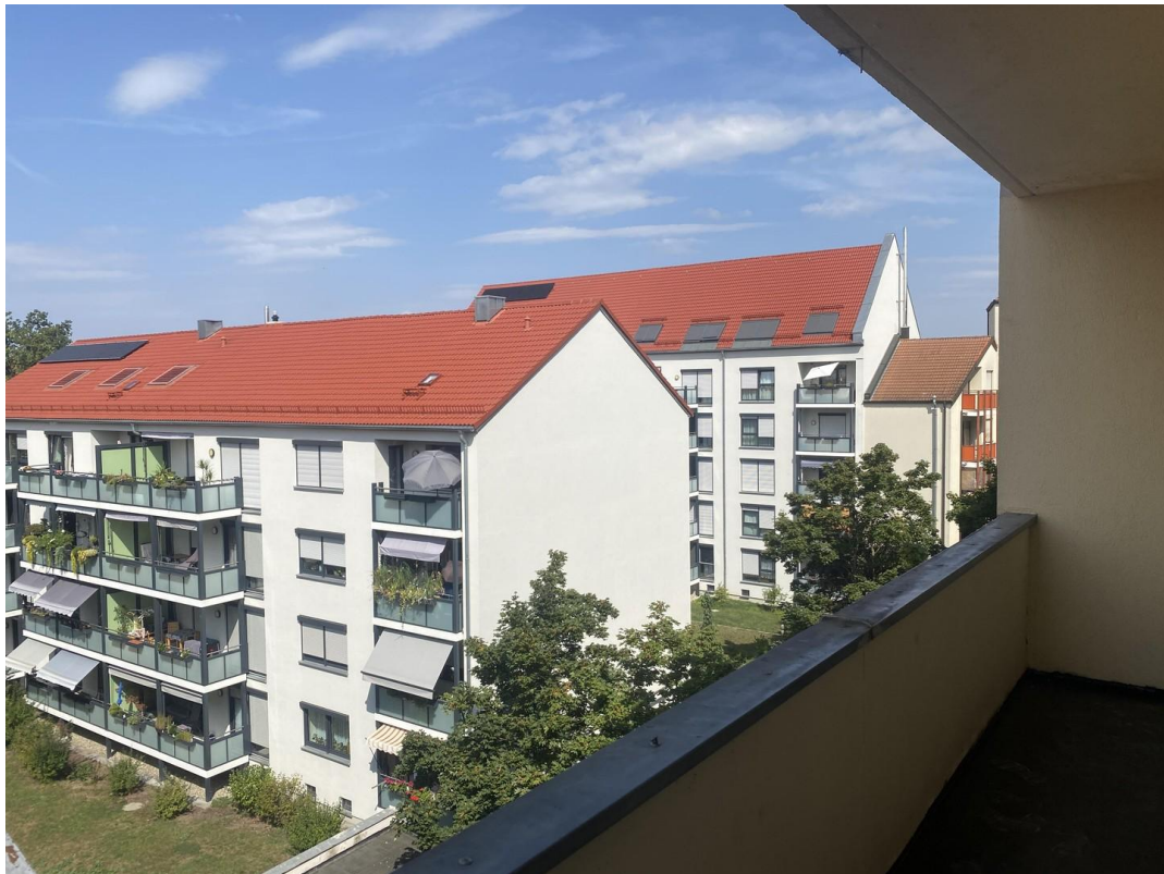
Balkon mit Aussicht