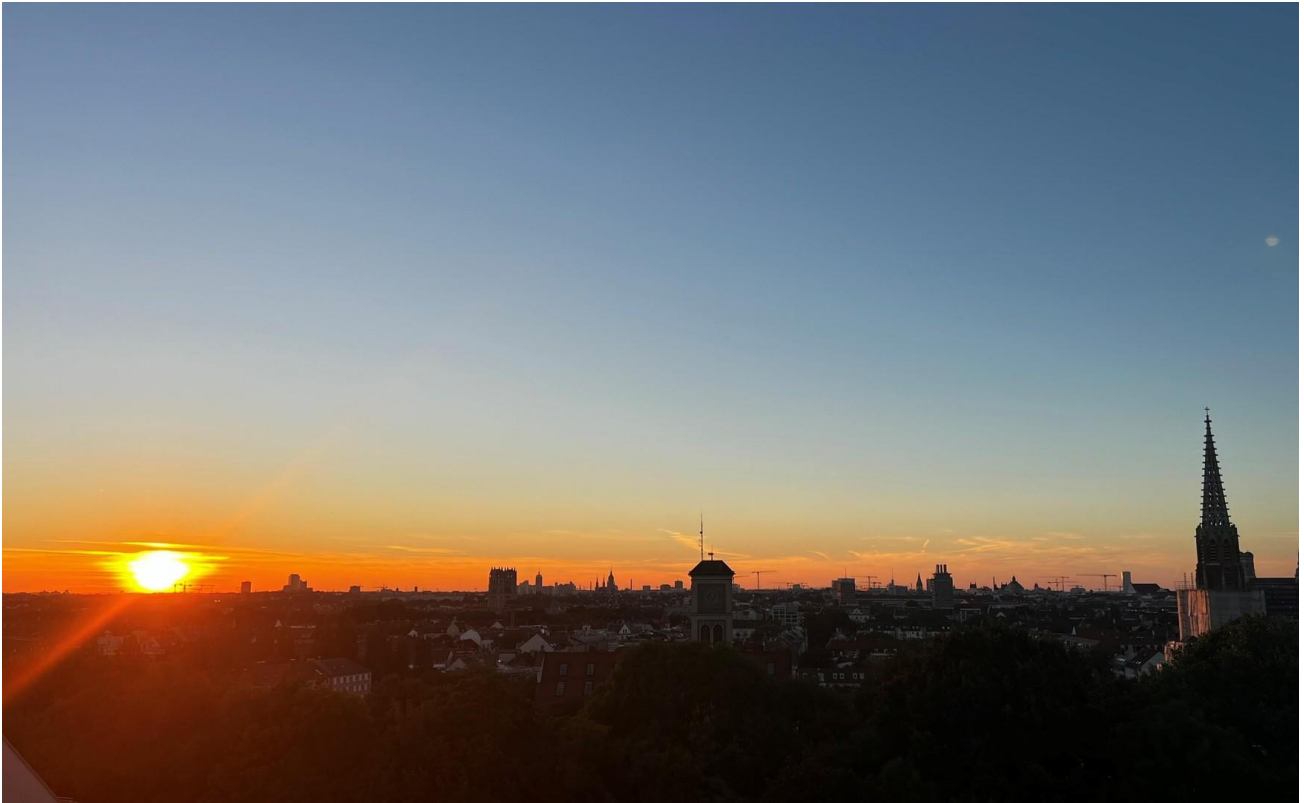
Aussicht Dachterrasse Nacht