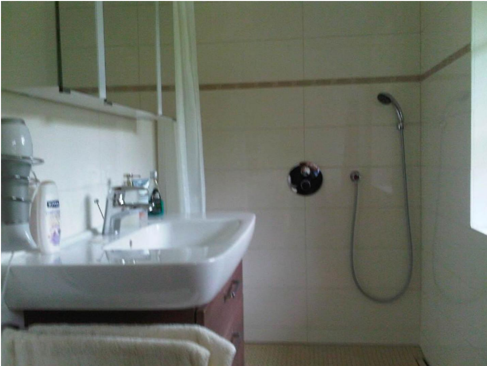
Waschtisch im Duschbad