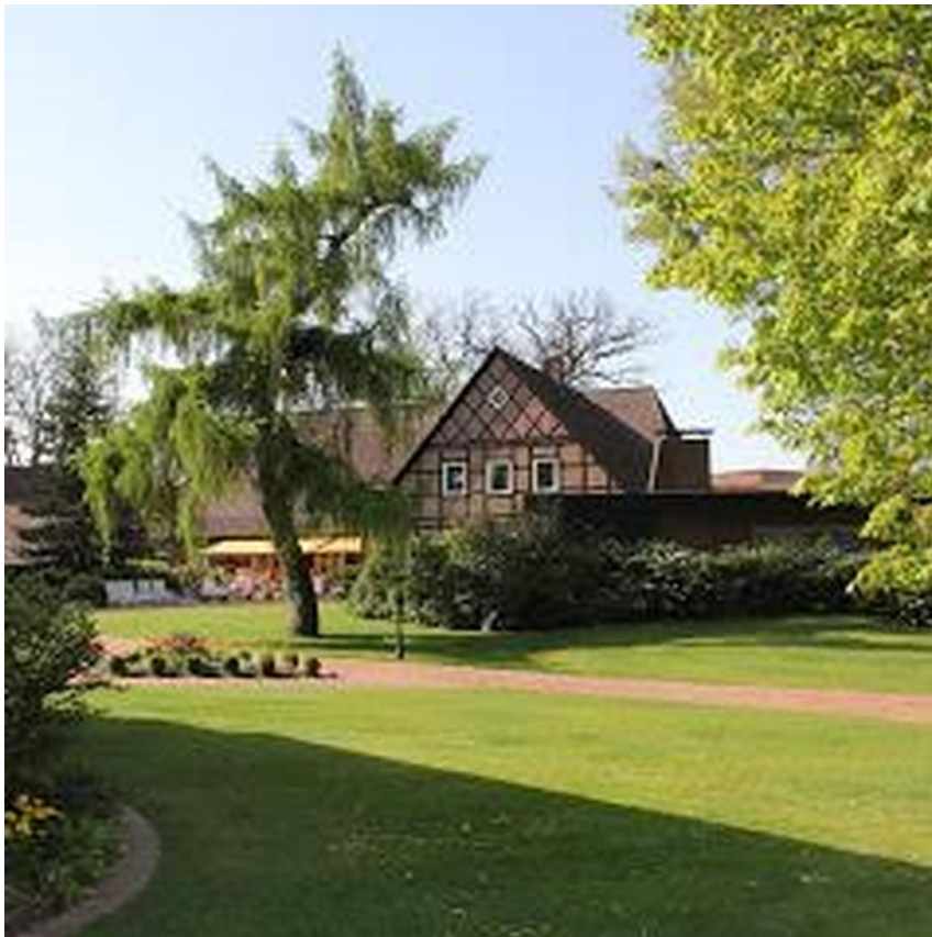
Blick in den Park