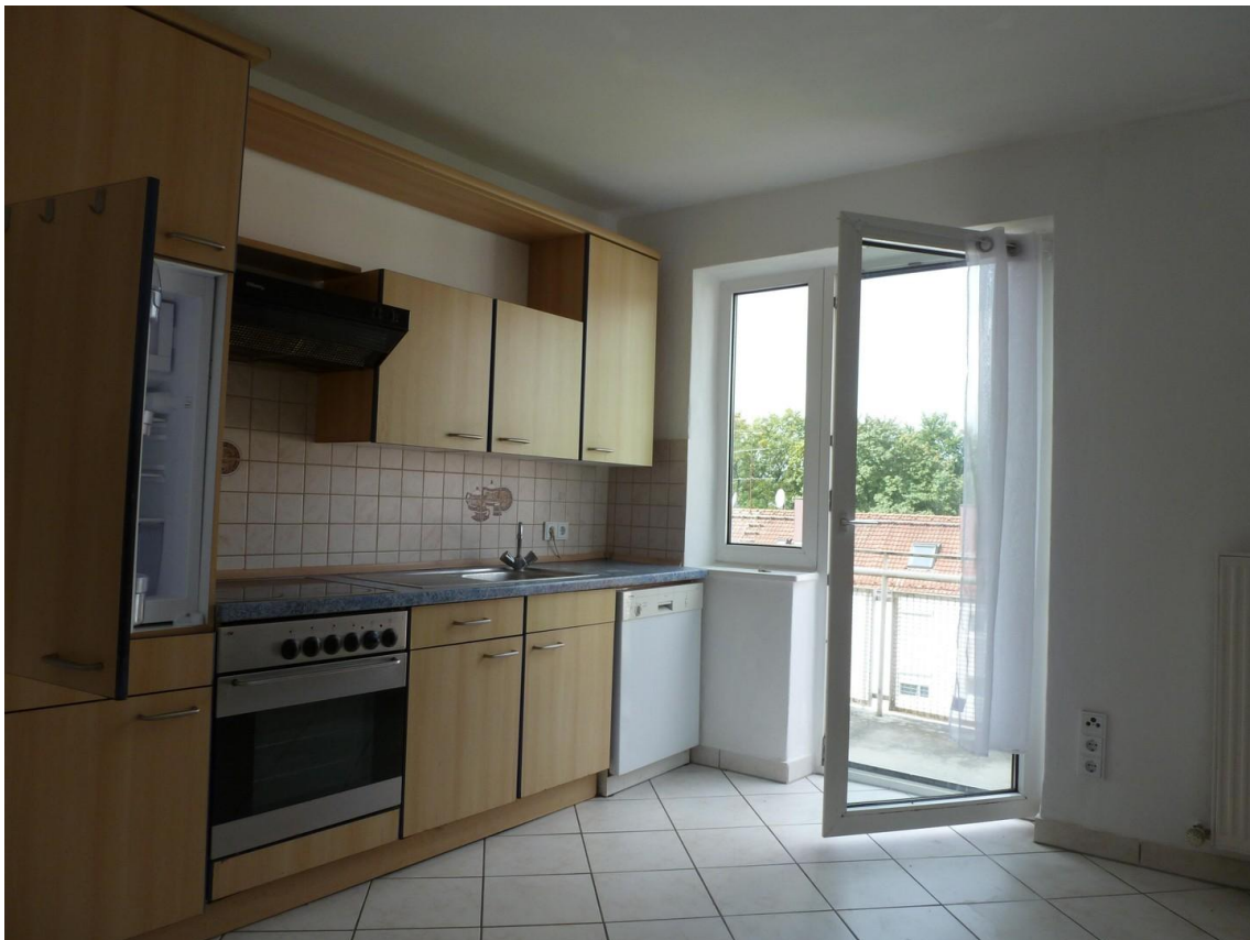
Küche mit Austritt zum Balkon