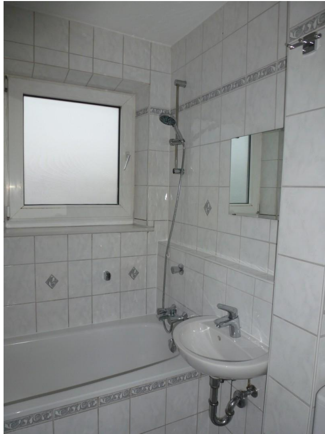
Bad mit Fenster