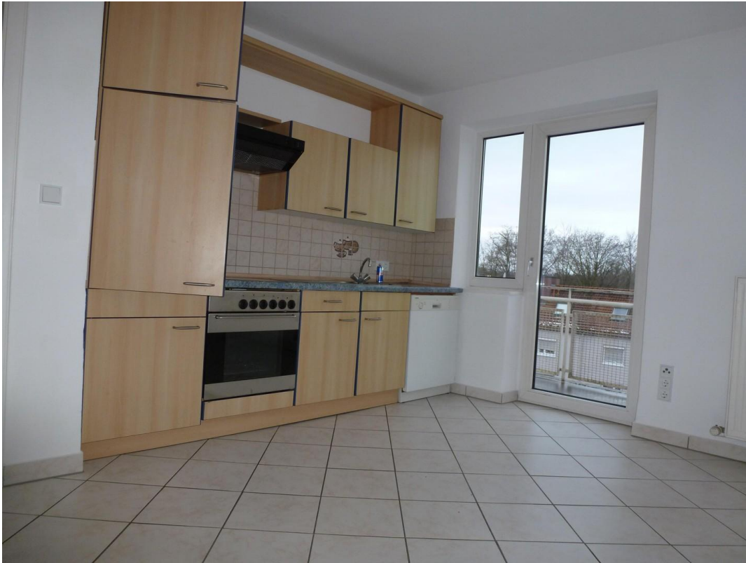
Küche mit Austritt zum Balkon