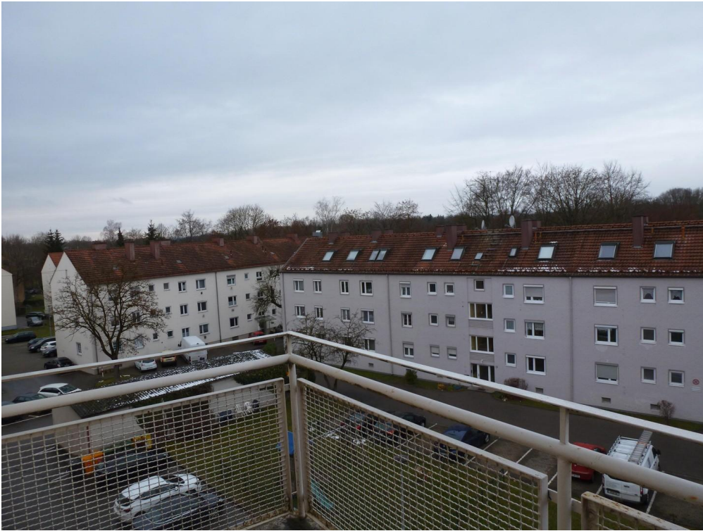
Blick vom Balkon (westwärts)