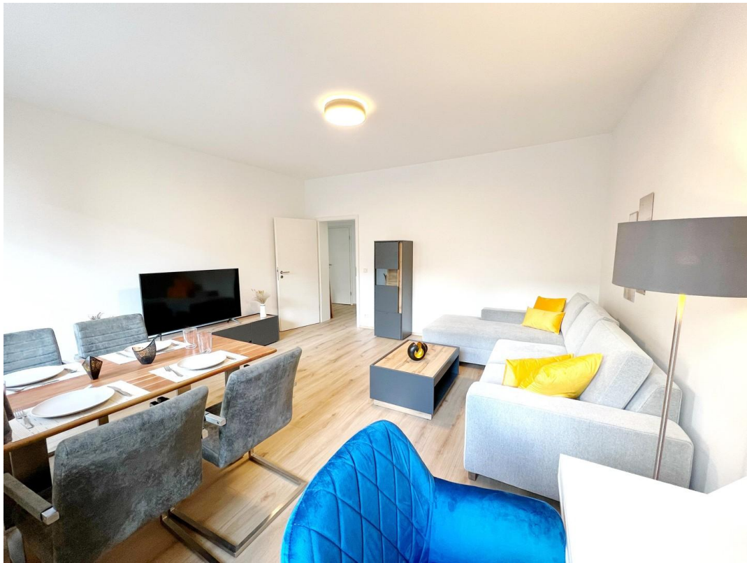
Wohnzimmer mit Essbereich