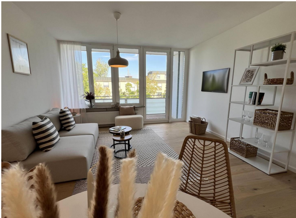
Wohnen und Balkon