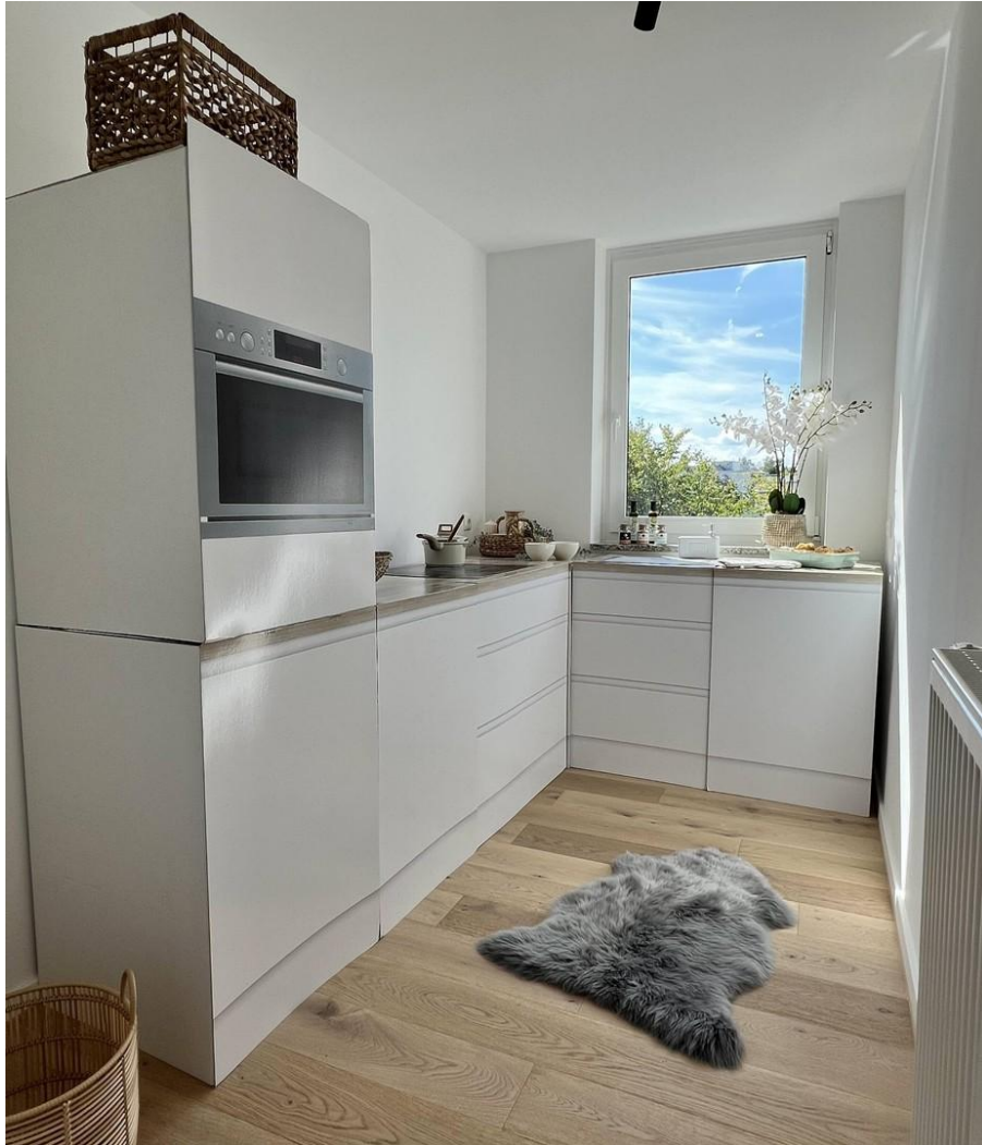
Küche mit Fenster