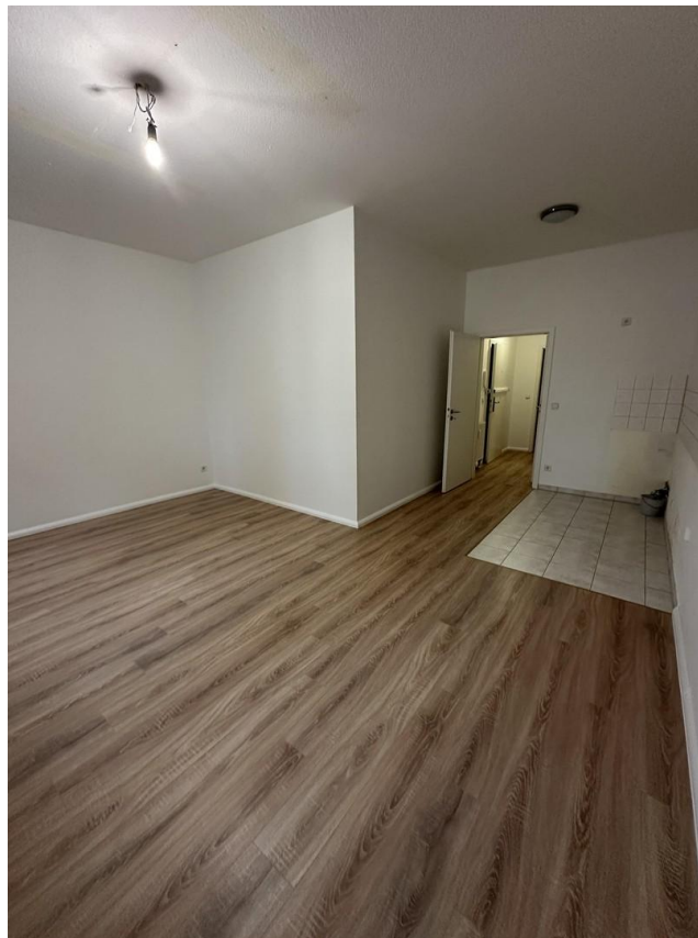
Bürobereich mit Küchennische