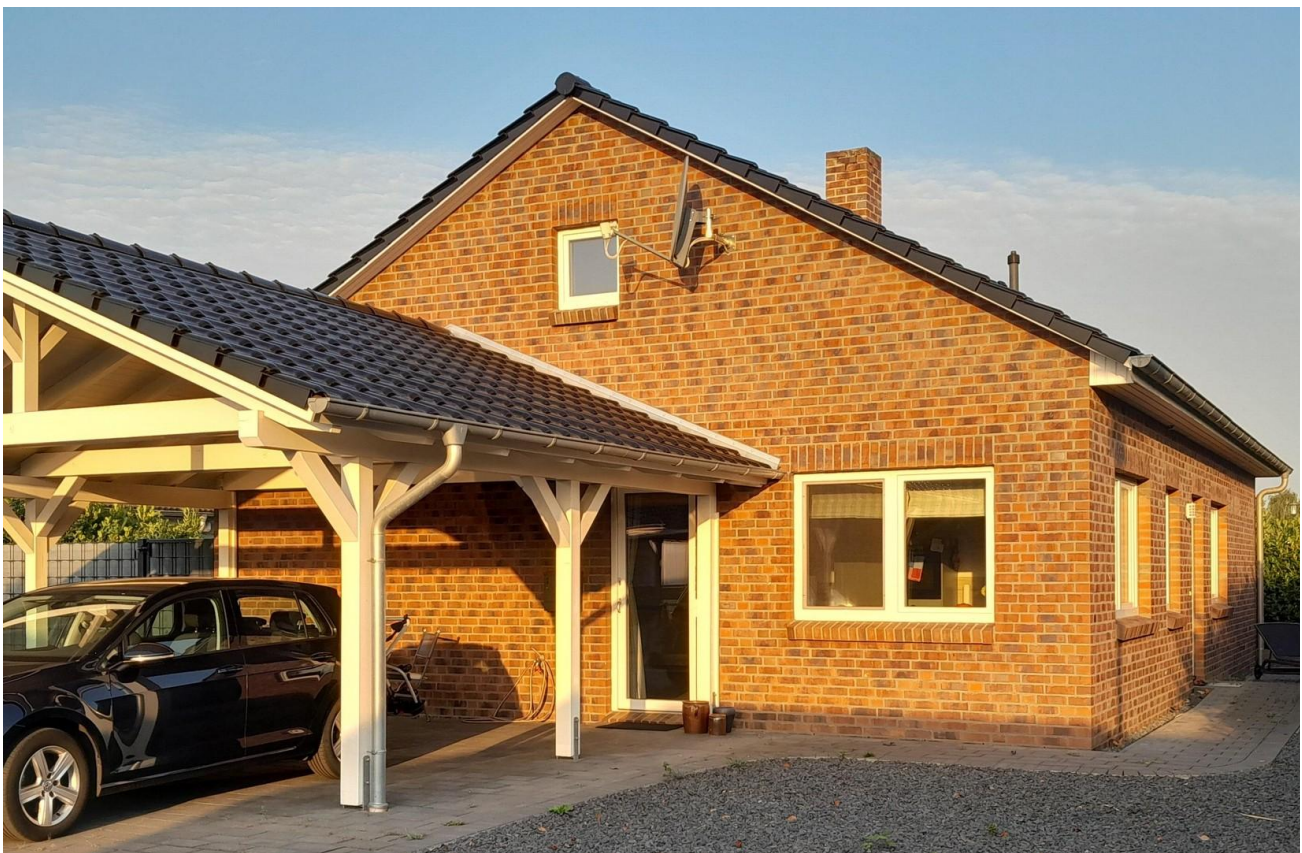
Blick von der Straße