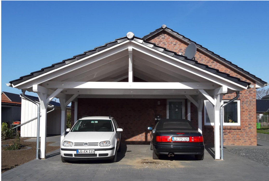
Blick von der Straße