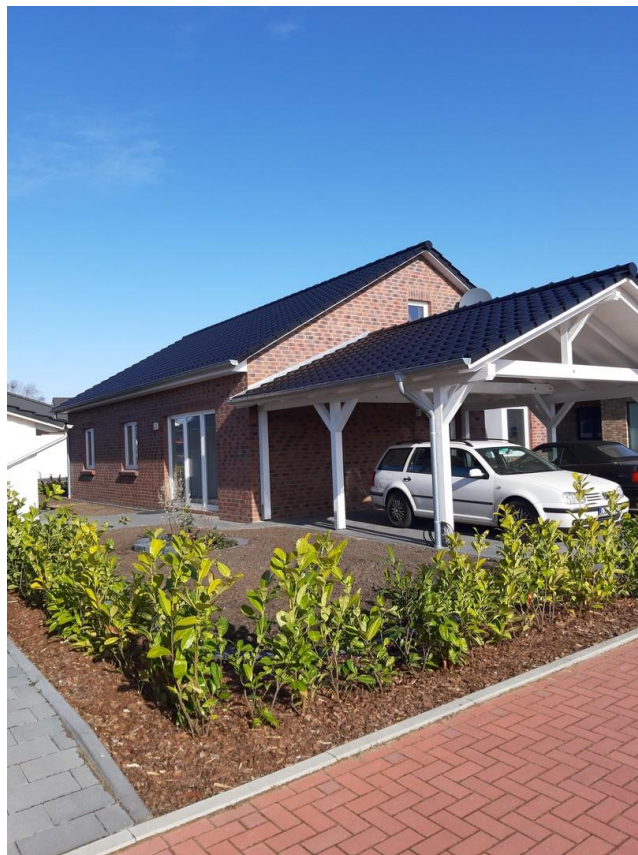
Blick von der Straße