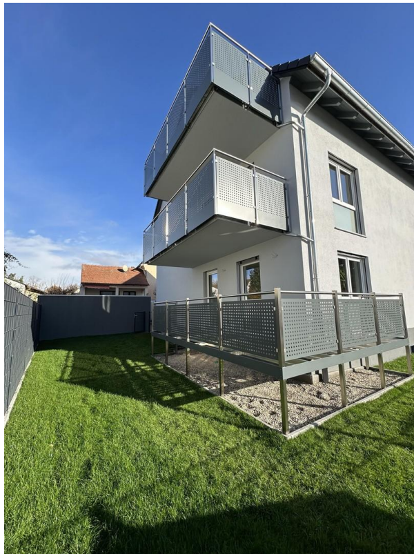
Garten + Terrasse