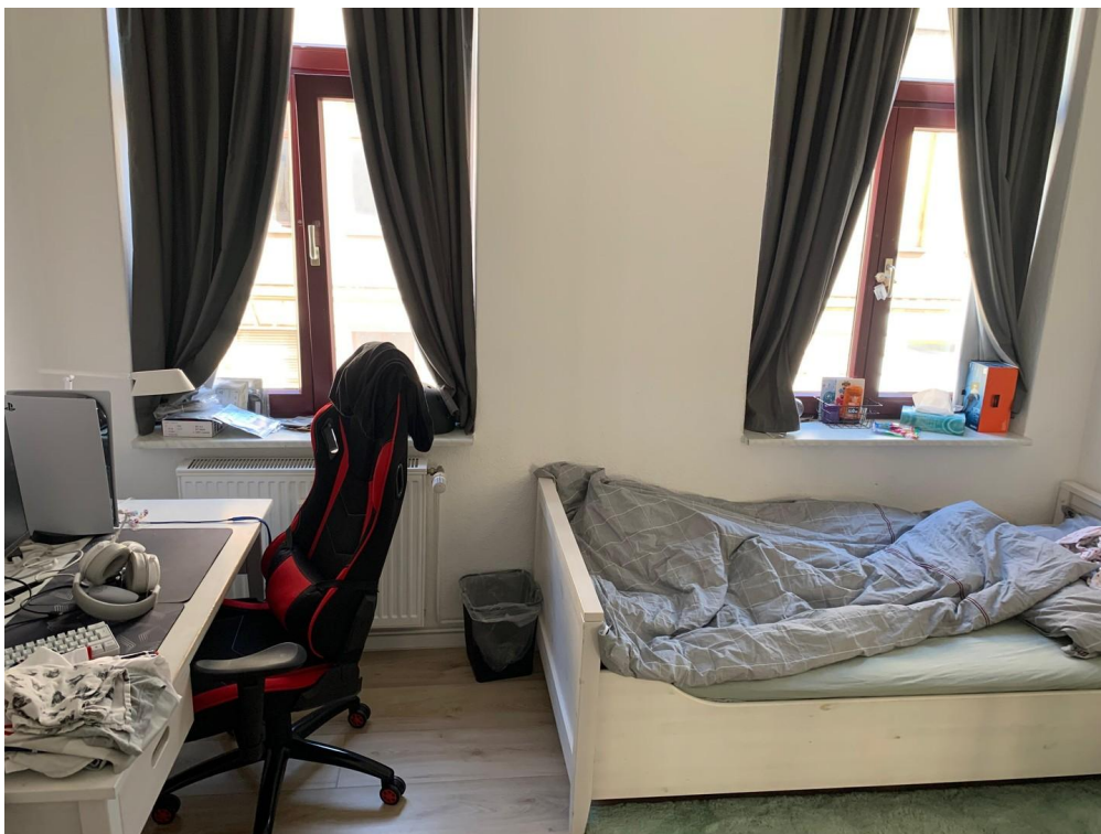
Ki oder AZ eingerichtet