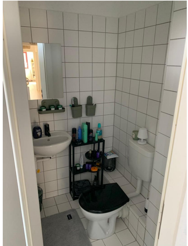
Gäste WC eingerichtet