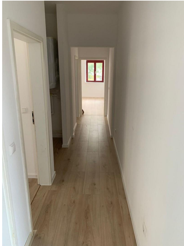
Flur Blick Richtung WZ