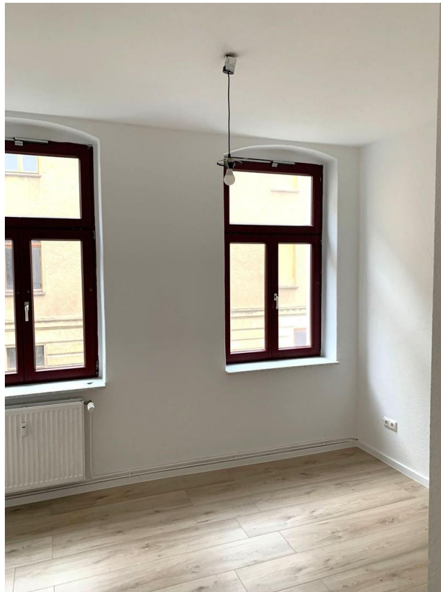
Kinder- oder Arbeitszimmer