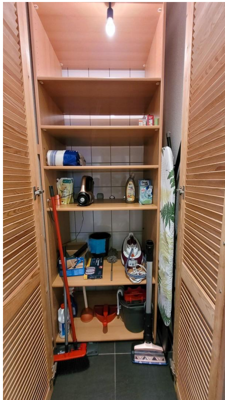
Einbauschränk mit Zubehör