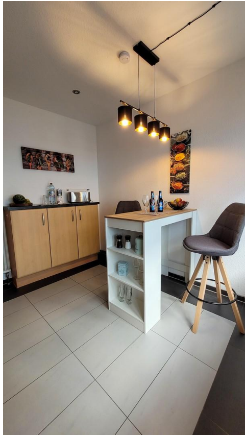
Bartisch und Anrichte