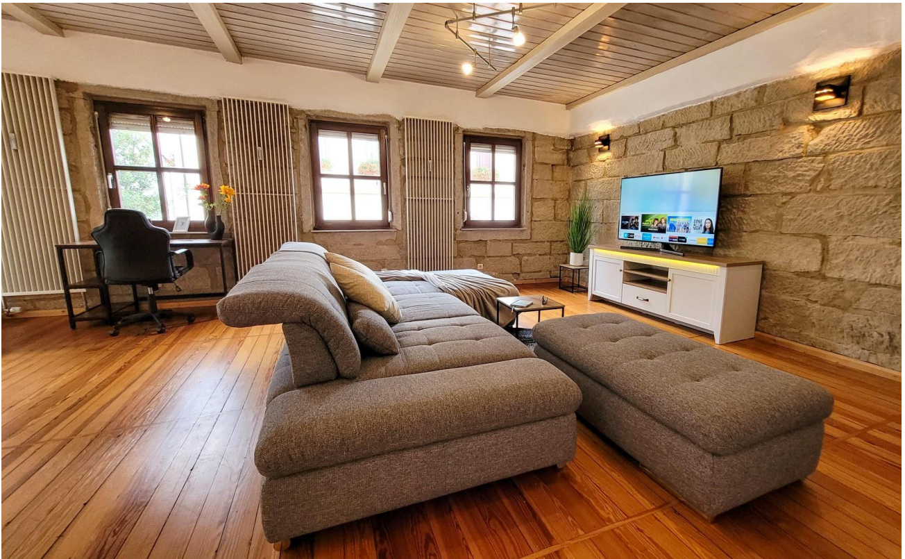
Wohnzimmer mit Arbeitsplatz