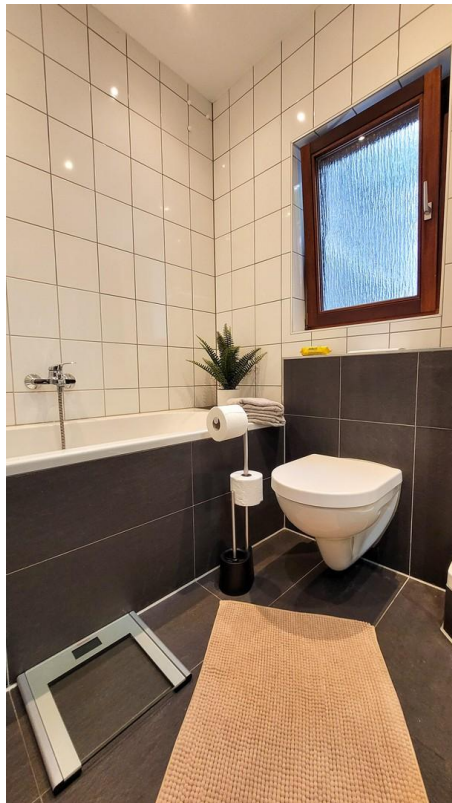
WC und Badewanne