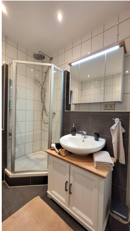
Waschtisch und Dusche