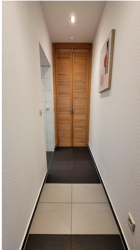
Flur zum Bad