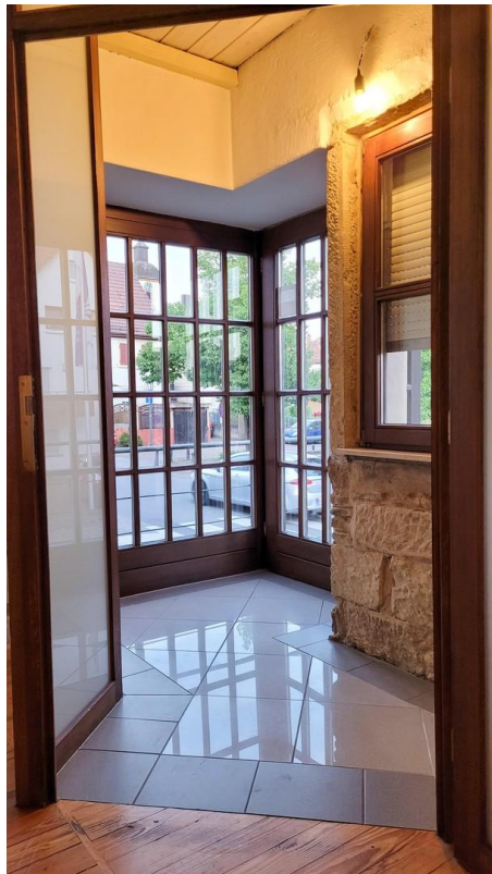
Windfang und zweiter Eingang