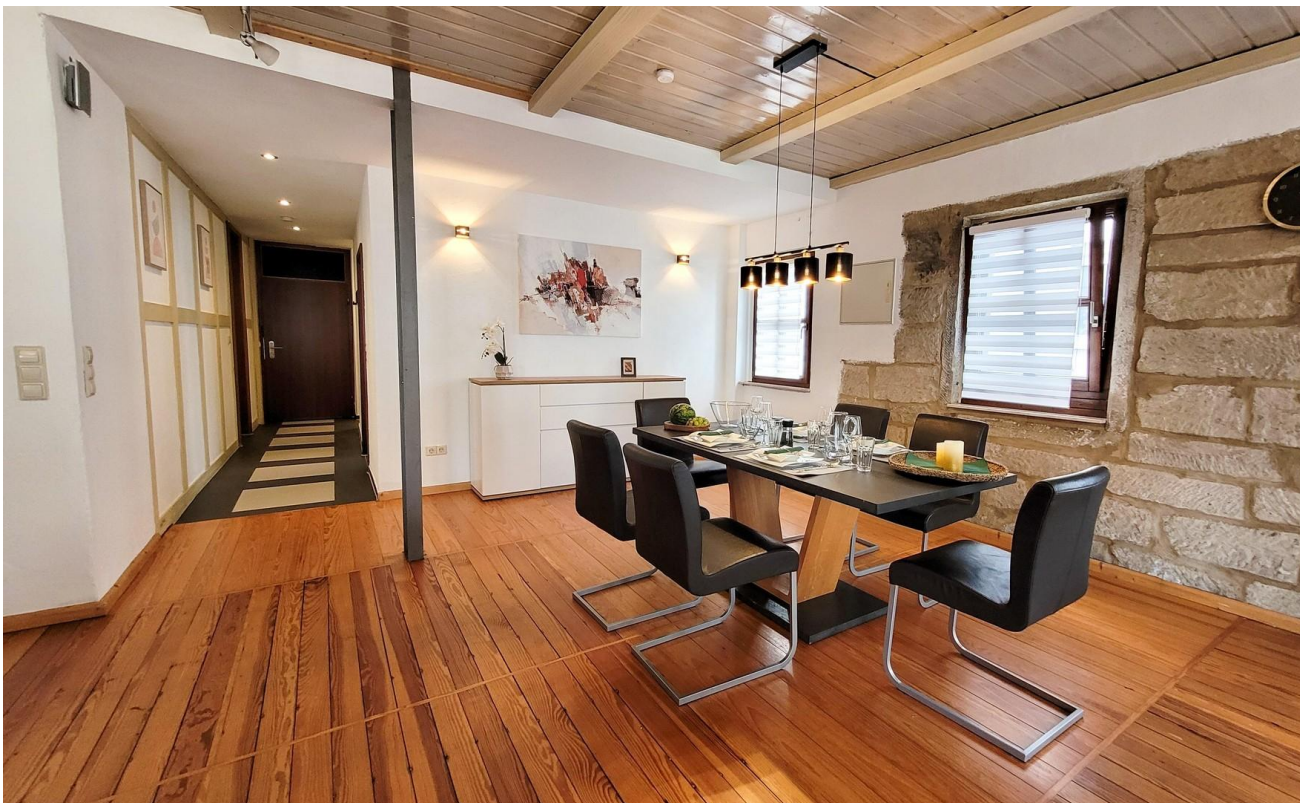
Esszimmer und Flur