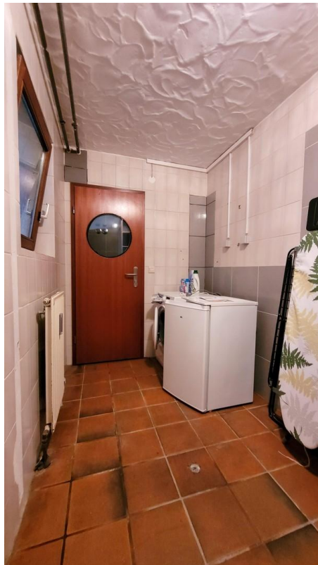
Lagerraum mit Zubehör