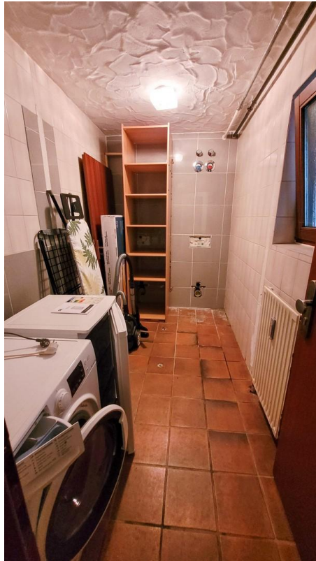
Lagerraum mit Zubehör