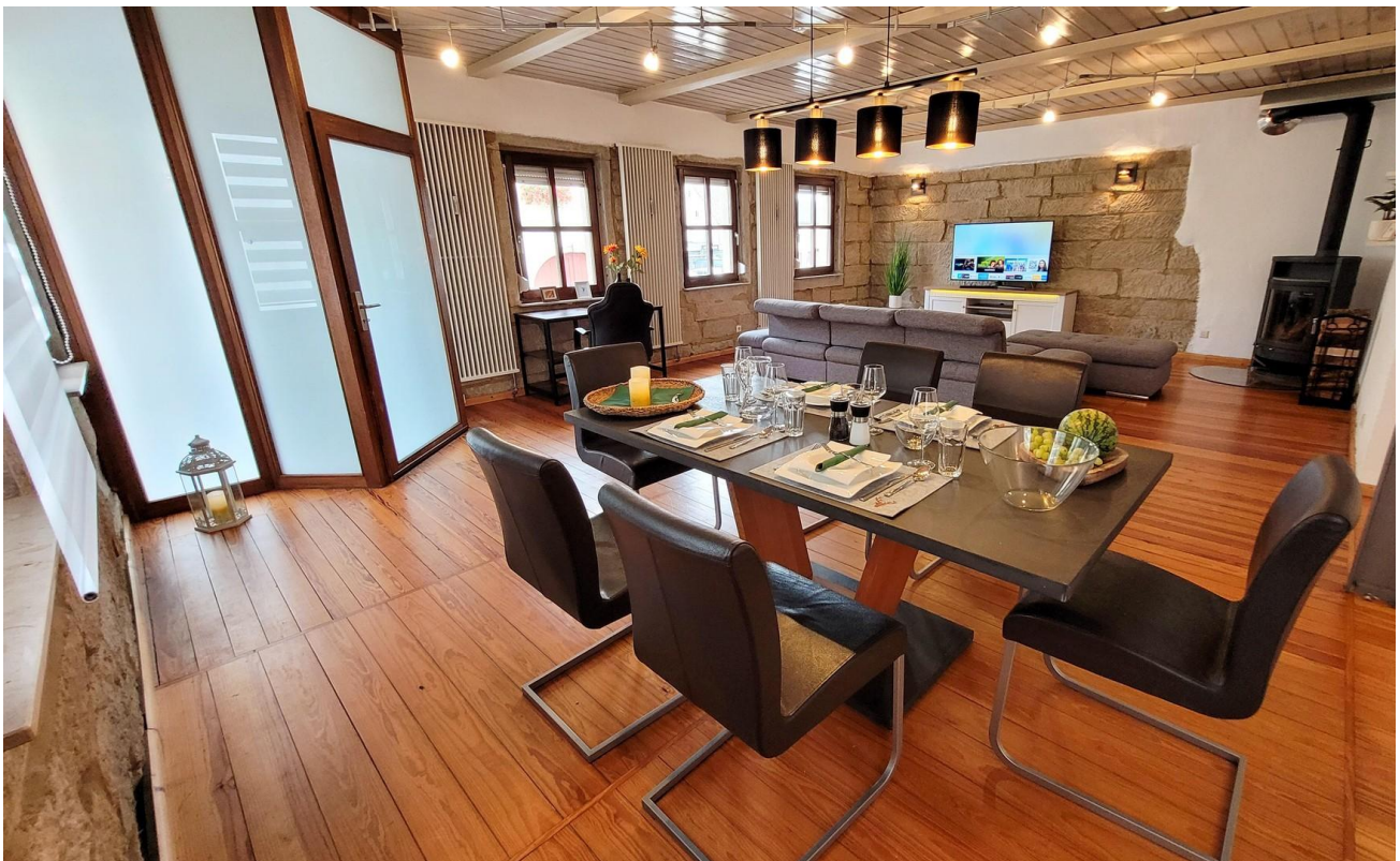
Ess- und Wohnzimmer