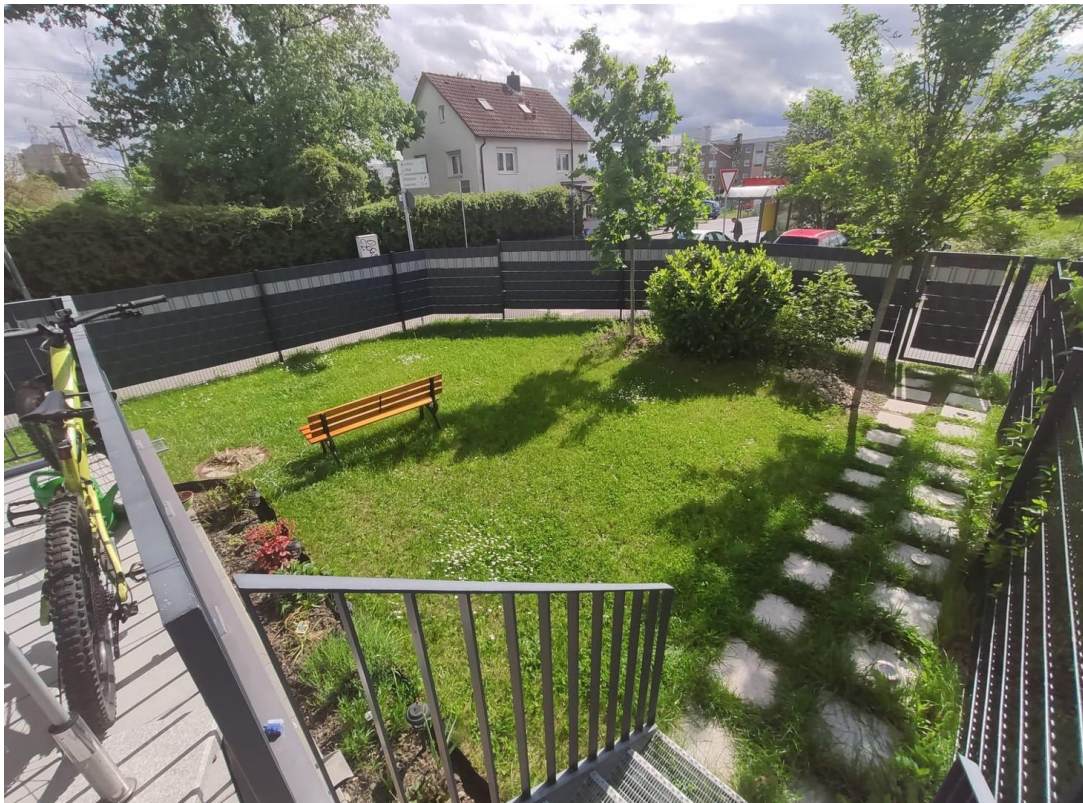
Garten mit Balkon