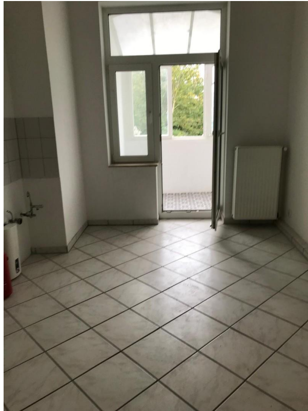
2. OG Küche