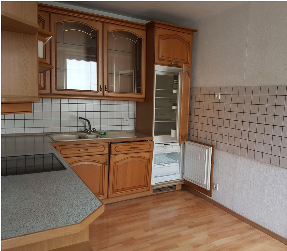
OG Küche 2