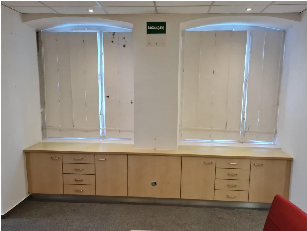
EG laden 3