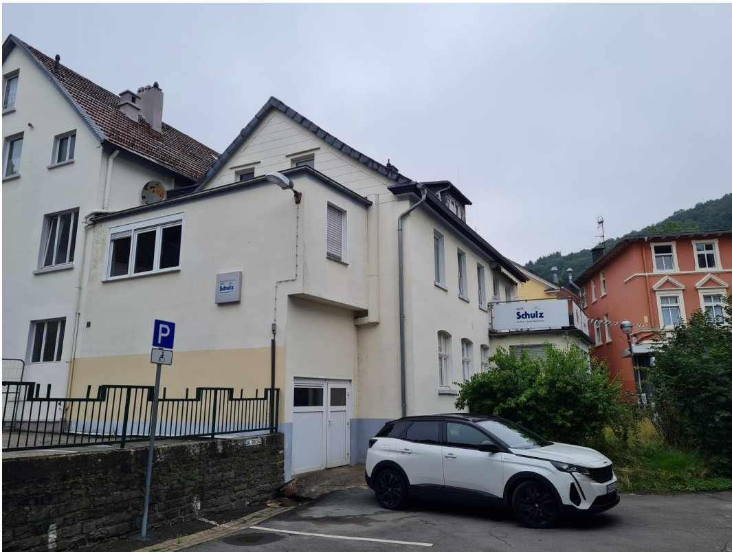
Garage und Stellplätze