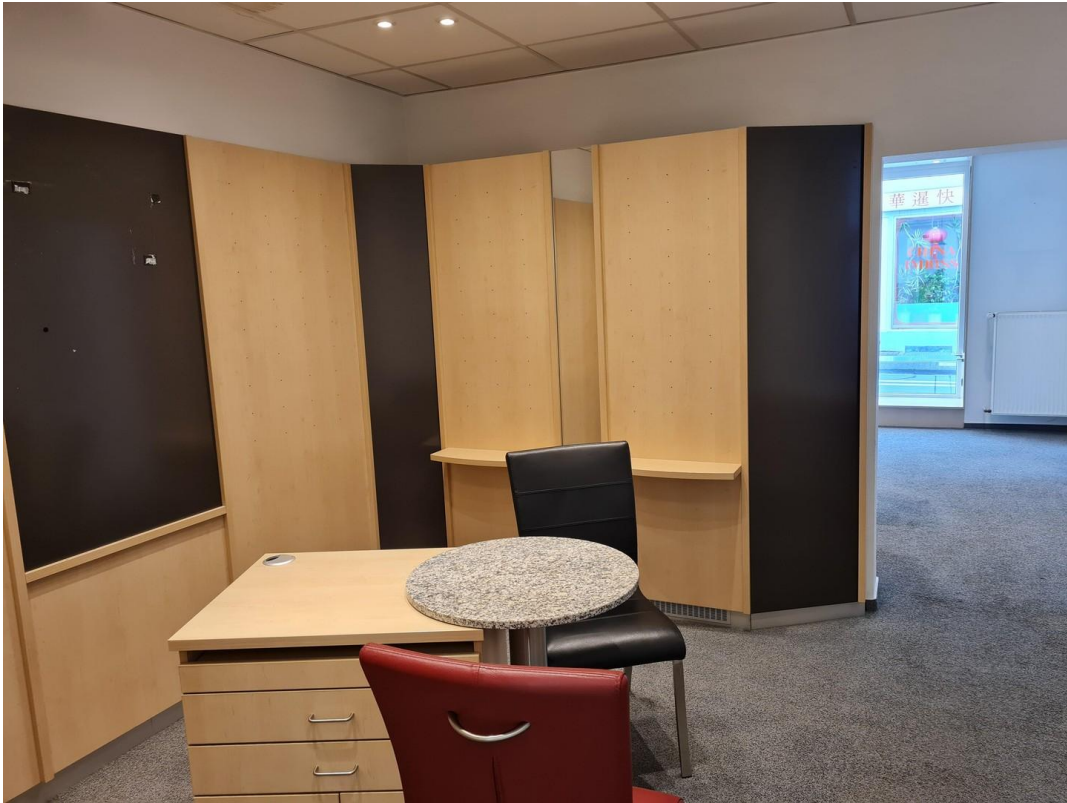
EG Laden 2