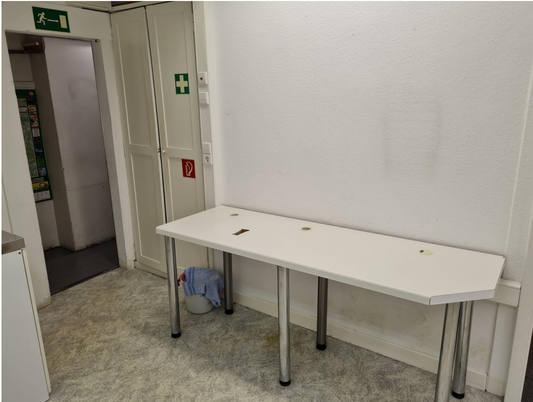
EG Laden 4