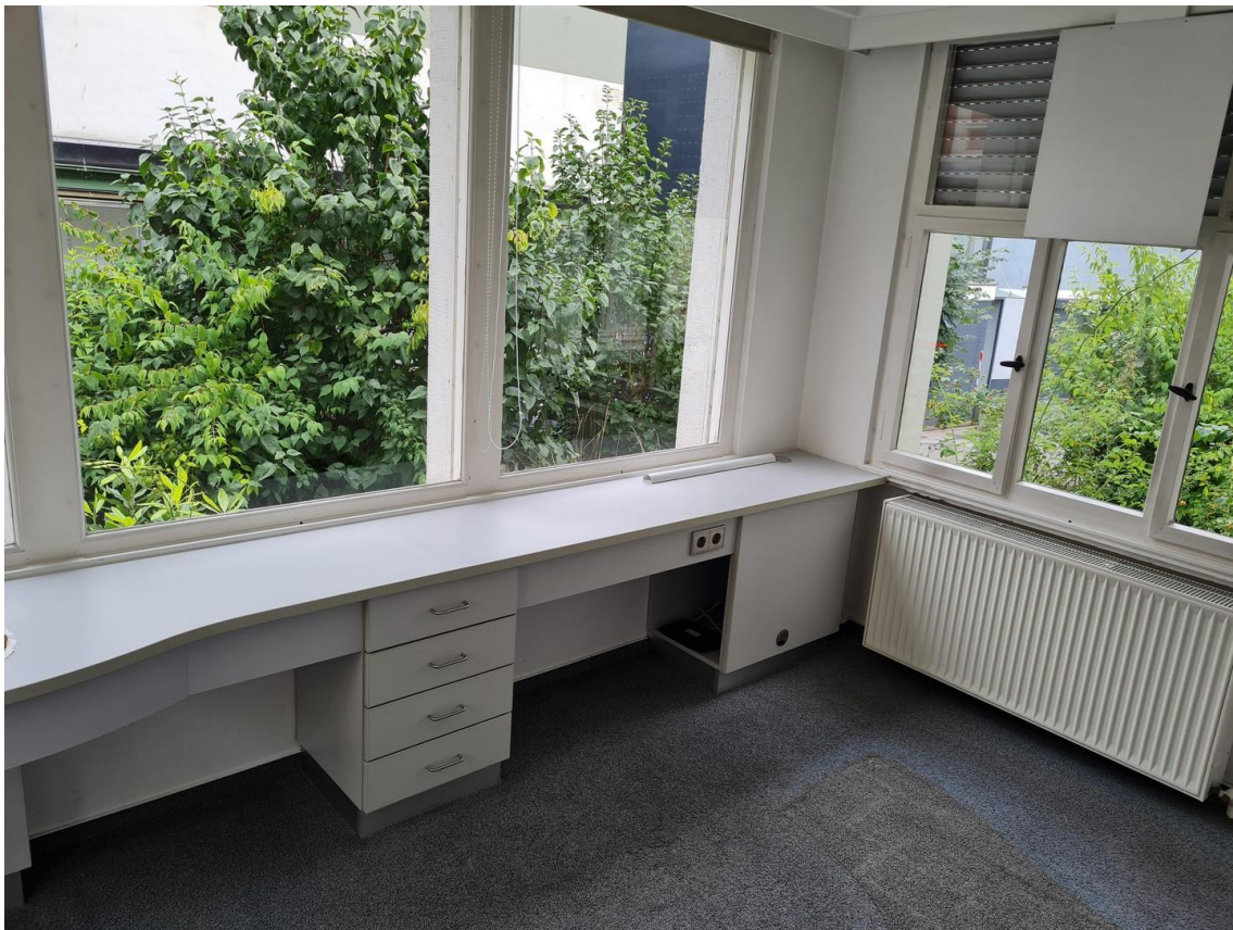
EG Laden 1