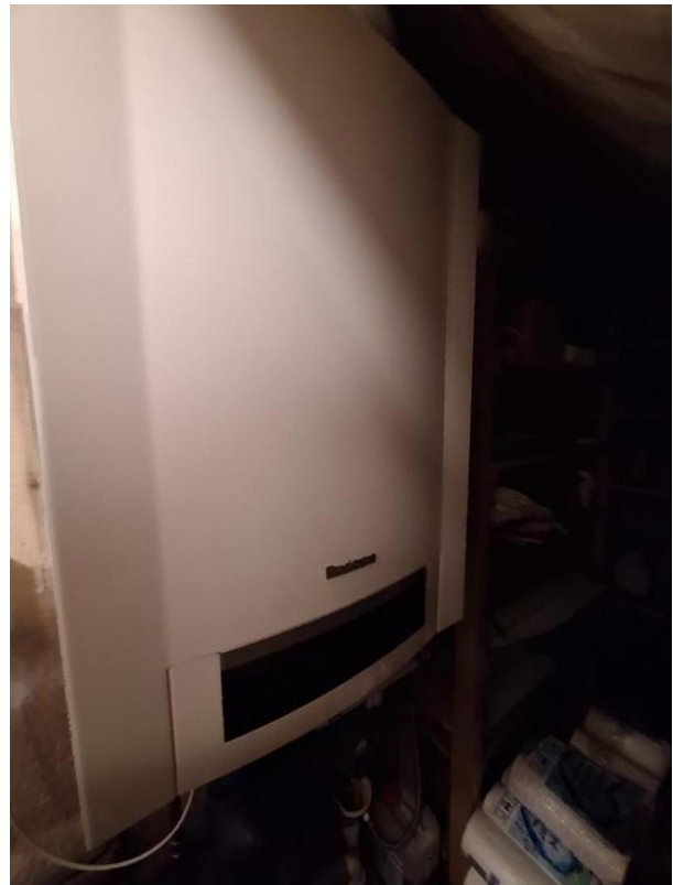
Therme neu in 2020