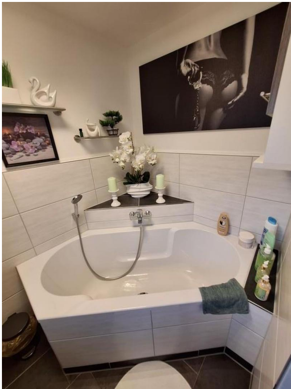
Badewanne im Wohlbereich