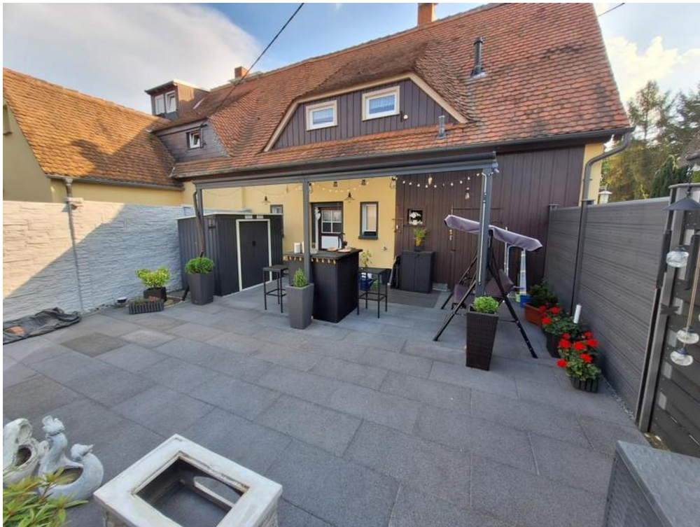
Rückseite mit Terrasse