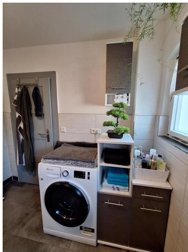
Waschmaschine im Bad