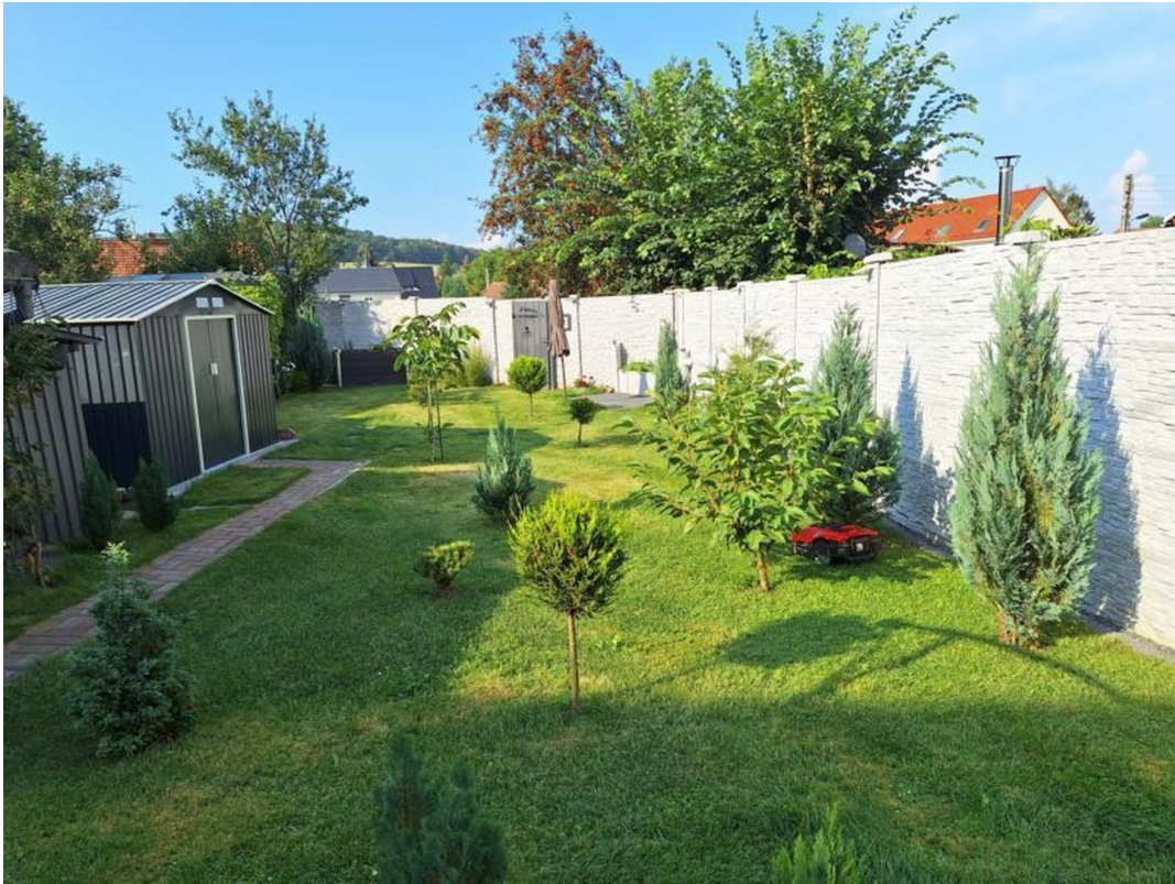
Garten mit neuer Bepflanzung