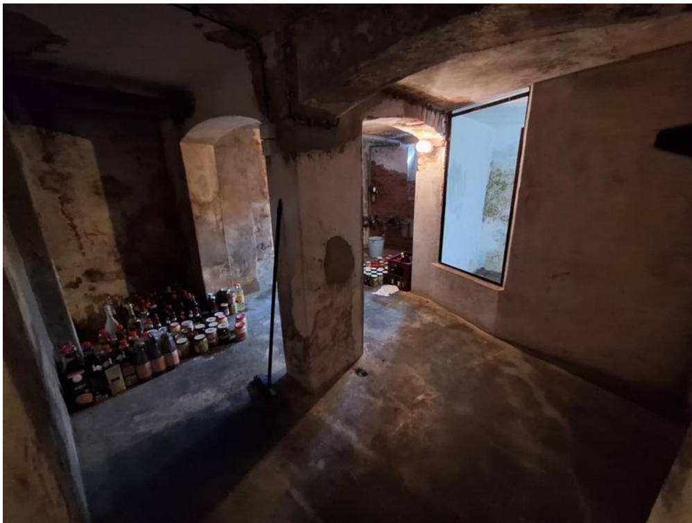
Keller ist trocken