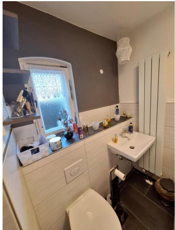
Waschtisch und WC im Bad