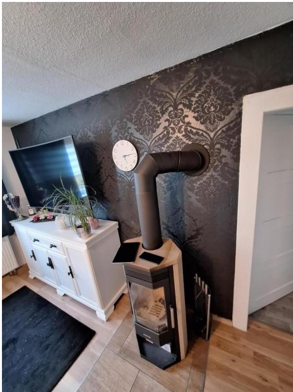
Kamin im Wohnzimmer