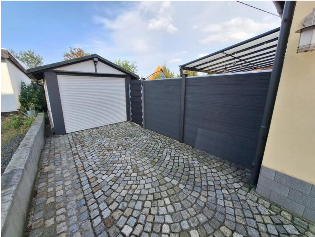
Einfahrt mit Garage