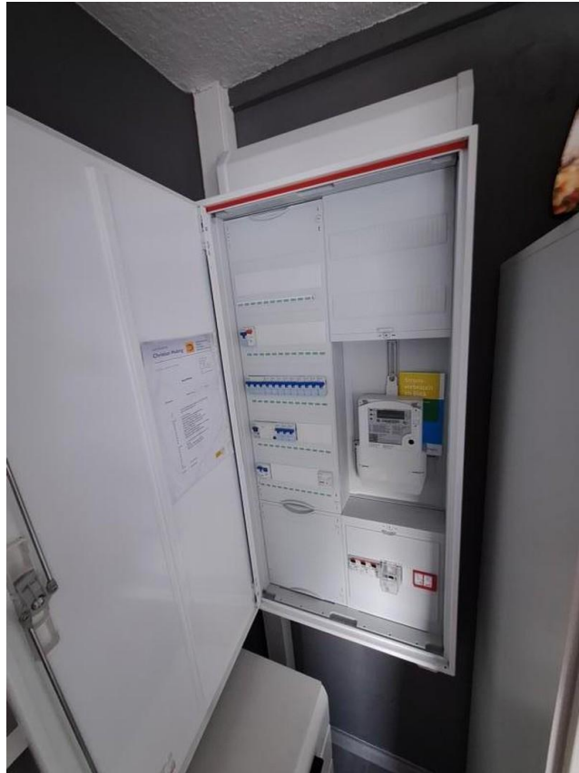
Elektrik neu 2022