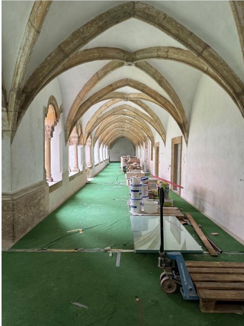
Hausflur - Kreuzgang