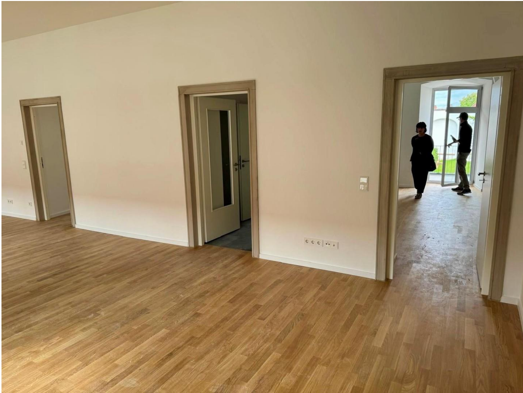
Vom Wohnzimmer in die weiteren