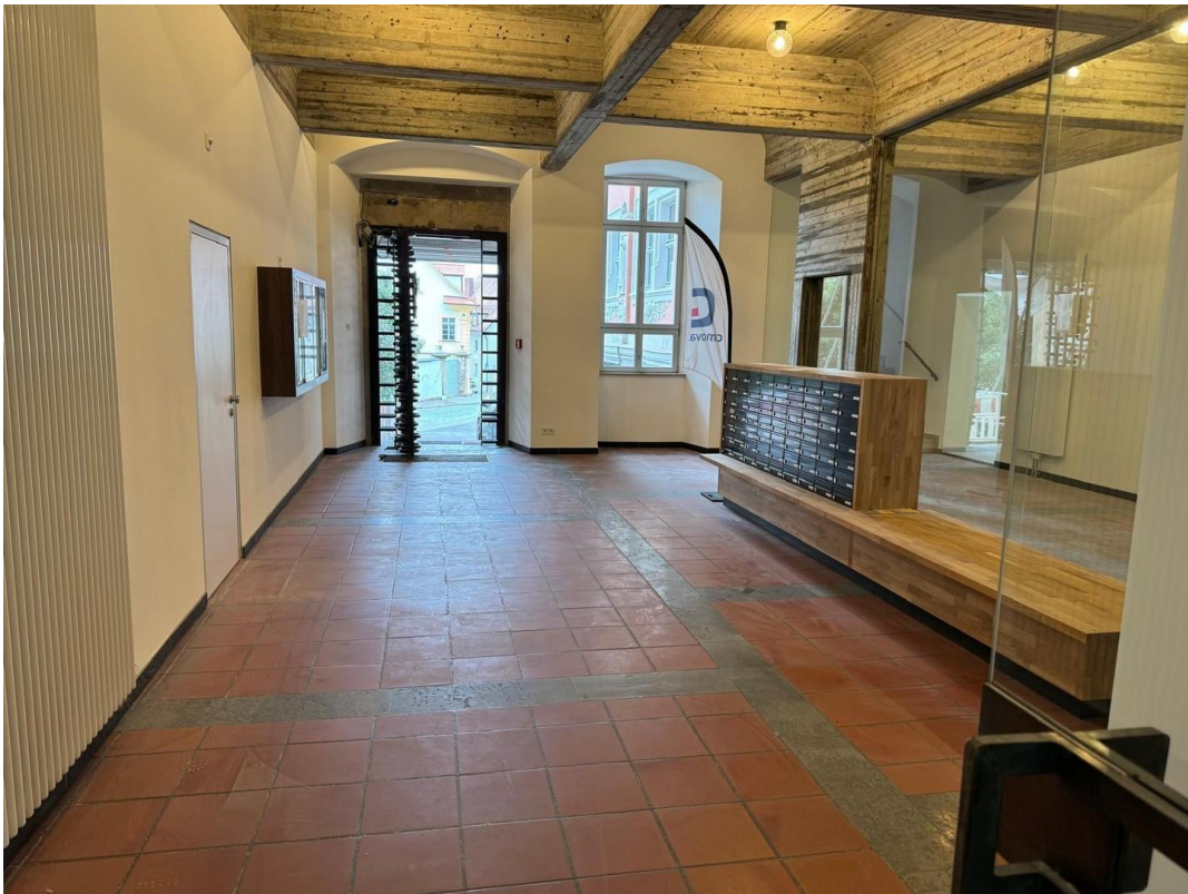
Haustür und Briefkästen