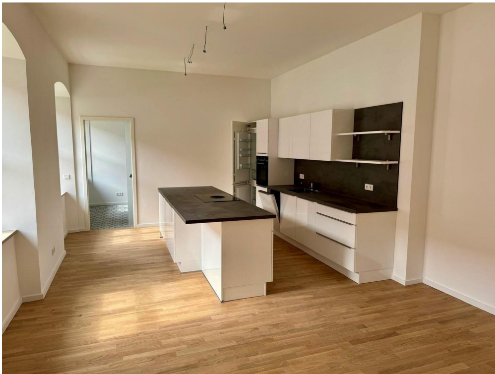
offener Wohn- Essbereich