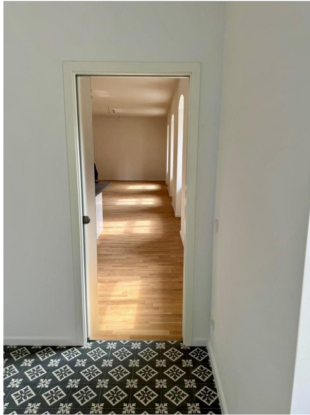
Zugang zu dem Wohnbereich