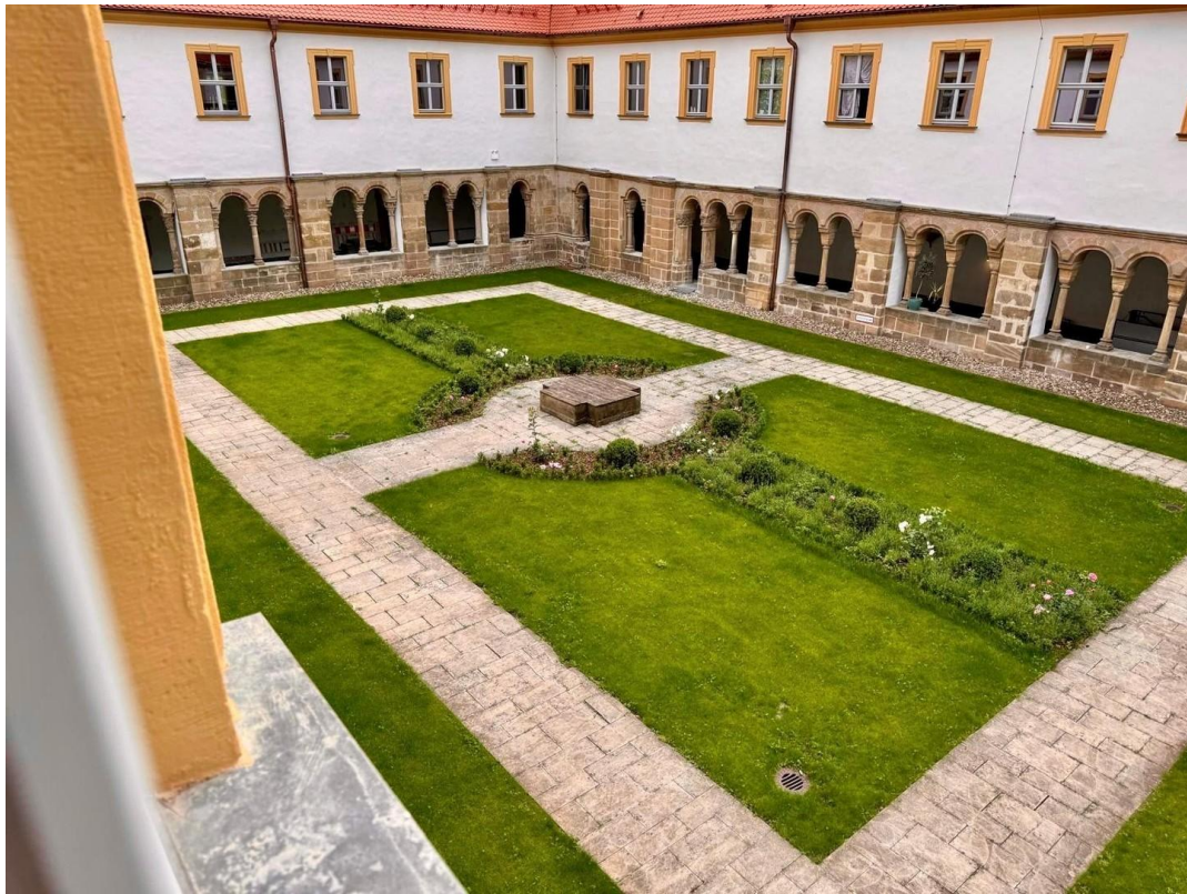
Blick in den Klostergarten