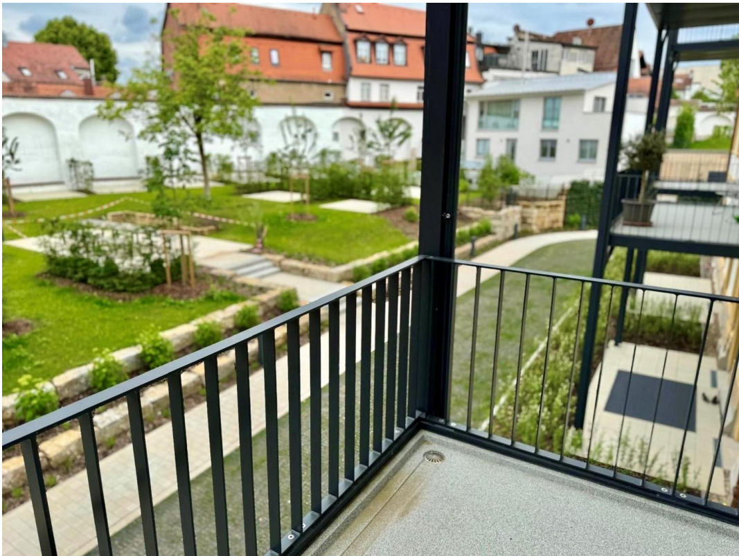
Balkon 2 mit Blick in den Hof