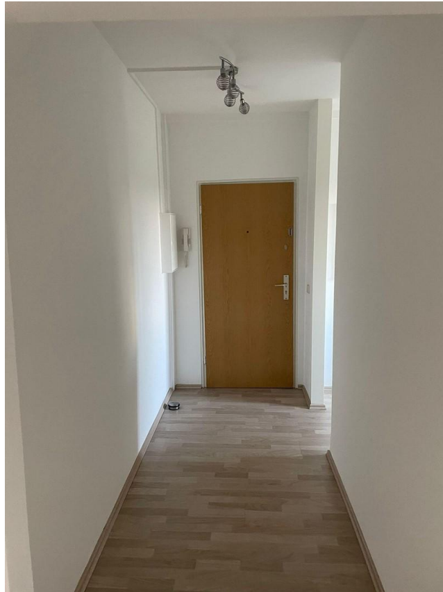
Flur Blick zur Eingangstür