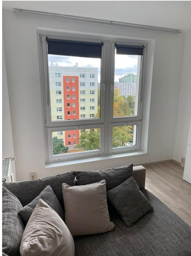
Wohnzimmer Blick nach Aussen