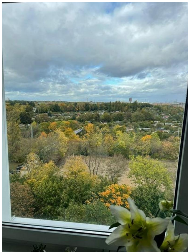
Blick aus der Küche