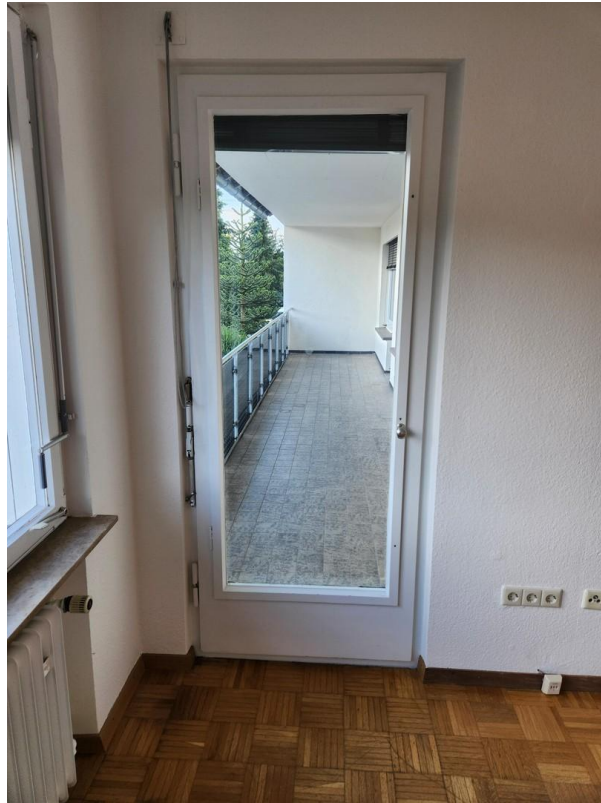
Zugang zum Balkon