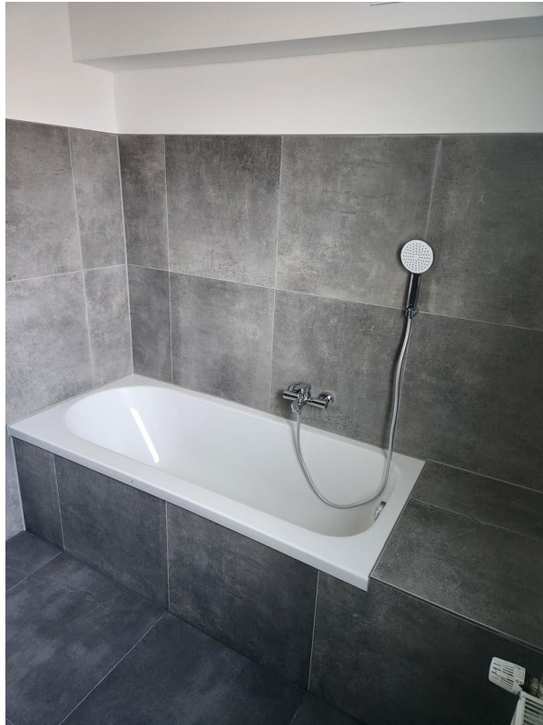
Bad / Badewanne