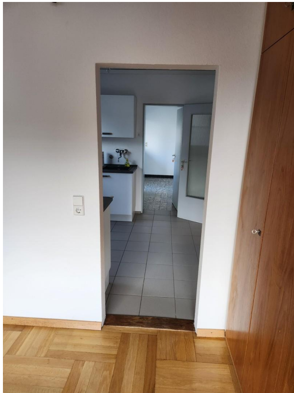
Zugang zur Küche vom Esszimmer