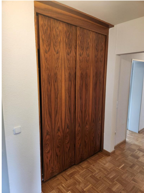
Schrank im Flur