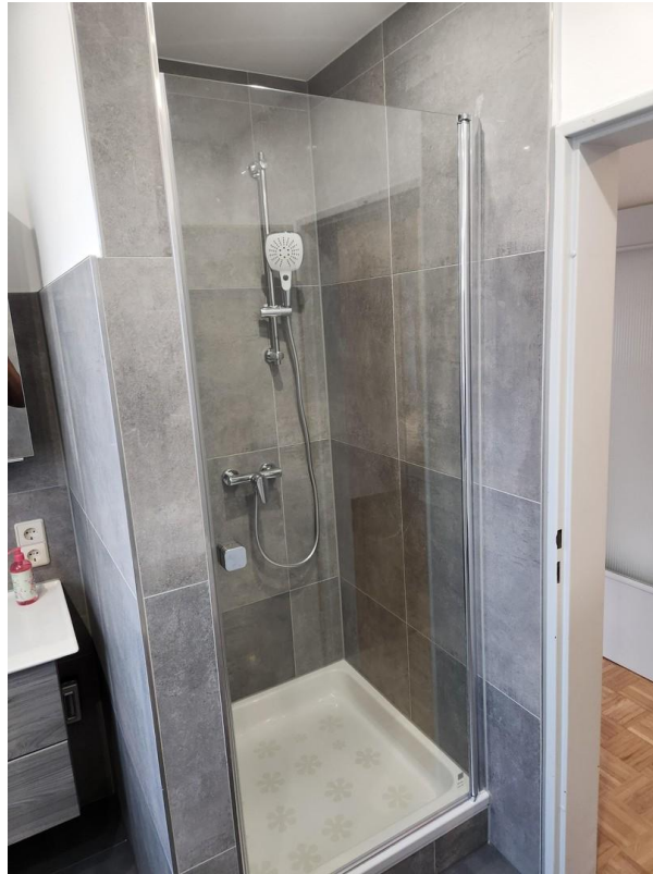
Bad / Dusche