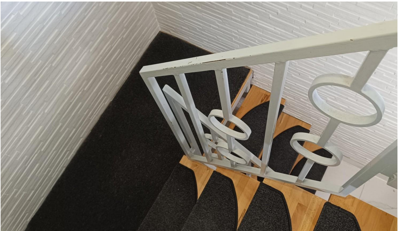
Treppe zur Speisekammer/Keller