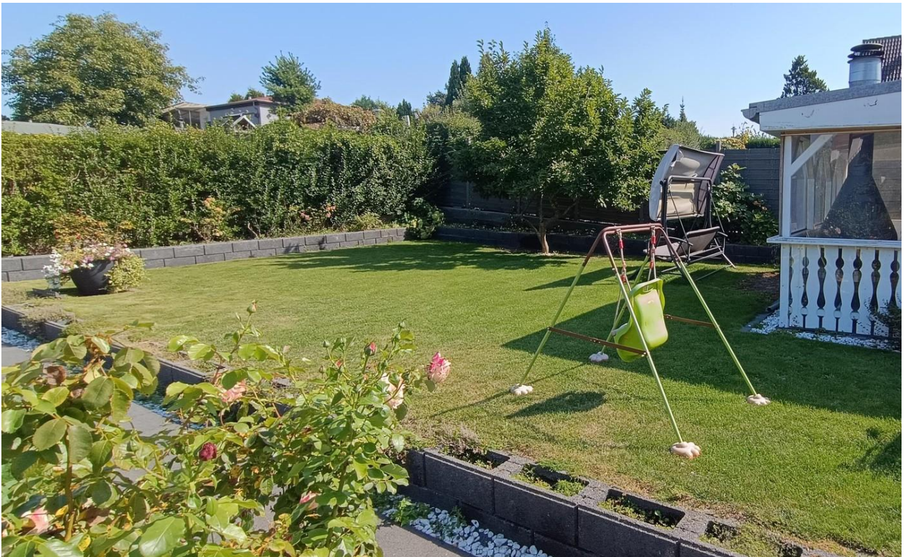
Blick zum ebenerdigen Rasen