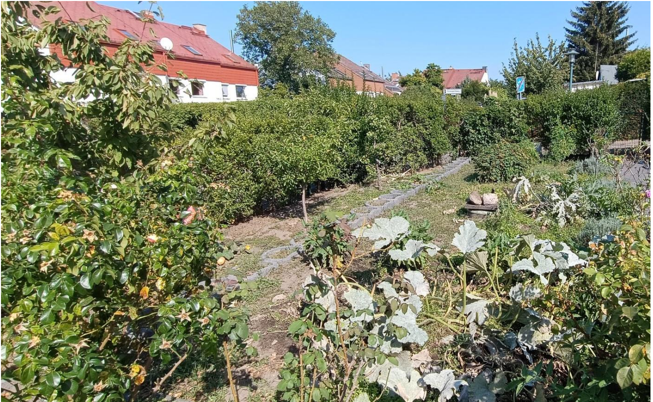
Obstbäume und Beete