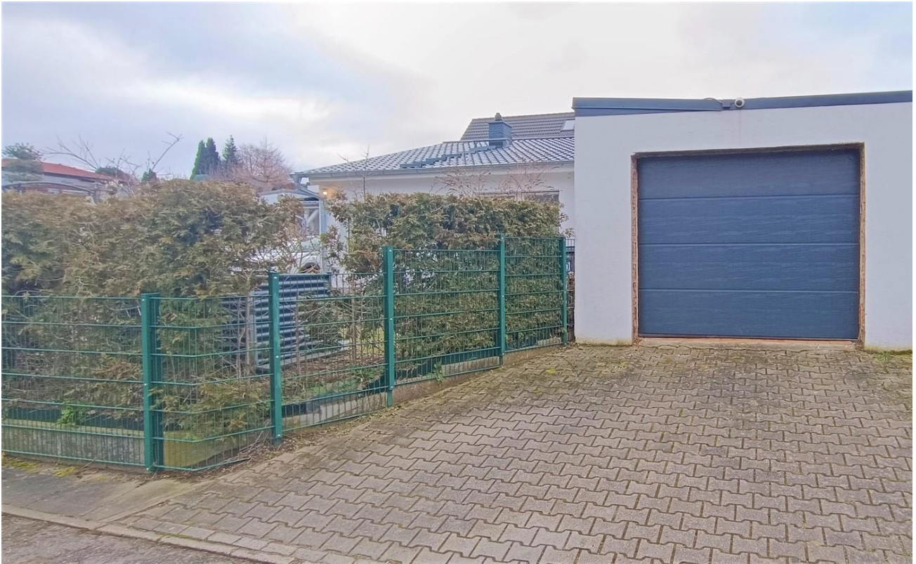
Einzelgarage / Umbau möglich