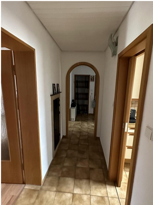
Blick in den Flur 1