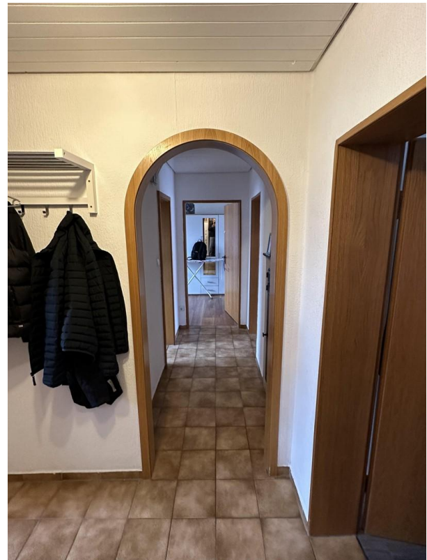
Blick in den Flur 2