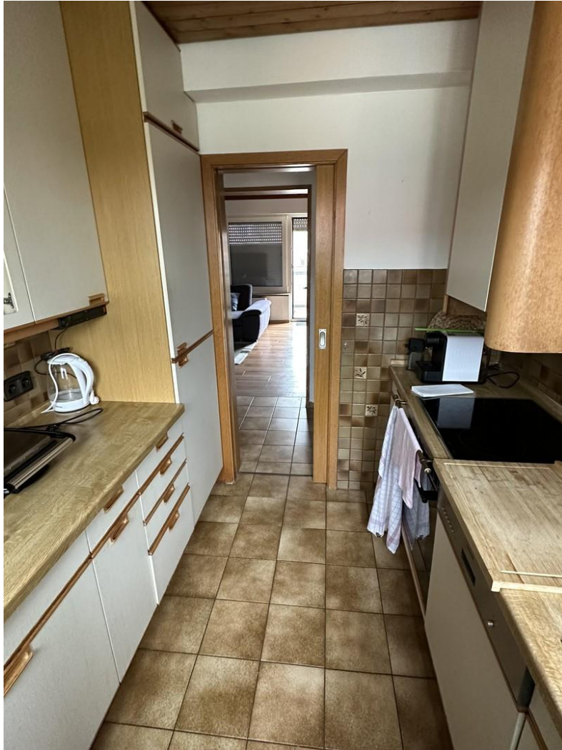
Blick in die Küche 2