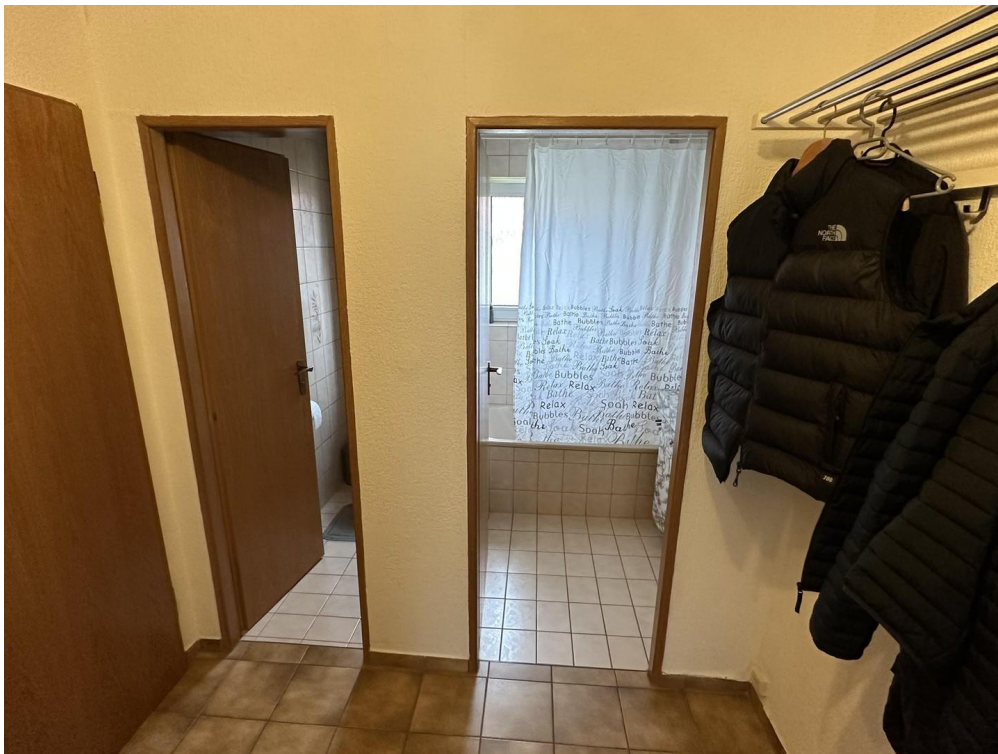
Blick in den Flur 3 (Bad/WC)