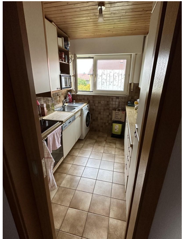
Blick in die Küche 1