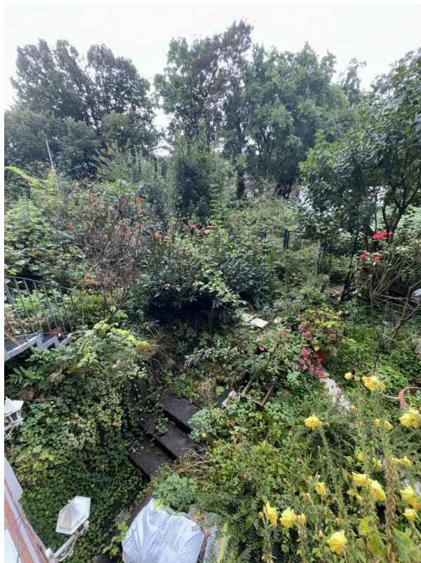
Garten zum mitbenutzen