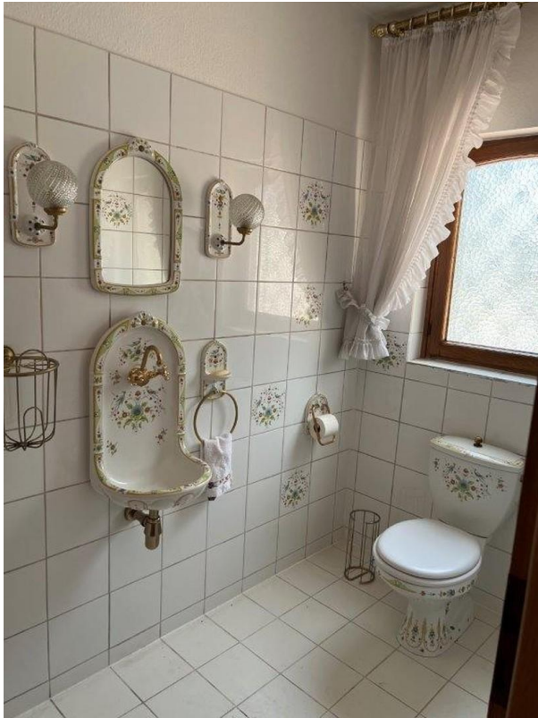
Liebhaber Gäste WC