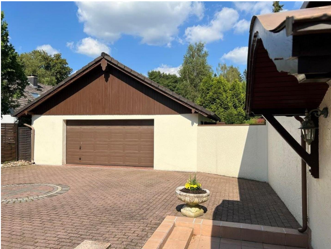
Doppelgarage mit Vorplatz