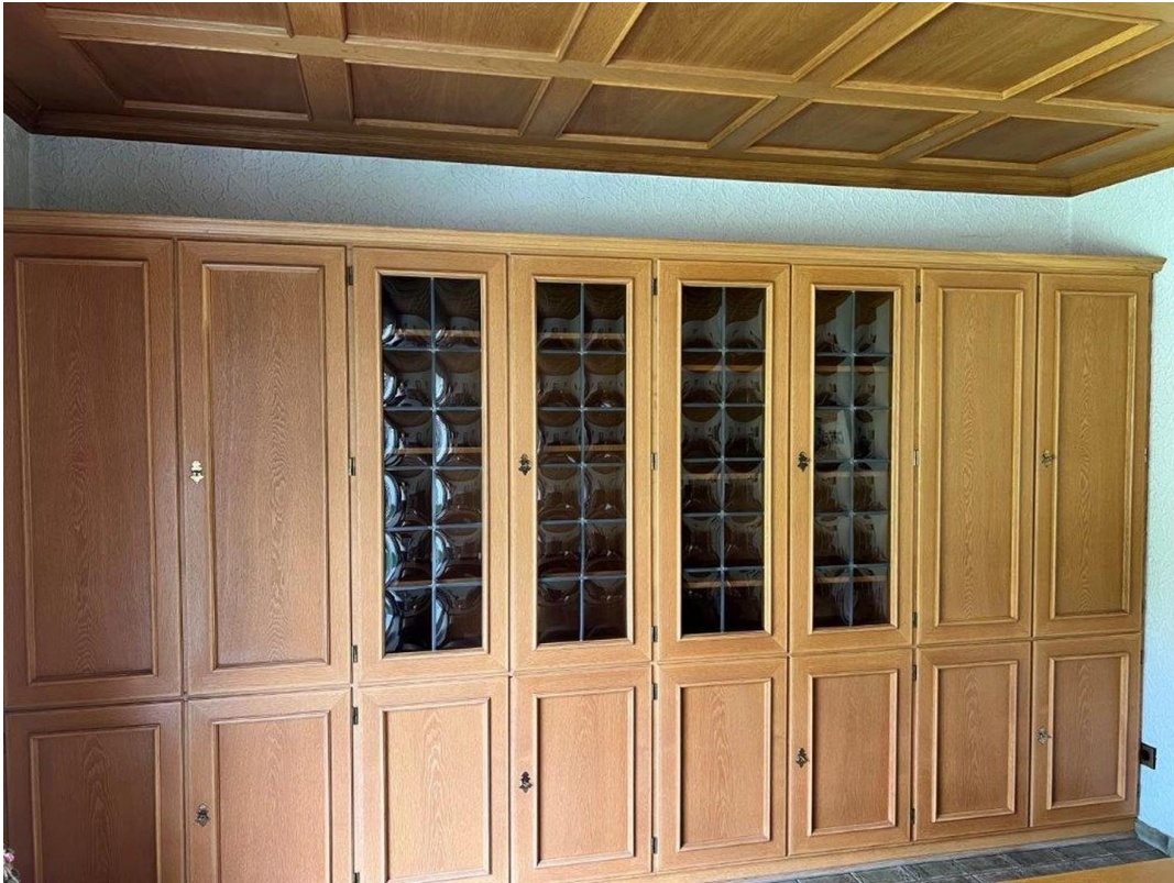
Einbauschränk im Arbeitszimmer