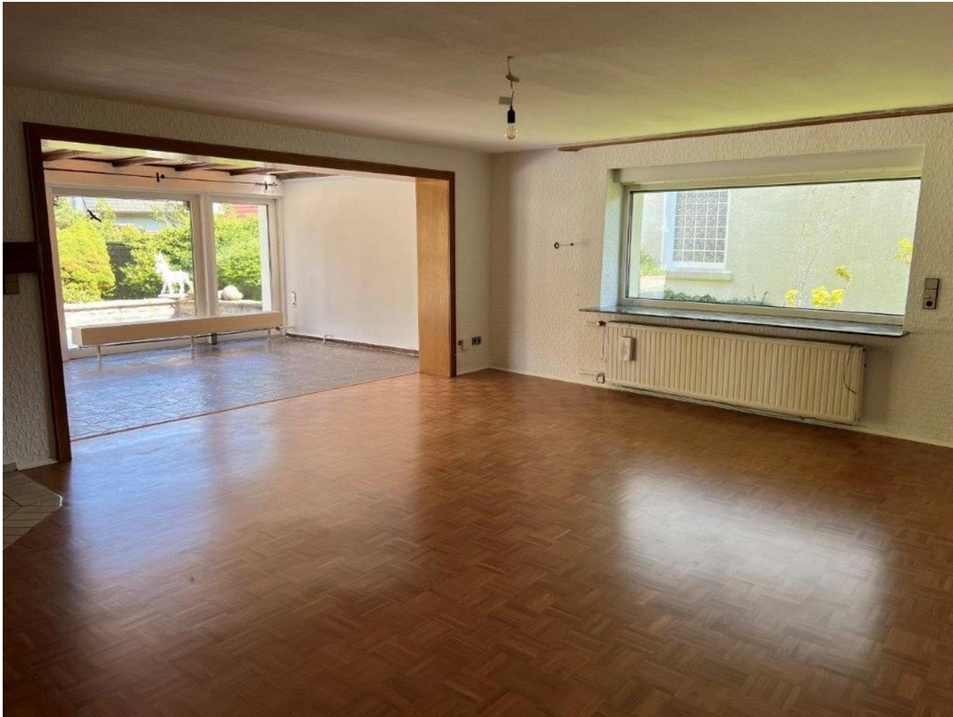
Wohnzimmer und Wintergarten