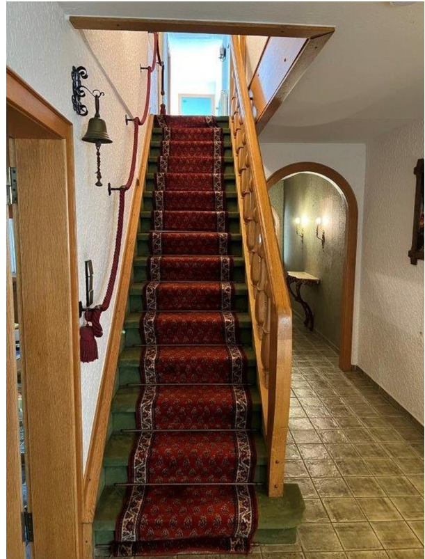
Aufgang zum OG