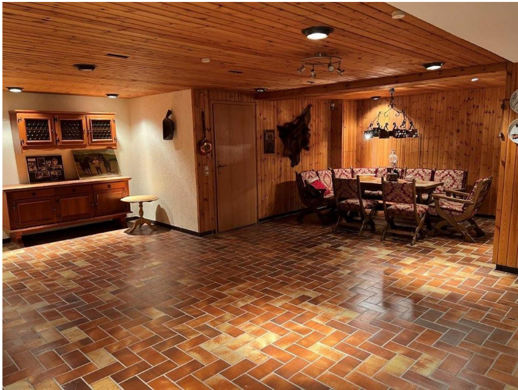
Fitness und Gesellschaftsraum