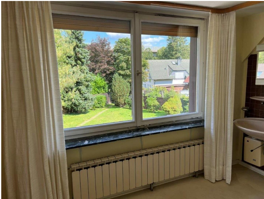
Großes Zimmer OG