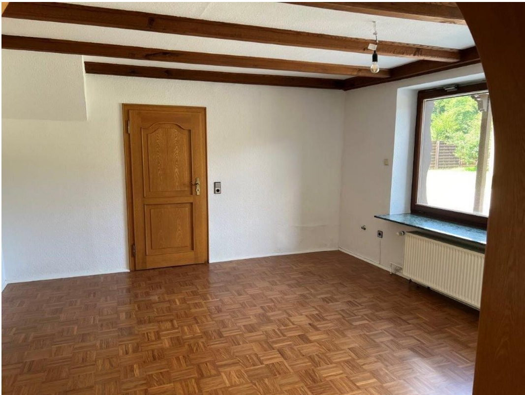
Blick ins Esszimmer