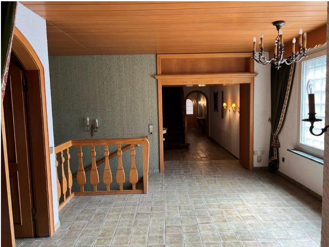
Blick von der Diele ins Haus