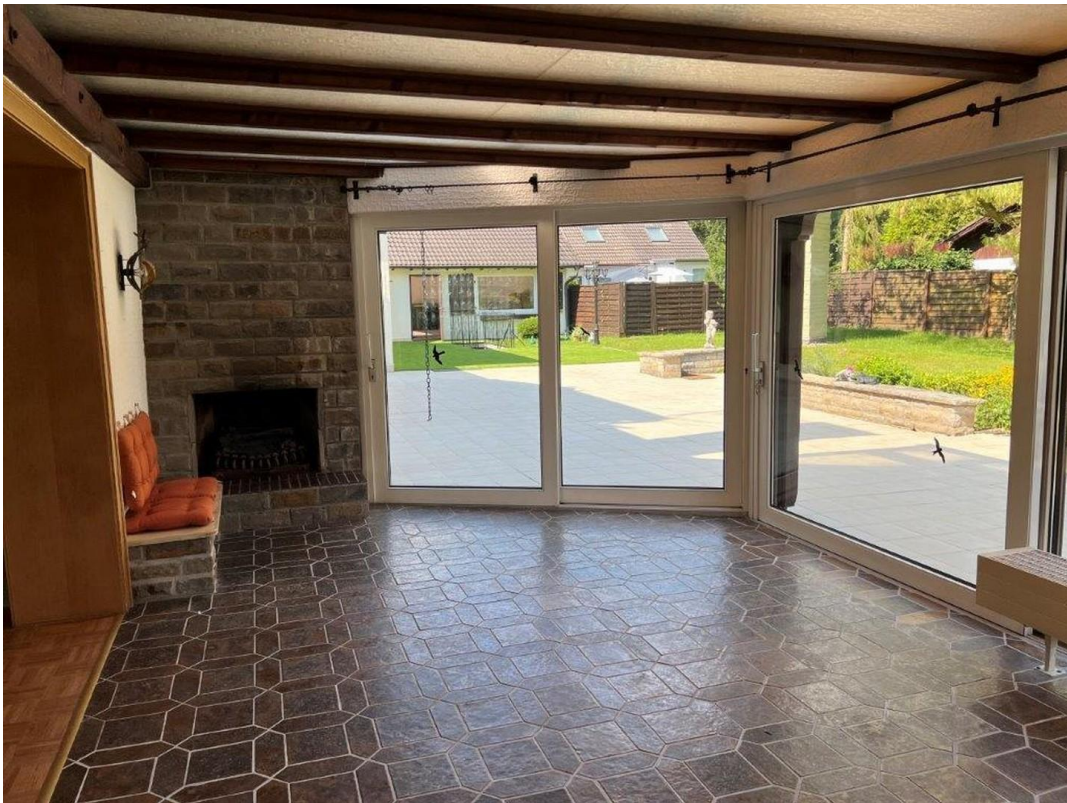
Wintergarten mit Kamin