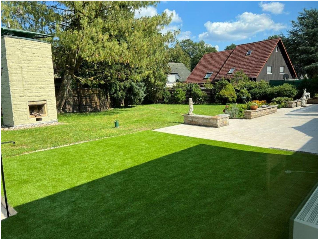
Terrasse und Garten