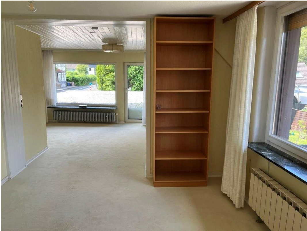
Großes Zimmer OG