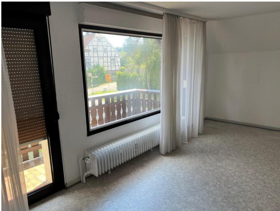
Schlafzimmer mit Balkon