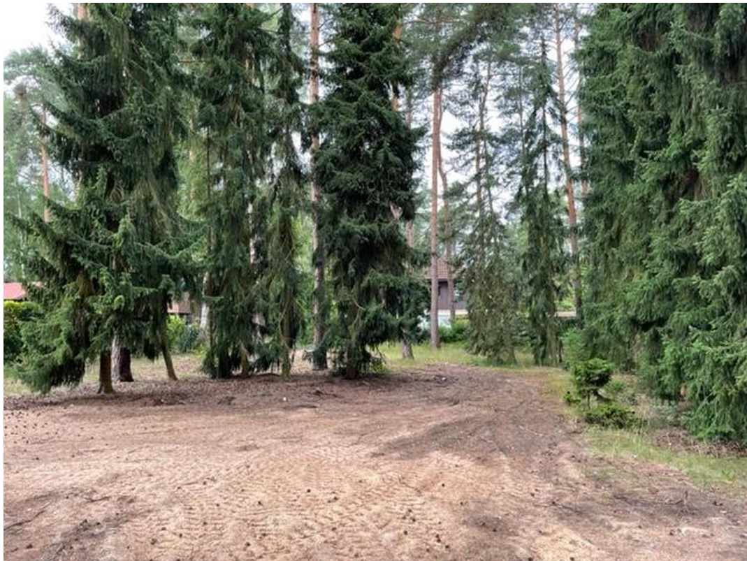
Platz für Ihr Projekt