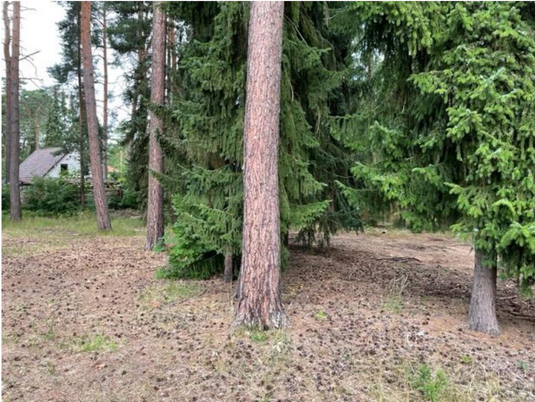
Bestlage in Wandlitz