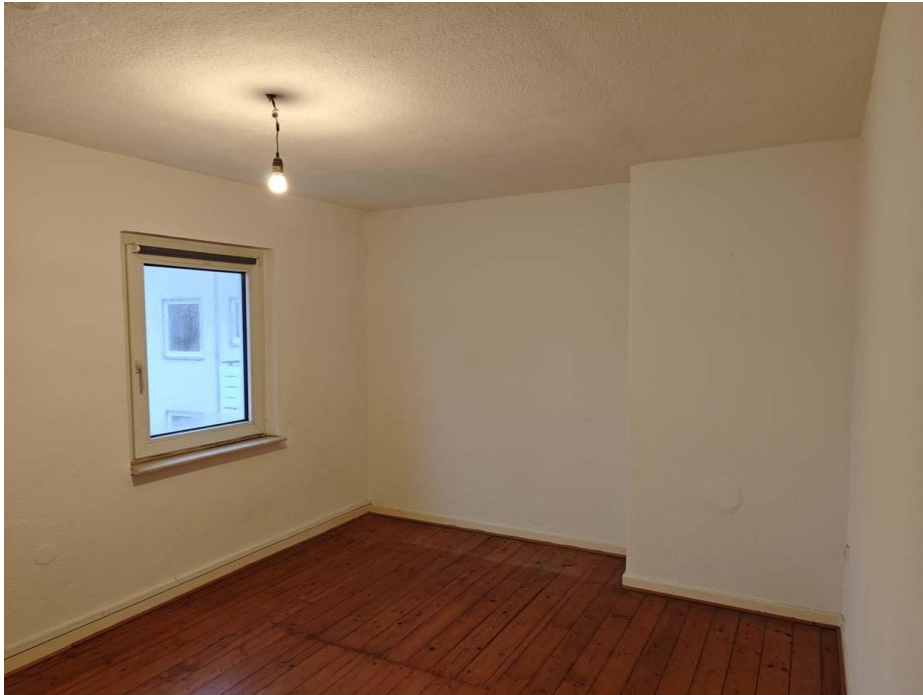
XIAOMI 14 ULTRA 2025.01.05 16:09:38