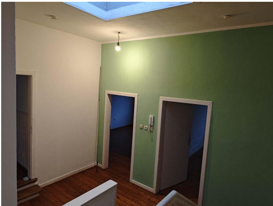
XIAOMI 14 ULTRA 2025.01.05 16:09:56