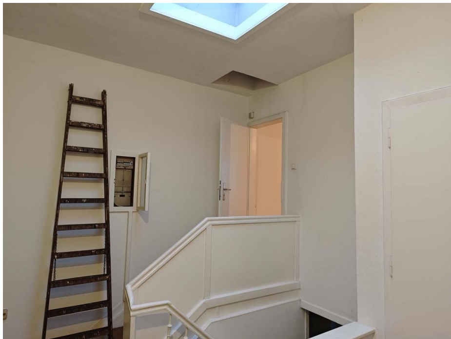
XIAOMI 14 ULTRA 2025.01.05 16:10:06