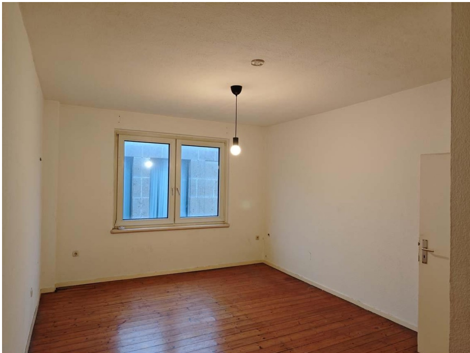
XIAOMI 14 ULTRA 2025.01.05 16:11:04