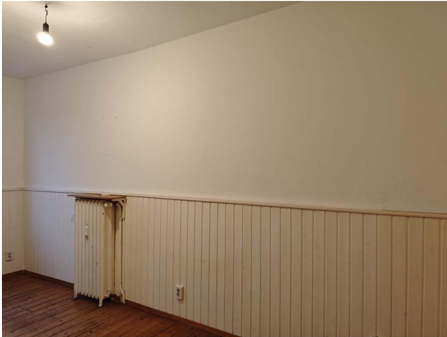
XIAOMI 14 ULTRA 2025.01.05 16:10:20