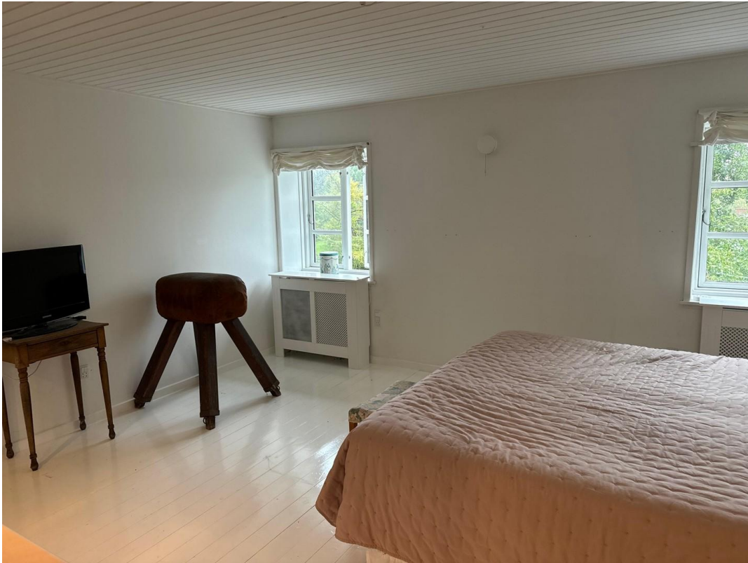
guest room top floor