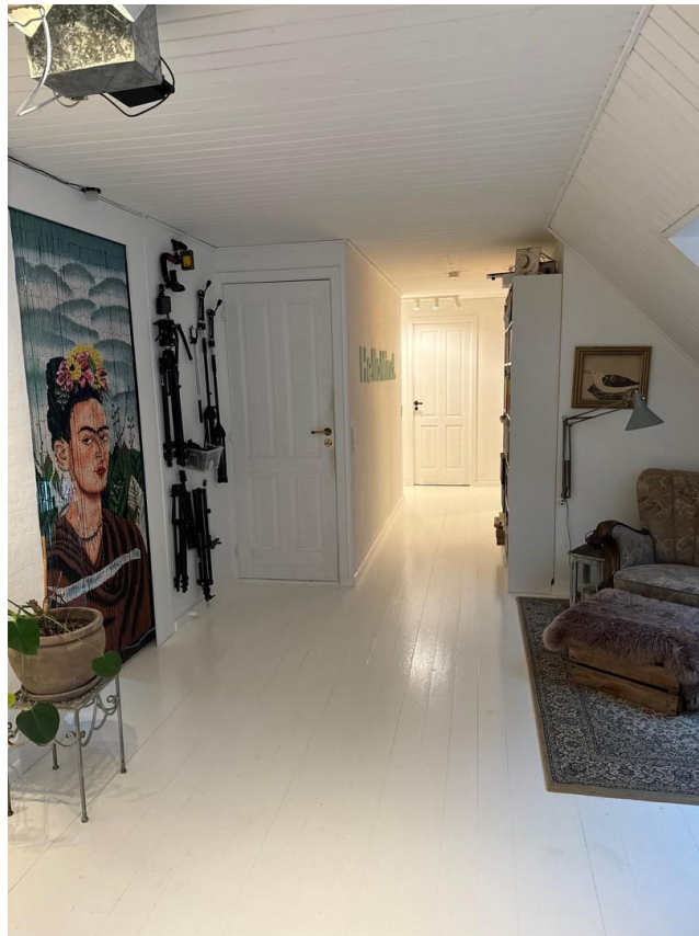
top floor hall