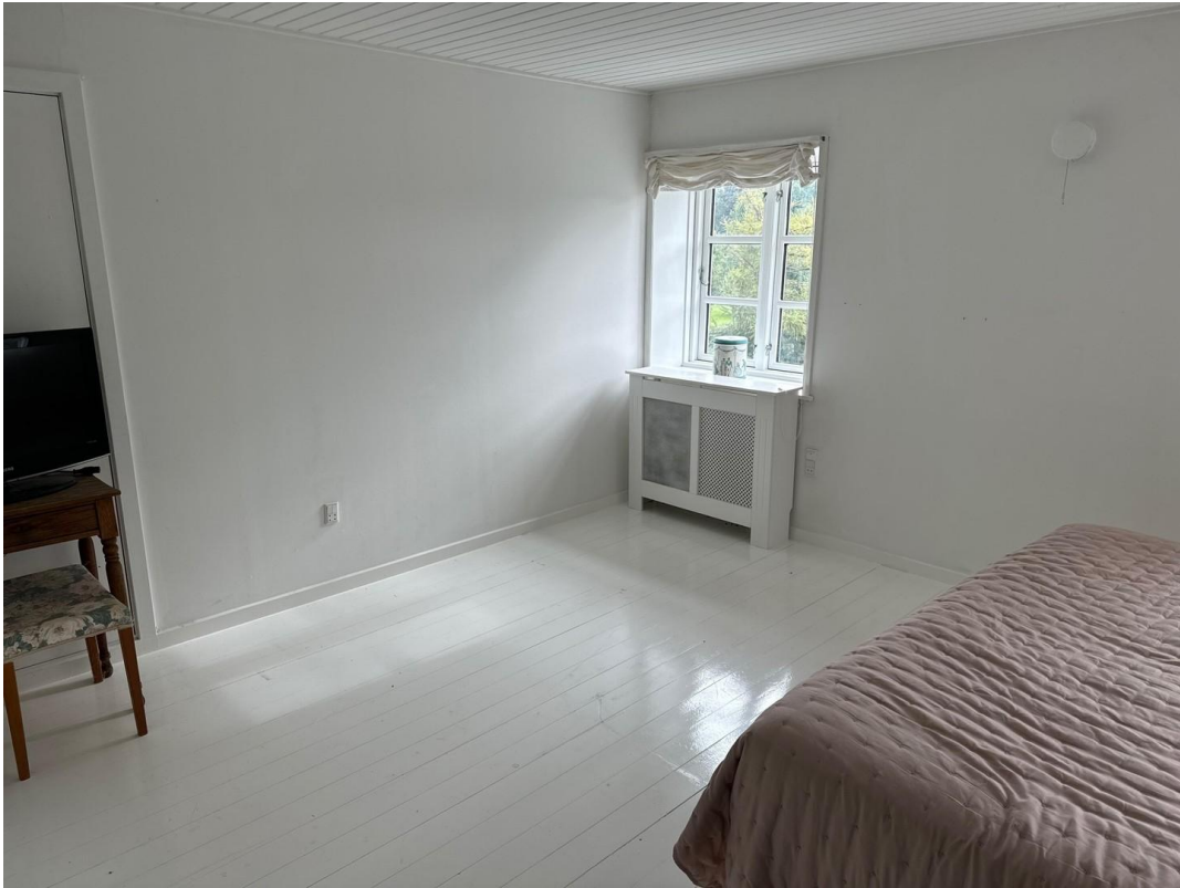
top floor guest room