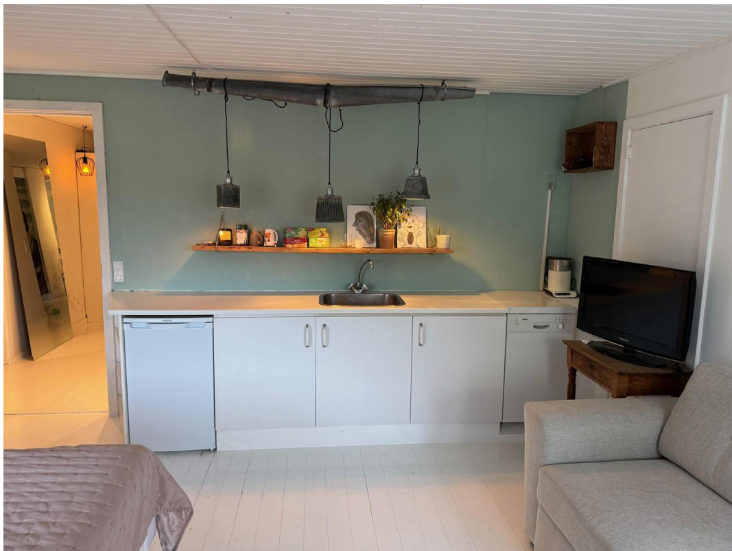
top floor guest room