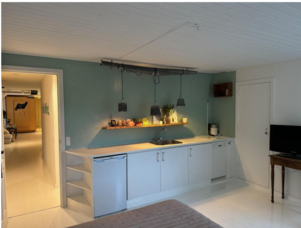
guest room top floor