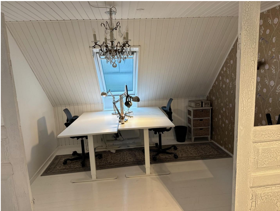
top floor work place