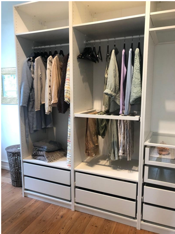
walking closet..there are 3