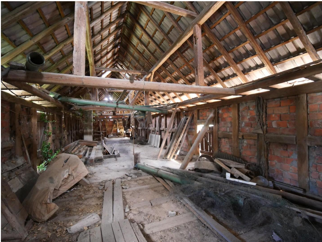
Dachboden im Getreidespeicher