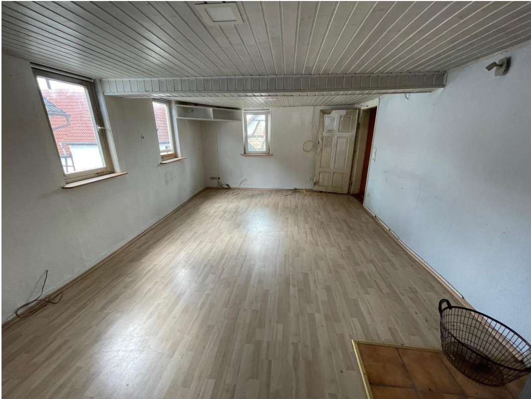
Haupthaus Zustand 3