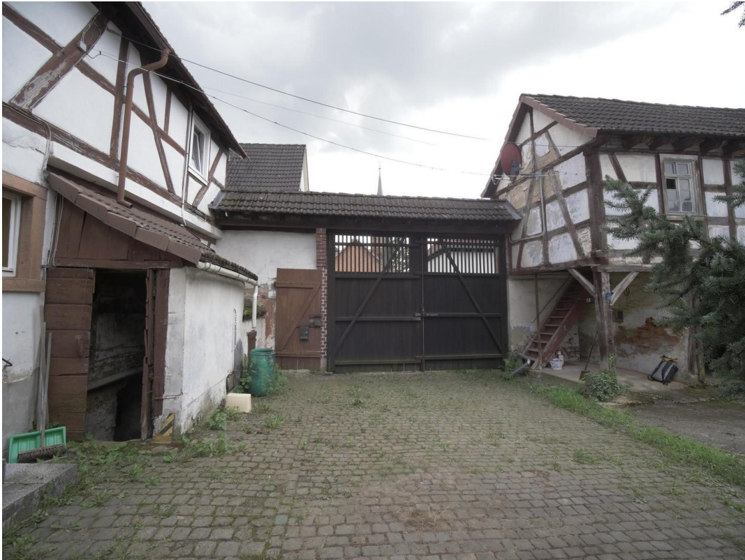
Blick aufs Tor von Innen