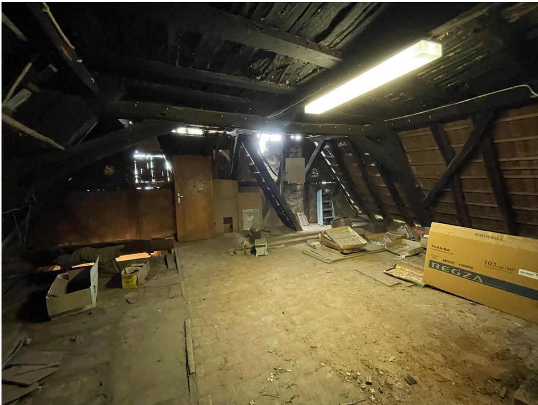
Haupthaus - Dachboden