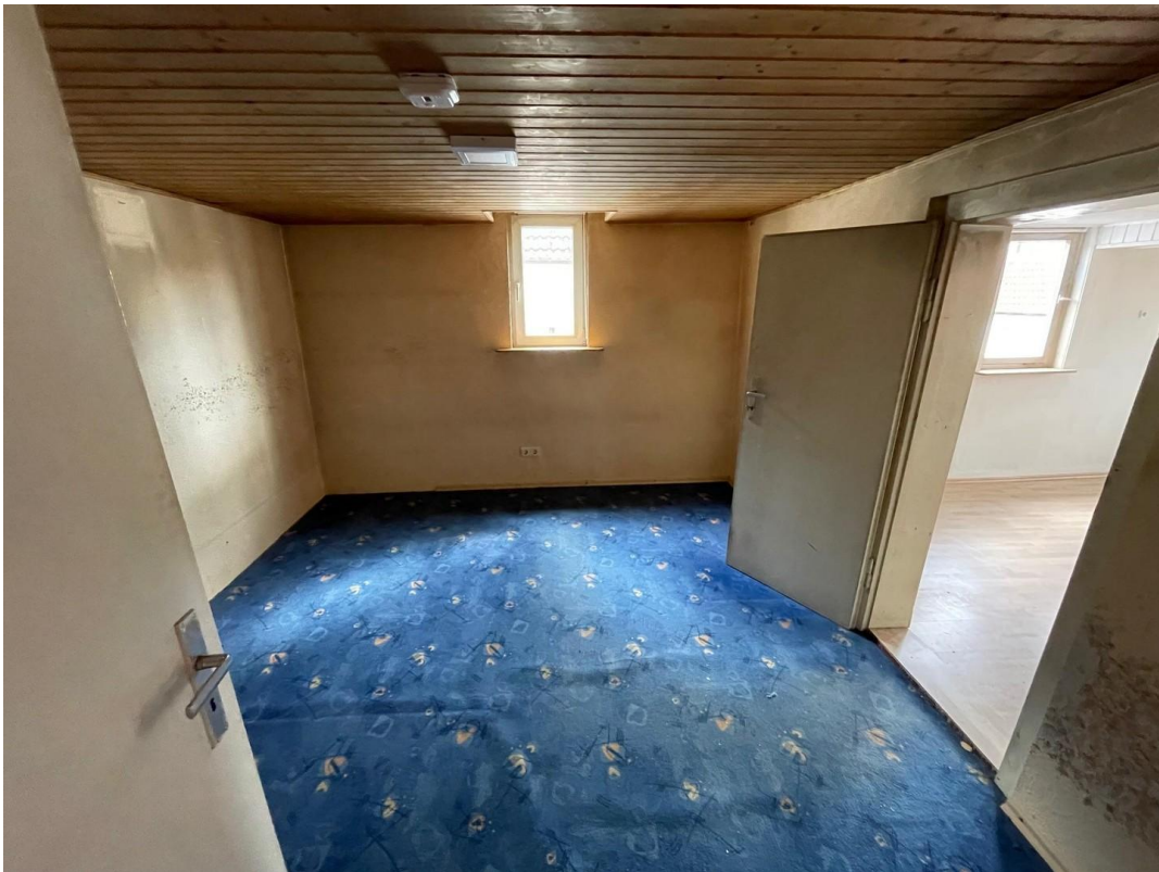
Haupthaus Zustand 2