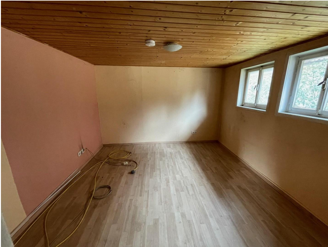
Haupthaus Zustand 1