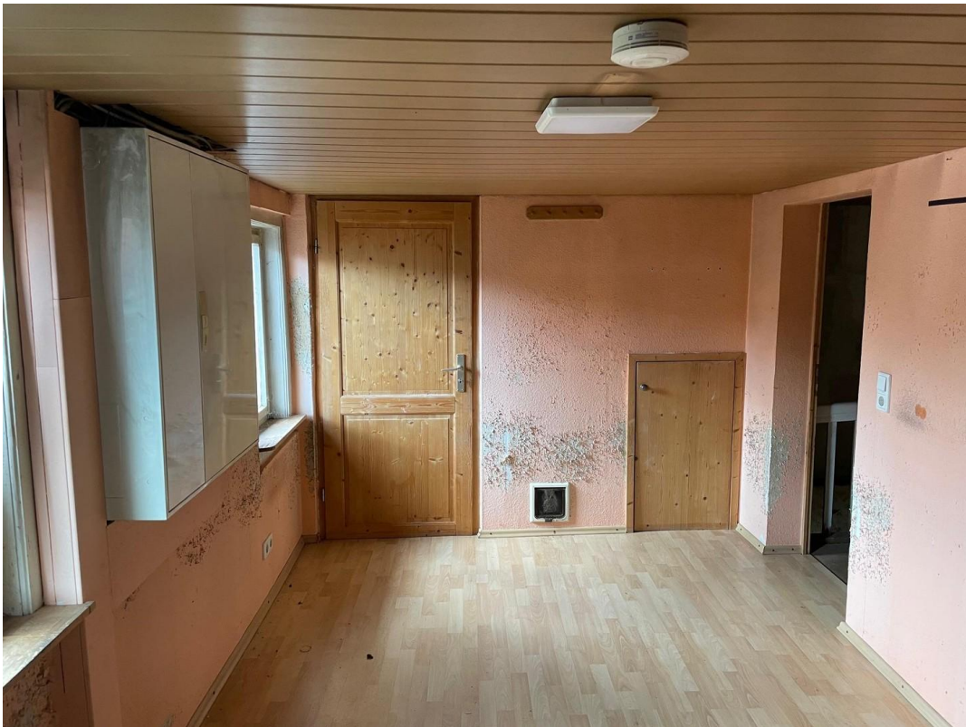
Haupthaus Zustand 4