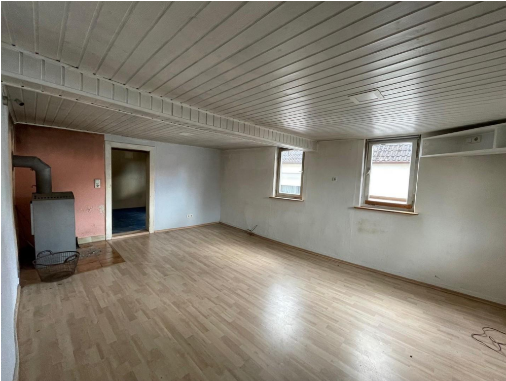
Haupthaus Zustand 5