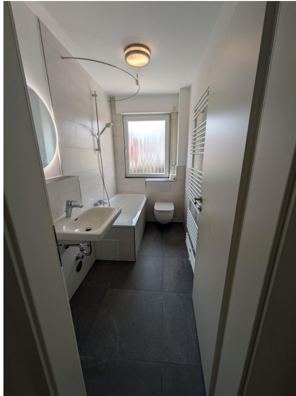
Bad mit Tageslichtbad