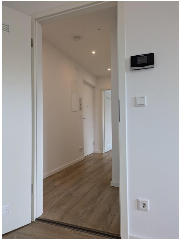
Blick Zimmer 2 in Flur