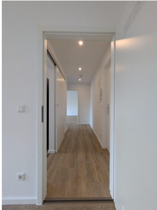
Blick Zimmer 1 in Flur