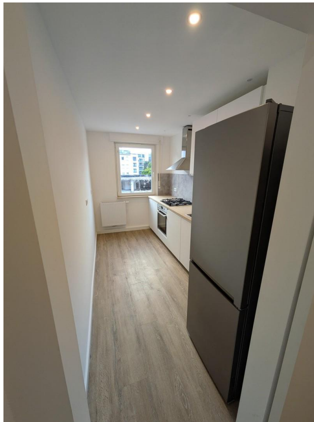
Blick Flur in Küche