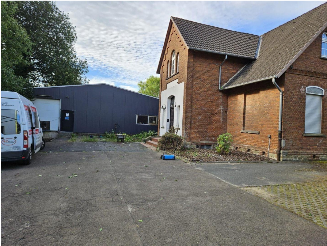
Eingang zur Halle mit Tor