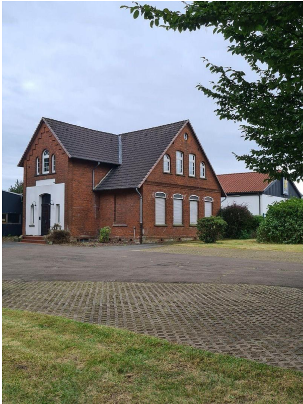
Büro über 2 Etagen