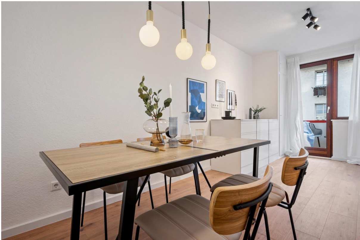
Gut geschnittene Wohnküche