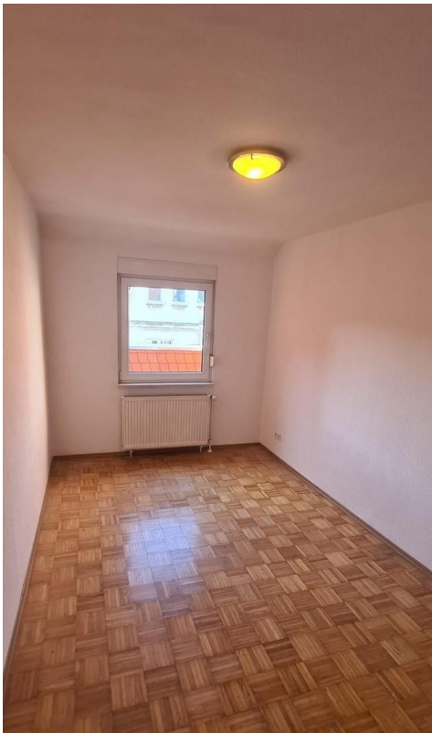
Arbeits- oder Kinderzimmer